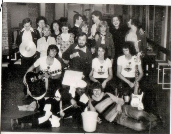
KLUB MLADÝCH - VSETÍN