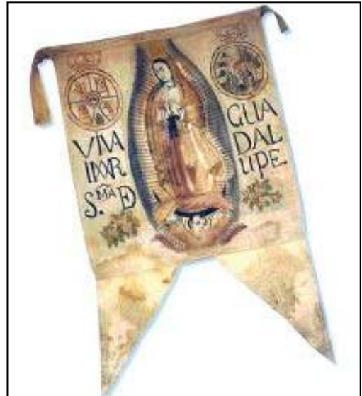
Imagen 5: El estandarte en la Independencia

Sentimientos de la Nación. En dicho texto Morelos sentó las bases del trabajo, las cuales dieron como resultado el Decreto Constitucional para la Libertad de la América Mexicana. Uno de los Sentimientos de la Nación, numerado con el número 19 y muy importante hasta los días de hoy es el siguiente: "Qué en la misma se establezca por Ley Constitucional la celebración del día 12 de diciembre en todos los pueblos dedicados a la Patrona de nuestra