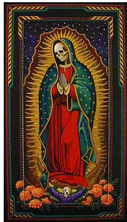
Imagen 11: Santa Muerte