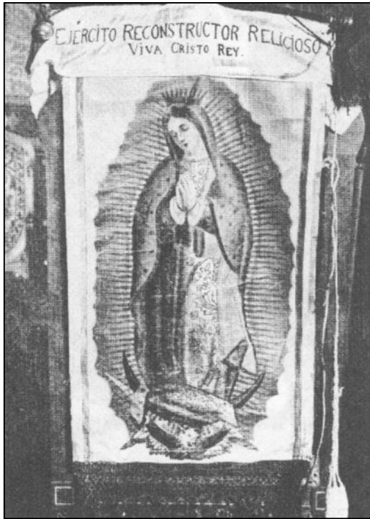
Imagen 6: El estandarte de los cristeros con la imagen de la Virgen de guadalupe.

La guerra cristera duró tres años y durante estos años perdió vida más gente que durante la Revolución mexicana. Se logró uso muy eficaz de símbolos religiosos profundamente arraigados en las prácticas colectivas en México, como el símbolo de la Virgen de Guadalupe. Estos acontecimientos han hecho del catolicismo mexicano un caso atípico en la comparación con las experiencias del catolicismo en el resto de Hispanoamérica.