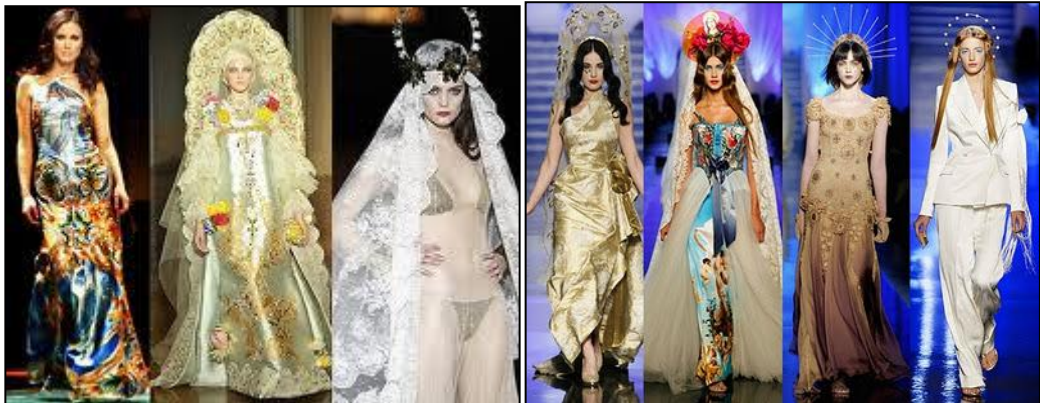
Imagen 8: Diseños de: Mafud, Christian Lacroix y Andrés Sardá

En el año 2011 los diseñadores de algunas marcas de la industria de moda, como Mafud, Christian Lacroix, Jean Paul Gaultier y Distrollesin sorprendieron con las colecciones de ropa, donde los modelos fueron inspirados precisamente en este ícono sociocultural que le ofrece a la sociedad los sentimientos de la esperanza y fe.