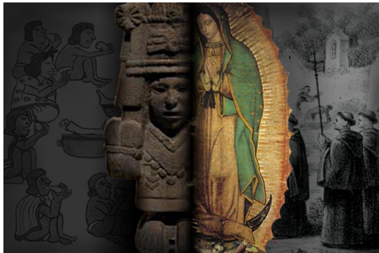
Imagen 4: La Tonantzin/La Virgen de Guadalupe Autores: Holda Nieto/Carlos Moneda; Fuente: http://www.poblanerías.com

A esta divinidad se le llamaba Tonán ("Nuestra madre") o Tonantzin ("Nuestra venerada madre"); una denominación que en el México antiguo fue aplicada en general a las diosas de la tierra y a sus muchas variantes, que eran tenidas como procreadoras de los dioses y del género humano. Por ejemplo se le llamaba Tonán a Tlazoltéotl, ante quien los adúlteros iban a confesarse para librarse de su culpa y escapar del castigo establecido. Ella parece coincidir con Teteoinnan ("Madre de los dioses"), o bien con Toci ("Nuestra abuela"), la diosa de la fiesta del maíz maduro Ochpaniztli ("Barrido del camino"). 12