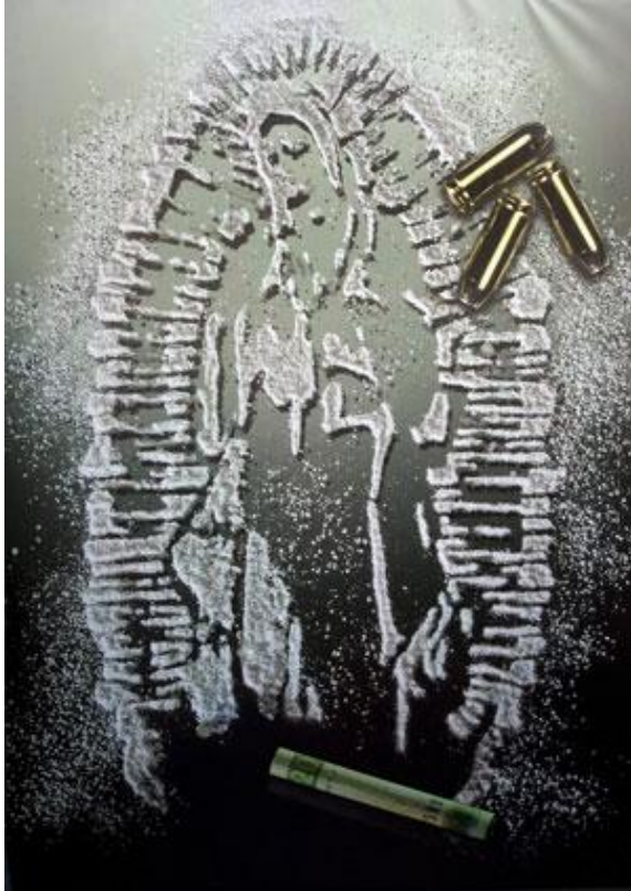
Imagen 10: El cartel promocional de la película Morenita

La película fue rodada en el año 2009. Antes de su estreno despertó grandes discusiones, porque el cineasta "se atrevió" juntar el problema del narcotráfico con la Virgen de Guadalupe, lo que causó mucho desacuerdo de parte de los espectadores. Lo que llamó más atención de la gente fue el cartel de la película en el cual la imagen de la Virgen de Guadalupe está delineada con cocaína. El mismo cineasta se daba cuenta del significado de la Virgen para los mexicanos, por eso escogió la imagen como el tema principal para la película y unió la Guadalupeana con el narcotráfico. De esta unión salió el término narcoguadalupano .