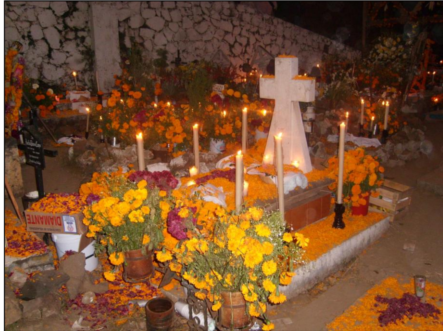
Imagen 3: El día de muertos en la isla Janitzio

Una muestra ejemplar del sincretismo religioso es la celebración del Día de Muertos. En México, tal como en otros países, se celebra en las mismas fechas, el 1 y 2 de noviembre, sin embargo, la manera de festejar es diferente.