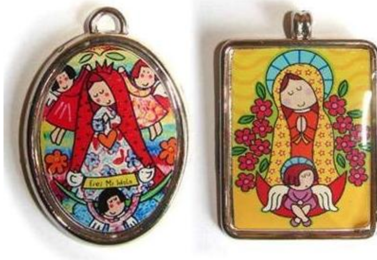
Imagen 7: Las medallas con la imagen de la Virgen de Guadalupe

Parece que los católicos se están olvidando de este episodio de la Biblia y en la tienda dentro de la Basílica compran muchísimos recuerdos. Lógicamente también en los alrededores hay un sinfín de tiendas donde cada uno puede comprar algún recuerdo de este lugar