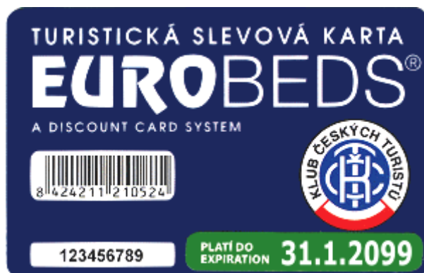
Obrázek č. 4 Karta Eurobeds 58

6. Slevy na dopravu – při turistické činnosti poskytuje KČT svým členům příspěvek na dopravu. Tato dotace je poskytována při zakoupení zvýhodněných druhů. Týká se to při zakoupení kilometrické banky od Českých drah. 57