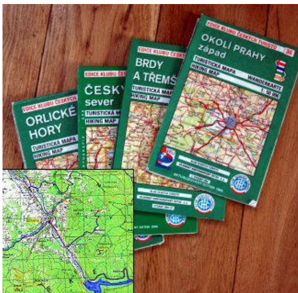
Obrázek č. 3 Turistické mapy 40

Mapy mají jednotné měřítko 1:50 000, jednotný obsah i formu. Mapy jsou tvořeny tak, aby pokrývaly pokud možno celé turistické území. V mapě najdeme kartografickou mapu se značenými trasami, legendu značení, doprovodné texty a reklamu. 39