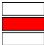
Obrázek č. 2 Značka pro pěší turistiku 37

V současné době Klub českých turistů označuje nejen pěší trasy, ale také cyklistické, cykloturistické či lyžařské a od roku 2005 označují také hipotras, tedy tras pro jízdu na koni.