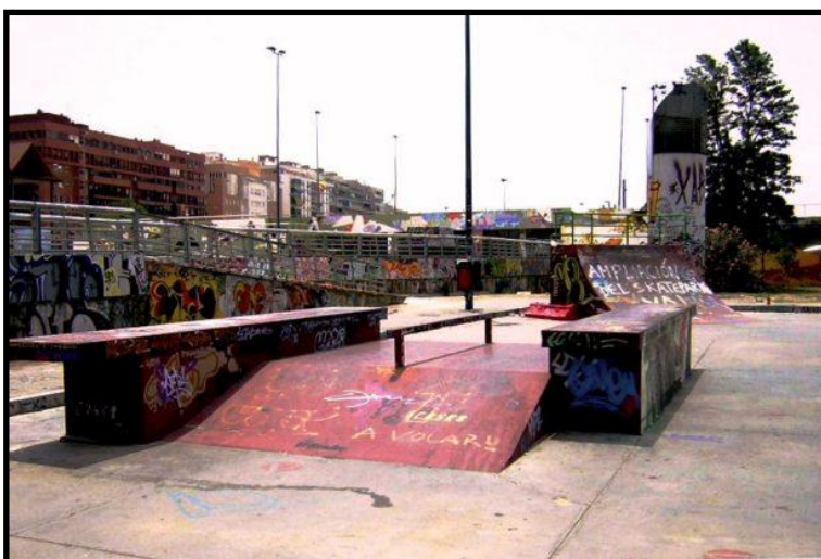
Imagen 11: El antiguo skatepark de Plaza de Armas, http://www.redbull.es/cs/Satellite/es_ES/Article/Sevilla-a-punto-para-el-ruedo-021242850758292

El último tema que quiero tratar en este capítulo está relacionado con la cercanía del mundo de skate con el mundo de la subcultura de grafiti o hiphop. Estas dos tribus urbanas pertenecen a dos subculturas estrechamente lindantes. No es nada inusual ver la zona del skatepark y sus alrededores pintados por los grafiteros. De hecho, es una práctica común no sólo en Sevilla, sino en todo el mundo. También en los libros podemos encontrar varias menciones de ello, así que podemos considerar los libros copias de la realidad urbana en Sevilla. Una muestra está en el libro En el filo : “Grafitis multicolores de diferentes estilos llenaban todos los elementos del skatepark y eran escasos los centímetros donde se apreciaba el color original del cemento de las estructuras.” 234