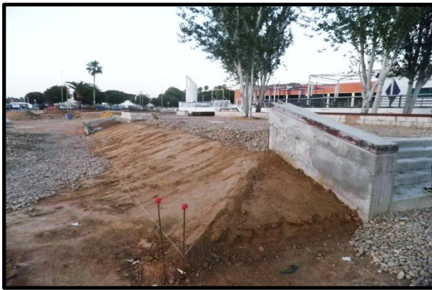
Imagen 6: La ampliación del skatepark de Plaza de Armas en construcción, octubre 2010.