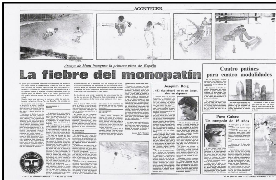
Imagen 3: Un periódico de la época, http://www.40sk8.com/el-desentierro-del-skate-park-arenys/

Vasco). 111 El año pasado se desenterró una parte del parque Arenys de Munt que fue cerrado en 1982, el proceso se puede ver en el documental corto Digging. 112