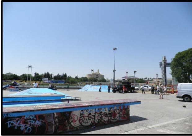
Imagen 4: El skatepark antiguo de Plaza de Armas, abril 2010.