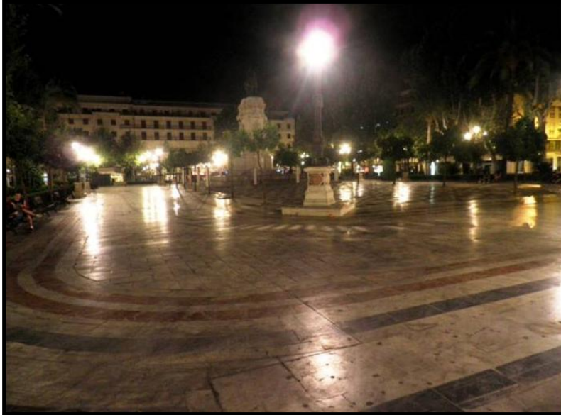
Imagen 8: La Plaza Nueva, octubre 2010, fotografía mía.

En lo que concierne a la relación de los skaters con la literatura, los respondentes coinciden en lo que leer es una actividad muy importante para uno. De los doce cuestionarios ocho skaters respondieron que leen mucho, sus palabras eran: “Todos los días”, “Casi todas las noches”, “A diario” o “Constantly and always”, etc. El otro grupo de cuatro personas dijo que lee: “Alguna vez que otra”, “Poco” o “Sí, pero no mucho”. El tipo de literatura ya nos ofrece una variedad de respuestas más amplia. Se trataba sobre todo de: “revistas de skate” que eran lo más leído de todo, “páginas web”, “literatura sobre todo de aventura”, “especialmente novelas”, “blogs” o “almost exclusively non-fiction books”. Analizando los cinco libros podemos decir con certeza que los personajes se interesan sobre todo por las revistas de skate en lo cual coinciden con los skaters sevillanos. Sólo un personaje de todos destaca por su afición por lectura, es Adrián. Como hemos visto en el fragmento de uno de los libros de la trilogía Skaters , le gustaban tanto los libros que se encerraba en su cuarto sin salir. La lectura de las revistas de skate se puede considerar como un tipo característico de literatura de los skaters, es más, junto con las páginas web son la mayor fuente de la información para los patinadores. Al leer las revistas de skate los personajes literarios cumplen bien su papel ficcional como skaters porque sus “modelos” reales hacen precisamente lo mismo.