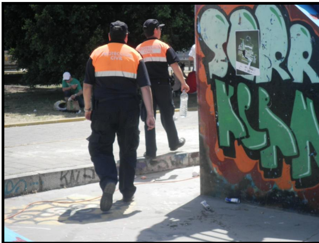
Imagen 7: Dos policías se van del antiguo skatepark de Plaza de Armas tras pedir la documentación a varios chicos, abril 2010, fotografía mía.

Analizados los fragmentos de los libros, vemos que realmente reflejan la realidad sevillana de los skaters. Los policías representan un obstáculo para ellos y los consideran sus enemigos verdaderos a la hora de patinar. Ambos, los personajes y los patinadores de Sevilla, concuerdan en este asunto.