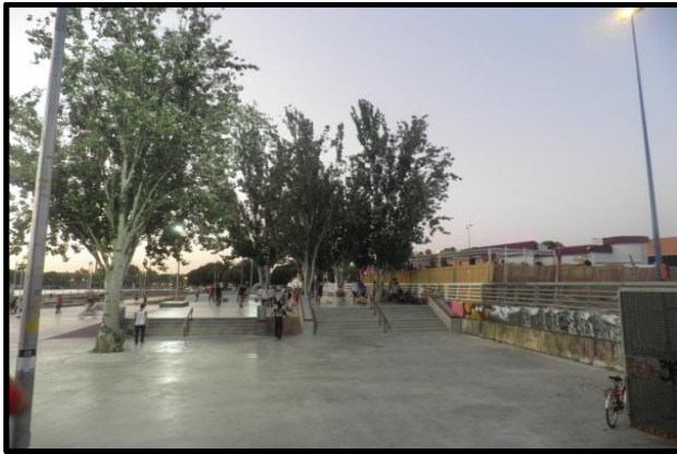
Imagen 5: La ampliación del skatepark de Plaza de Armas terminada, noviembre 2013, fotografía mía.