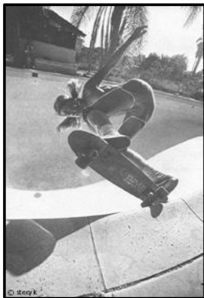
Imagen 1: Stacy Peralta en Skateboarder Magazine, junio 1976