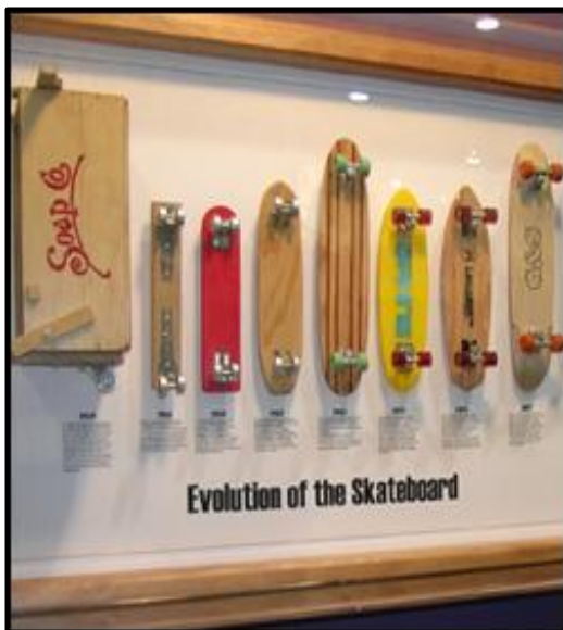
Imagen 2: La evolución del skateboard, http://teacher.scholastic.com/scholasticnews/indepth/Skateboarding/articles/index.asp?article=history&topic=0

es vista como algo ilegal o peligroso para la sociedad. Se construyen nuevas pistas del skate en cada ciudad o municipio por todo el mundo. Varios videojuegos inspirados en el tema del skate son lanzados como la serie de Tony Hawk's Pro Skater 102 y publicidades con skaters profesionales aparecen con frecuencia. Marcas de gran fama especializadas en otros deportes empiezan a patrocinar el mundo del skate; entre otras podemos mencionar Nike que traslada su interés al skateboarding en 2002. 103 En los últimos años surgen otros tipos de grandes competiciones televisadas, como por ejemplo Dew Tour, the Maloof Money or Street League cuya misión según sus páginas web es "to foster the growth and popularity of street skateboarding worldwide." 104 Siguiendo esta tendencia, dentro de un par de años quizá escuchemos sobre el skateboarding como una de las disciplinas en una de las olimpiadas verdes próximas.