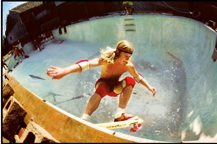
Imagen 7: Stacy Peralta, Coldwater Canyon, junio 1977

Las preguntas hechas en los cuestionarios intentan averiguar sobre todo cómo se ven los skaters a sí mismos, cómo creen que les ve la sociedad y qué significa el skateboarding para ellos. Hay una serie de preguntas que tratan la literatura para averiguar qué relación tienen los patinadores con los libros o el mundo literario.