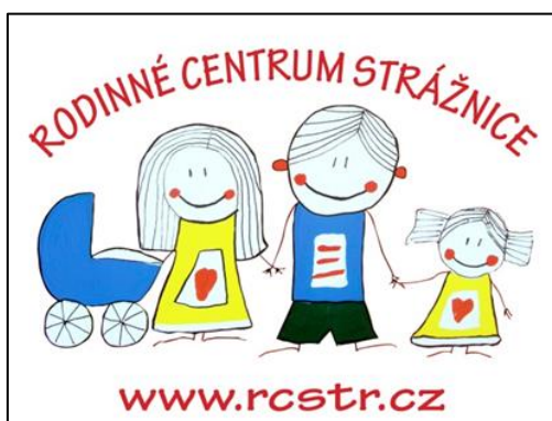
logo CPR 3

Hlavním popudem pro jeho vznik byla přeměna farností nevyužívané farní zahrady na prostory otevřené rodinám s dětmi i seniorům. 2