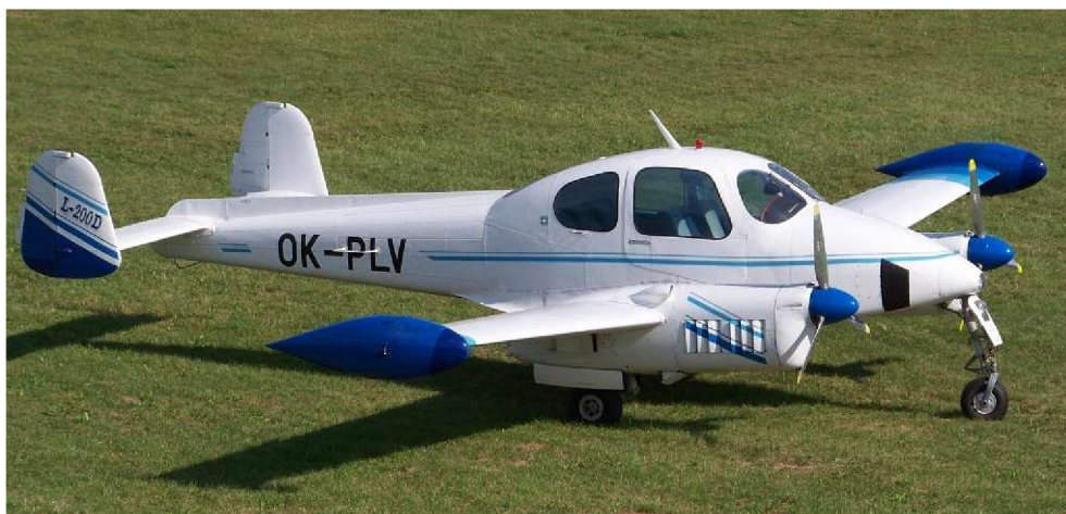
Obr. 1.2 Letún L200D kategórie MEP land

ATO musí disponovať letúnom z kategórie MEP land.