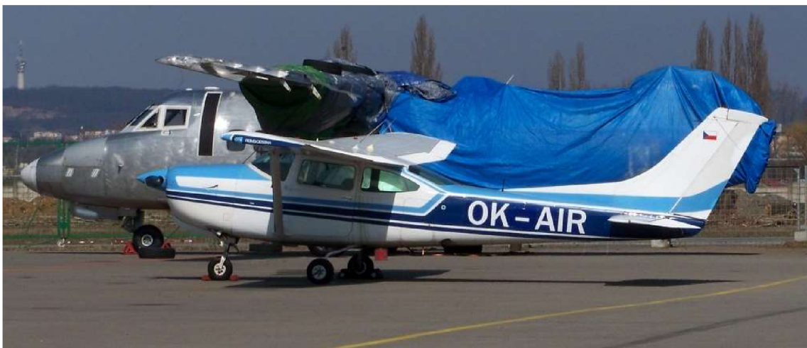
Obr. 1.1 Komplexný výcvikový letún Cessna FR182

Úspešným absolvovaním záverečnej praktickej skúšky pilot preukazuje schopnosť vykonávania príslušných postupov a manévrov danej kategórie lietadiel vo funkcii veliaceho pilota. 11