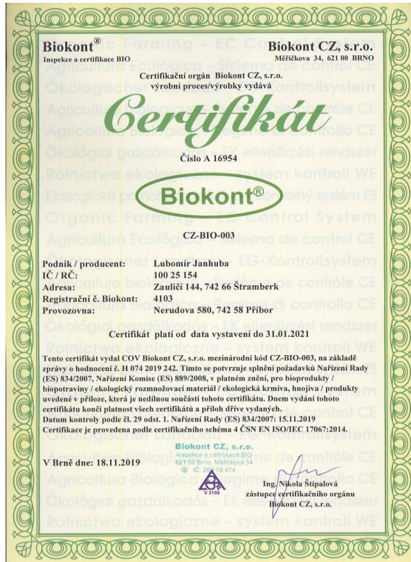
Obrázek č. 5.: Certifikát. Biokont CZ, s.r.o.