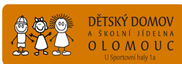
Obrázek č. 1 Logo dětského domova 54