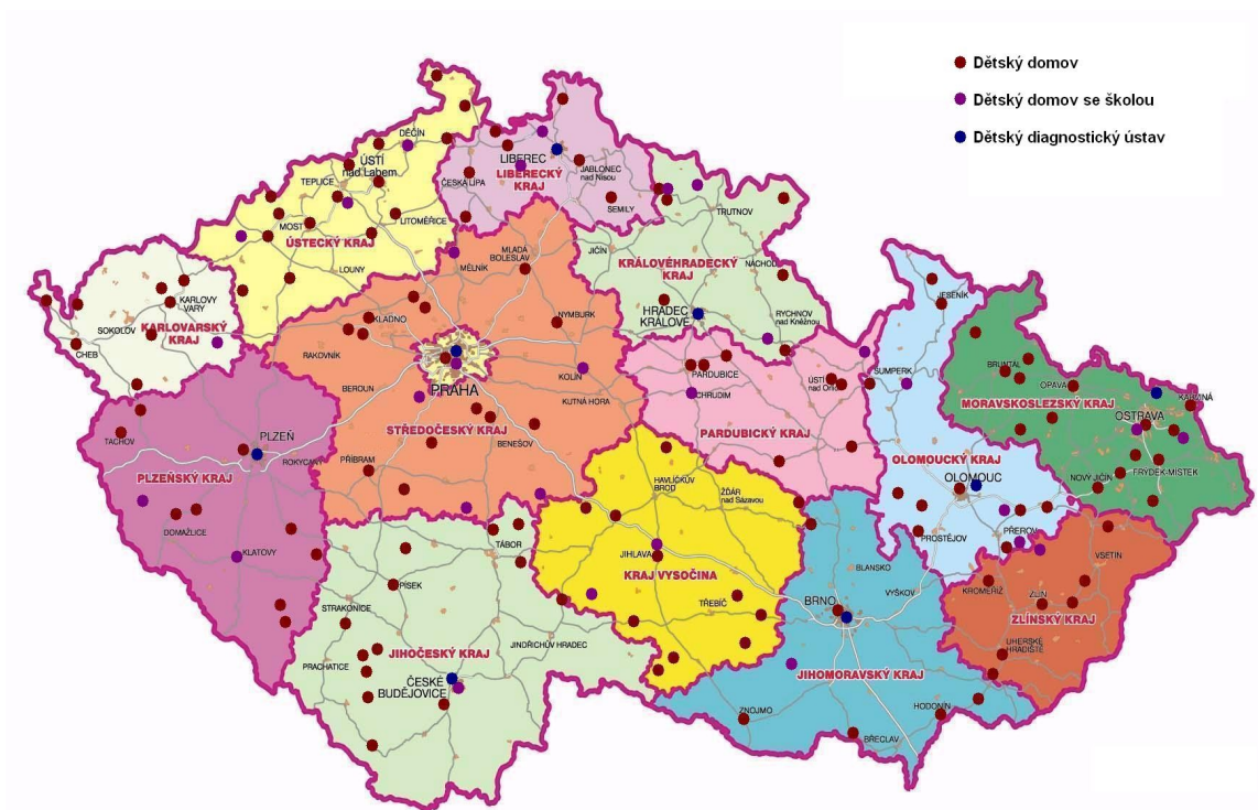
Mapa č. 1 Ústavní zařízení v České republice 42

Následující mapka znázorňuje ústavní zařízení na území České republiky. Nejaktuálnější data pochází z roku 2011. V tomto roce bylo v Česku celkem 14 diagnostických ústavů, 149 dětských domovů, 31 dětských domovů se školou a 33 výchovných ústavů. 41