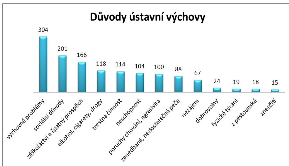
Graf č. 2 Důvody nařízení ústavní výchovy 48

terminologii pro popis dané problematiky (např. „výchovná neschopnost rodičů“, „nevhodné podmínky pro výchovu“). Nejčastěji je ústavní výchova nařizována kvůli nejružnějším výchovným problémům dětí. Hned na druhém místě jsou sociální důvody. Třetím důvodem je záškoláctví a zhoršení prospěchu ve vyučování. Následuje užívání alkoholu, cigaret či jiných drog dětmi, protiprávní činy mládeže či drobné krádeže a neschopnost rodičů postarat se o dítě. Dalším častým důvodem nařízení ústavní výchovy jsou poruchy chování, včetně agresivity dítěte a zanedbaná či nedostatečná péče o dítě, nezáměr rodičů o dítě. Méně častý byl případ, kdy by o ústavní výchovu žádal sám nezletilý. Týrání či nepřiměřené fyzické trestání se naštěstí objevilo jen zřídka, stejně tak zneužití dětí. Zejména u starších dětí se objevily i případy, kdy byla ústavní výchova nařízena na žádost rodičů, resp. kdy návrh na nařízení ústavní výchovy či podnět k uložení předběžného opatření podávali rodiče. 47