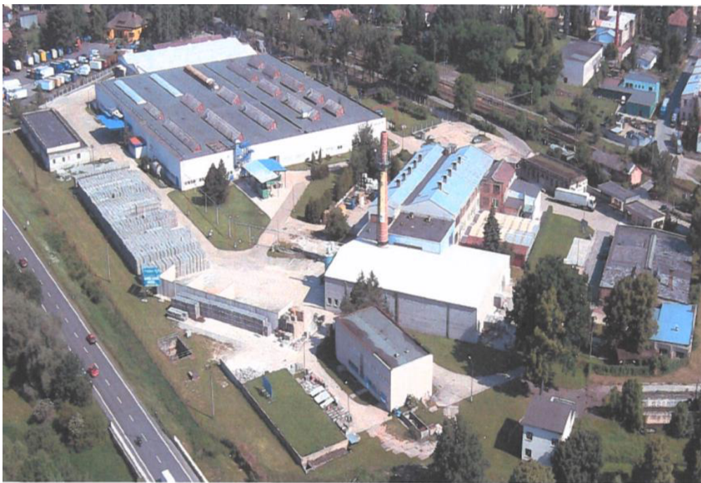
Obrázek 7 – Letecký pohled na průmyslový areál Tanex

Společnost Tanex, akciová společnost byla založena v roce 1990 s prvotním záměrem podnikání v oboru koželužského průmyslu. Transformacemi podnikatelských činností a vlastníků se společnost propracovala až do současné podoby, kdy hlavními činnostmi jsou nyní pronájem nemovitostí, výroba betonových prefabrikátů a stavební činnost. Poslední uvedená aktivita je nejmladší a společnost ji začala vykonávat v roce 2015. (Obrázek 7, zdroj: Výroční zpráva společnosti Tanex, akciová společnost za období 1.1. – 31.12.2021)