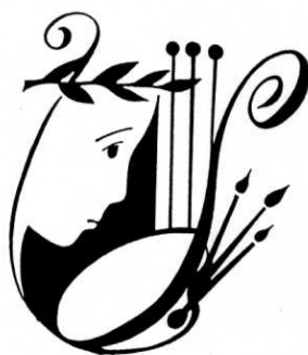
Obrázek č. 5 – Logo ZUŠ Šumperk

dětského sboru. Na počátku školního roku 1961/62 se počet žáků pohybuje kolem 850 a v organizační struktuře školy dochází ke změnám. Hudební škola v Šumperku je přejmenována na Lidovou školu umění a výuka se během několika následujících let rozšiřuje do čtyř uměleckých oborů – hudebního, tanečního, literárně dramatického a nového, nehudebního oboru – výtvarného. 71 O výtvarný obor je již od počátku velký zájem – v prvním roce se do něj hlásí 67 žáků, o deset let později je jejich počet již téměř dvojnásobný. 72 Do jeho čela přichází akademický sochař Jiří Jílek (viz kapitola 4.1.1), který svým významem přesahuje oblast šumperského regionu a podle nějž je pojmenována i jedna z galerií v Šumperku (viz kapitola 1.3.2). Mimo jiné je také autorem loga školy, které je používáno dodnes.