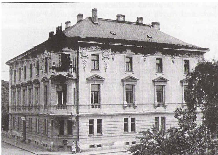
Obrázek č. 3 – Budova Základní umělecké školy v Šumperku

Problémem je nedostatek notovin, dobrých hudebních nástrojů, pomůcek a vhodných učeben. 57 Škola sídlí v budově bývalého zámku, kde jsou místnosti určené pro výuku naprosto nevyhovující. Díky schopnostem a pílí nového ředitele se ale již tři měsíce po jeho nástupu do funkce škola stěhuje do budovy na Žerotínově ulici, ve které sídlí dodnes. Jedná se o budovu ve stylu přechodného období mezi novorenesancí a secesí z roku 1897 vídeňských architektů Antonína Drexlera a Josefa Drexlera, která původně patřila rodině Primavesi. 58