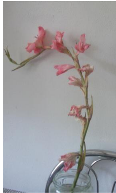
Obr. č.16 'Libertas' č. 1 6. den