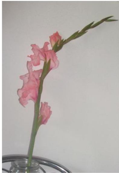
Obr. č. 11 'Libertas' č.1 4. den