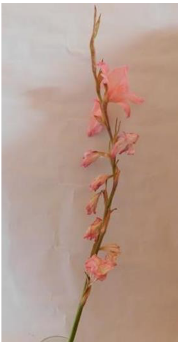
Obr. č. 13 'Libertas' č. 1 7. den