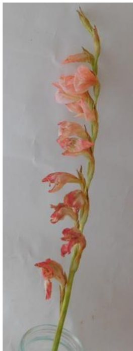
Obr. č.5 'Chloe' č.1 8. den