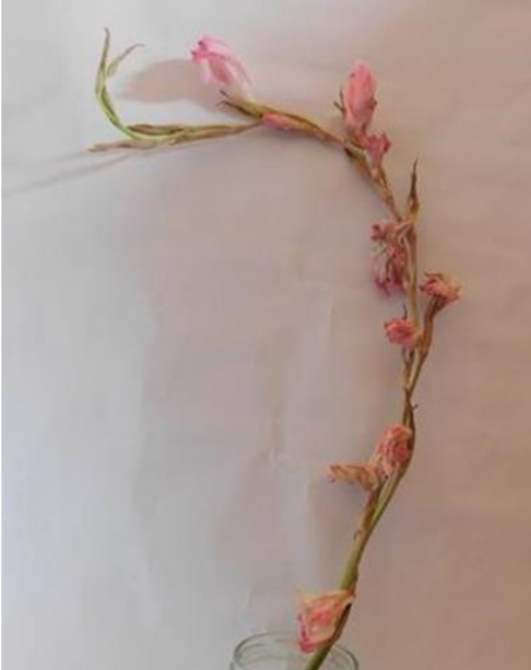
Obr. č. 17 'Libertas' č. 1 8. den