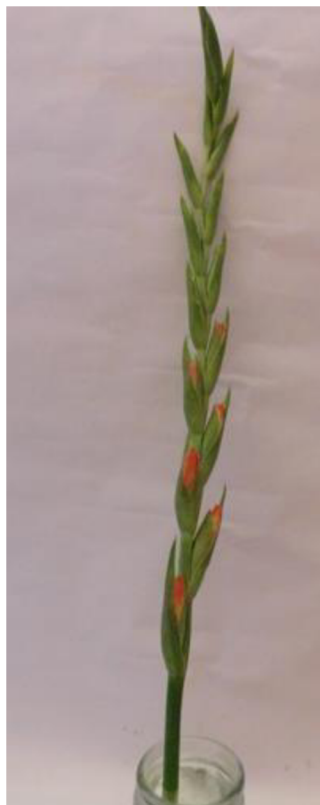
Obr. č. 23 'Adéla' č. 1 1. den