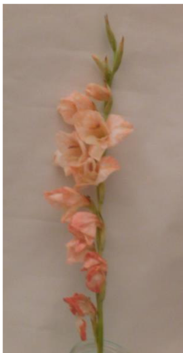
Obr. č. 4 'Chloe' č.1 6. den