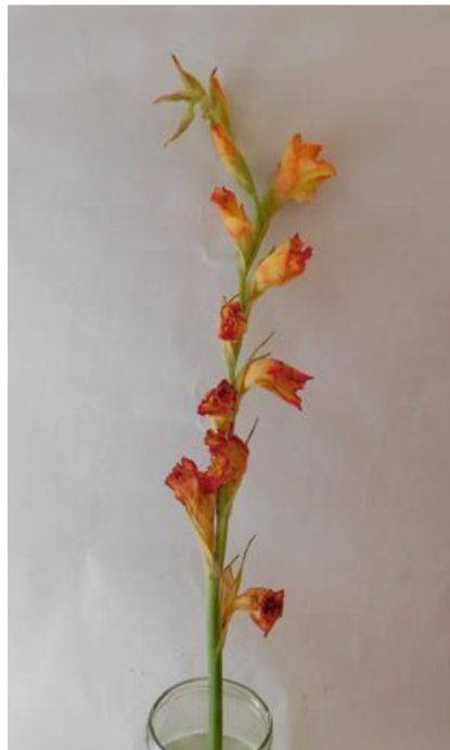
Obr. č. 22 'Adéla' č. 1 8. den