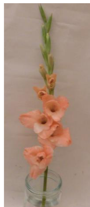
Obr. č.3 'Chloe' č.1 3. den