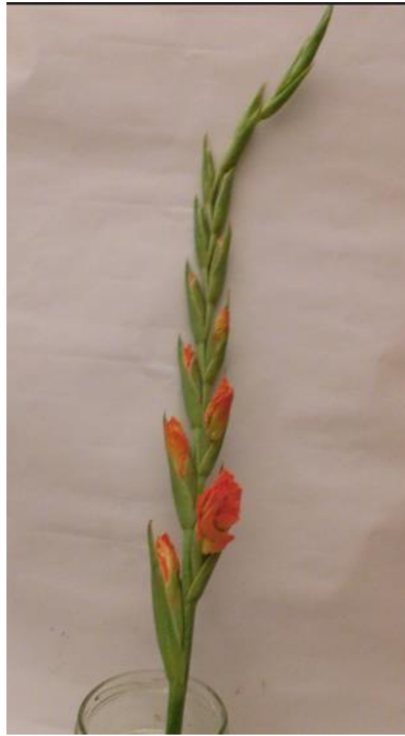
Obr. č. 19 'Adéla' č. 1 2. den