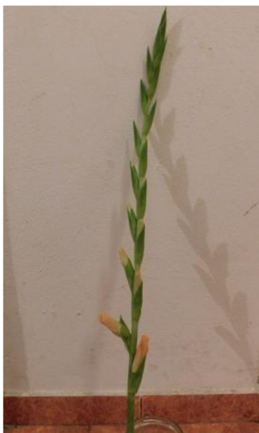
Obr. č. 6 'Chloe' č. 1 1. den

Příloha č.2 Průběh vadnutí odrůdy 'Chloe' v destilované vodě s přípravkem na prodloužení trvanlivosti.