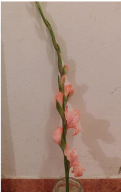
Obr. č.14 'Libertas' č. 1 2. den

Příloha č. 4 Průběh vadnutí odrůdy 'Libertas' v destilované vodě s přípravkem na prodloužení trvanlivosti.