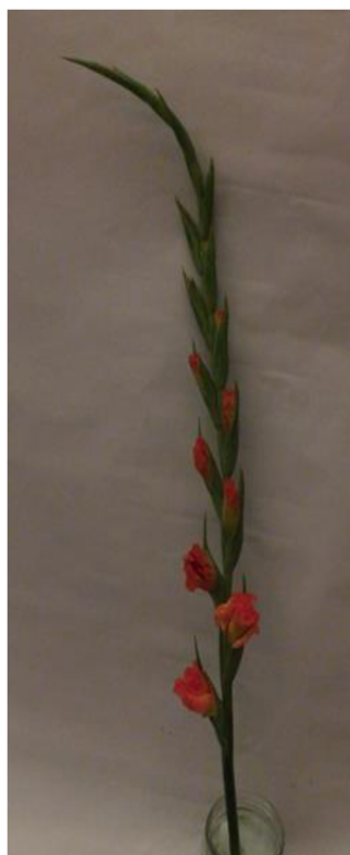
Obr. č. 24 'Adéla' č. 1 3. den