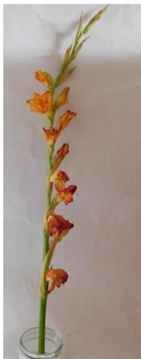
Obr. č. 26 'Adéla' č. 1 8. den