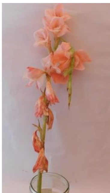
Obr. č. 9 'Chloe' č. 1 8. den