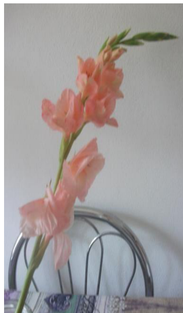
Obr. č. 8. 'Chloe' č. 1 5. den