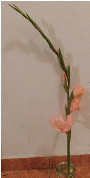
Obr. č. 10 'Libertas' č. 1 2. den