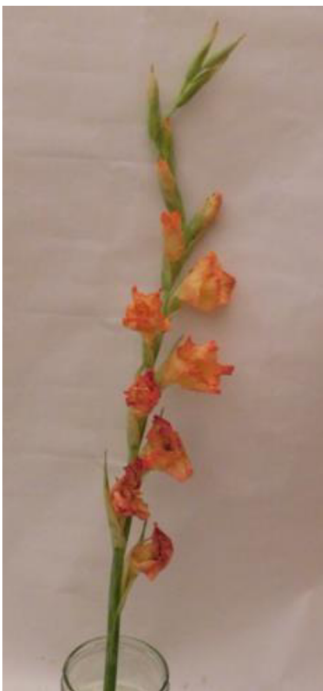
Obr. č. 21 'Adéla' č. 1 6. den