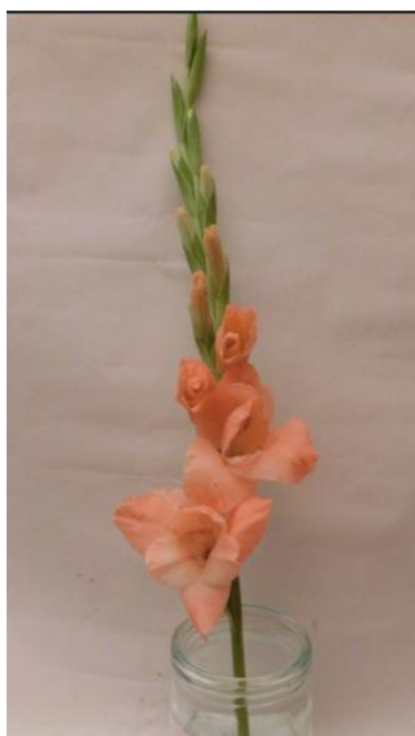
Obr.č.2 'Chloe' č.1 2. den