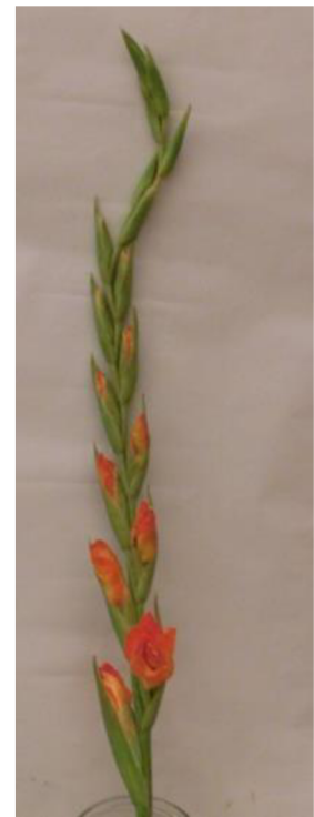
Obr. č. 20 'Adéla' č. 1 3. den