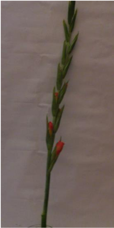
Obr. č. 18 'Adéla' č. 1 1. den

Příloha č. 5 Průběh vadnutí odrůdy 'Adéla' v destilované vodě s přípravkem na prodloužení trvanlivosti.