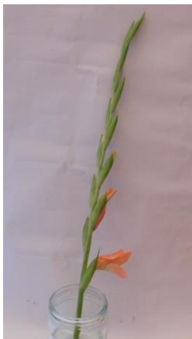
Obr. č.1 'Chloe' č.1 1.den

Příloha č. 1 Průběh vadnutí odrůdy 'Chloe' v destilovaný vodě.