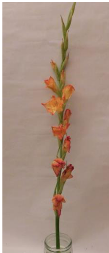
Obr. č. 25 'Adéla' č. 1 5. den