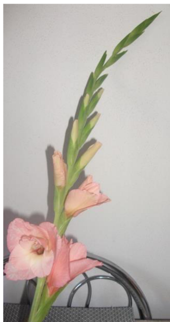
Obr. č. 7 'Chloe' č. 1 3. den