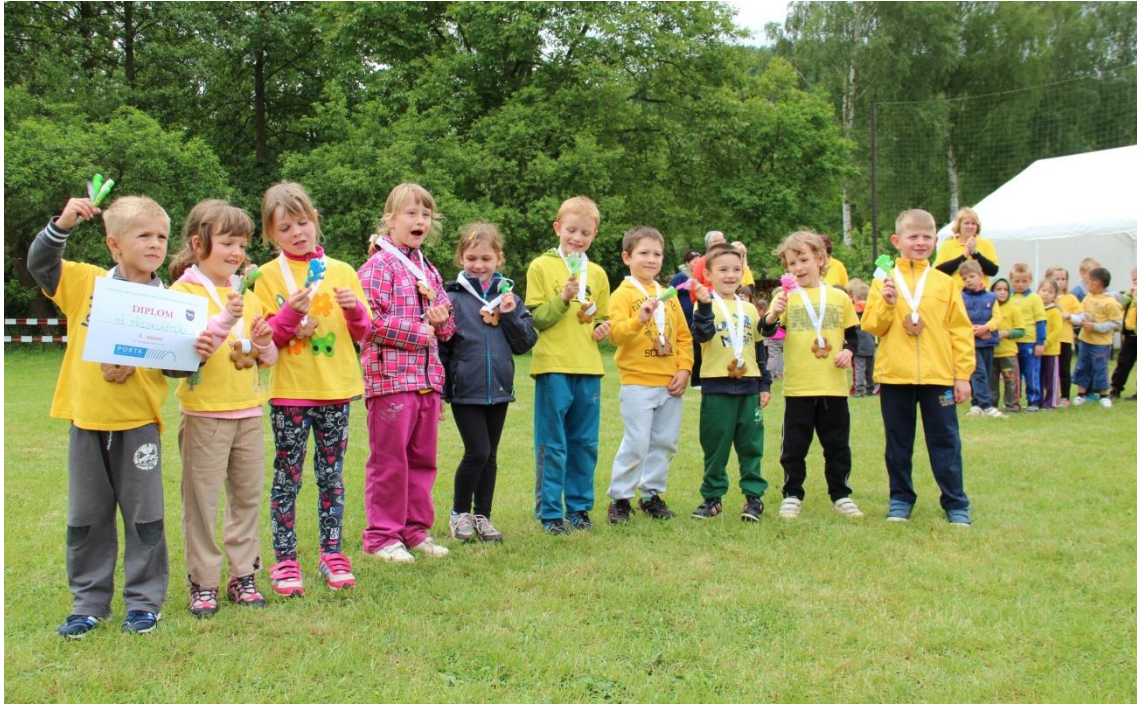
Obrázek 22: Slavnostní vyhodnocení soutěžních družstev, starší děti (5-6leté)