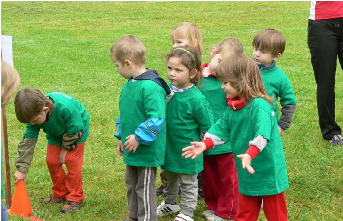
Obrázek 6: Spolupráce a komunikace mladších dětí před soutěžní disciplínou pětiskok