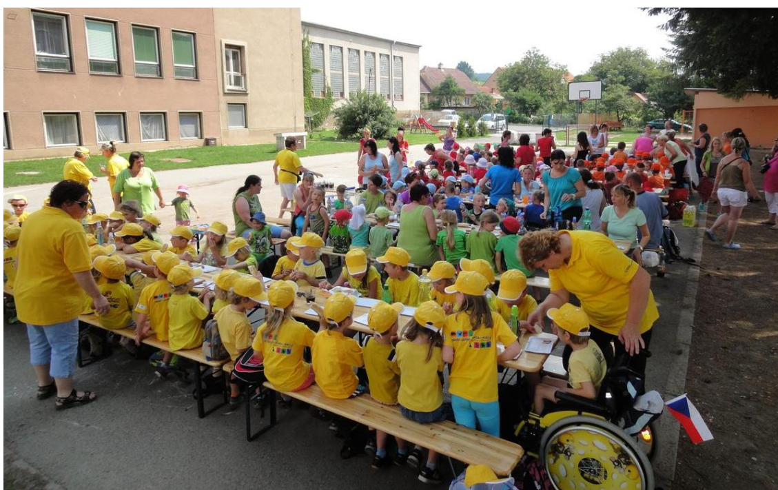
Obrázek 19: Odpočinek a občerstvení, zázemí sportovního areálu v roce 2010