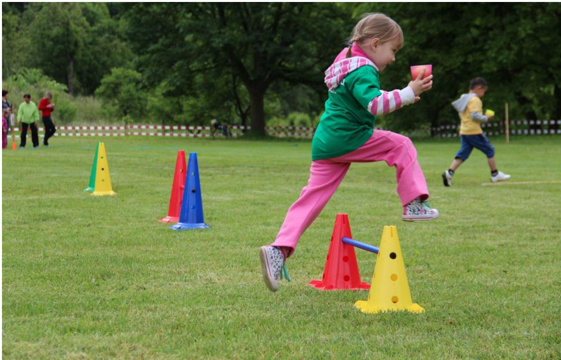
Obrázek 17: Soutěžní disciplína překážkový běh s míčkem, přeskokování překážek