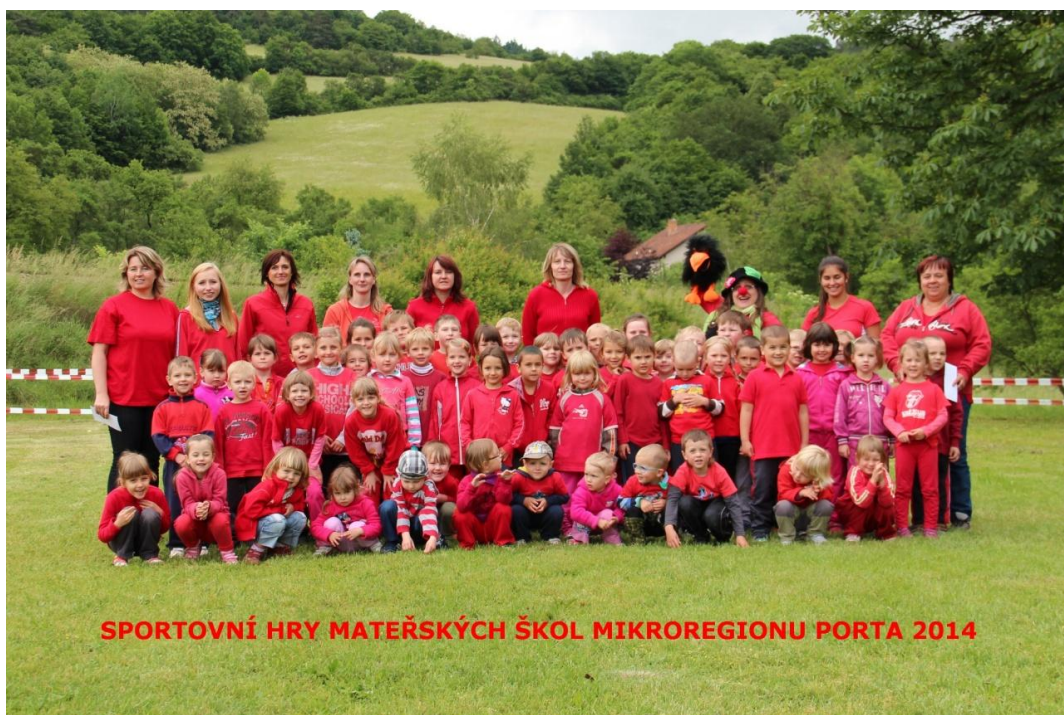
Obrázek 1: Soutěžící děti z mateřské školy Dolní Loučky v roce 2014