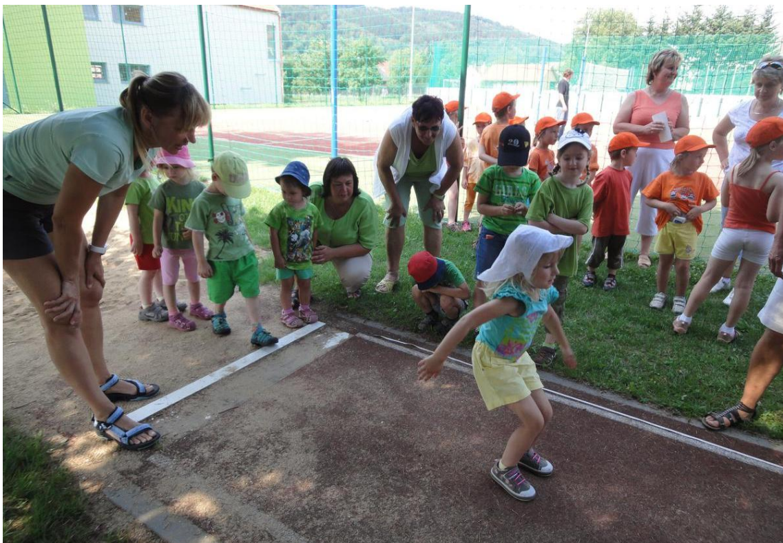
Obrázek 7: Soutěžní disciplína pětiskok ve sportovním areálu v roce 2010