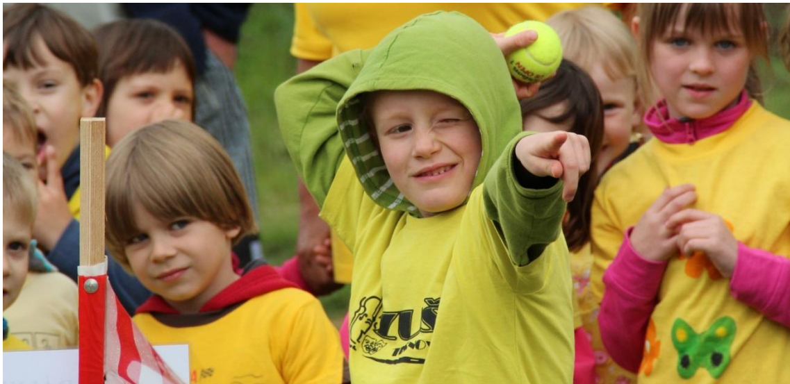
Obrázek 12: Soutěžní disciplína hod do dálky tenisovým míčkem, soustředění v týmu