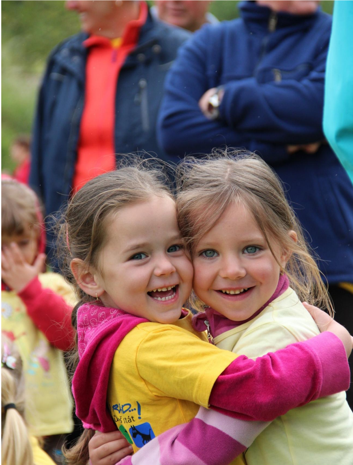
Obrázek 5: Upřímná radost dětí ze setkání a sounáležitosti s ostatními soutěžícími