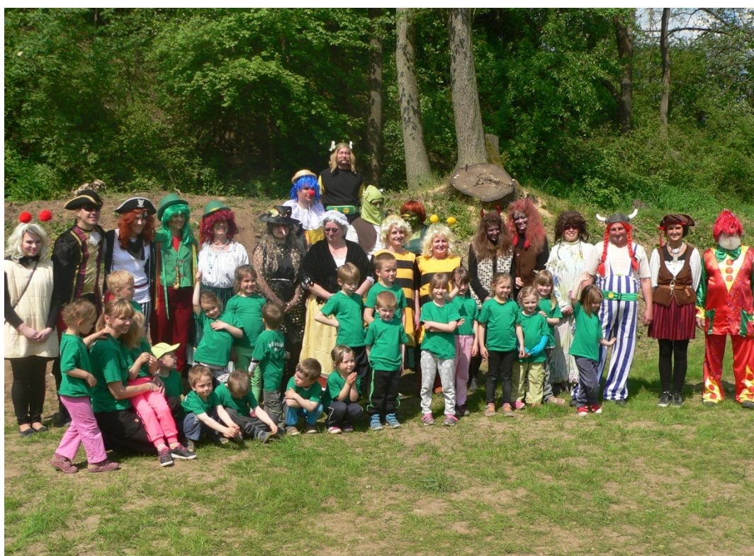
Obrázek 2: Děti a část realizačního týmu v pohádkových maskách v roce 2016