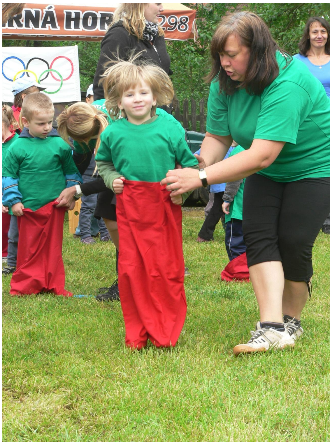
Obrázek 10: Soutěžní disciplína skoky v pytlí na trávě, mladší děti (3-4leté)