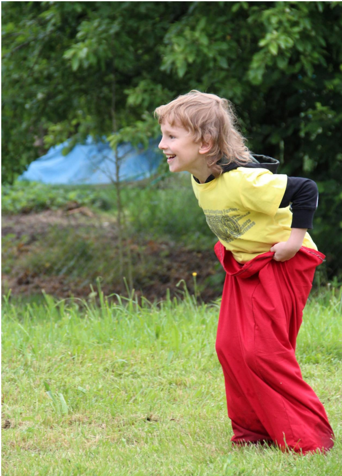
Obrázek 11: Soutěžní disciplína skoky v pytlí v přírodním terénu, starší děti (5-6leté)