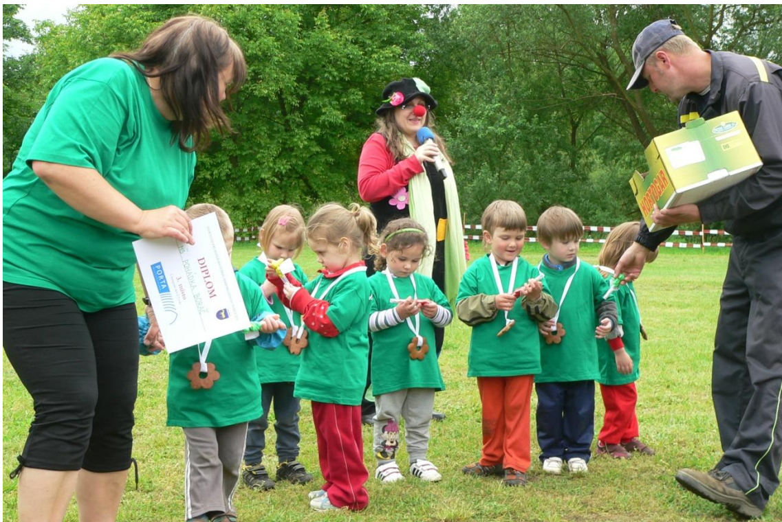
Obrázek 23: Slavnostní vyhodnocení soutěžních družstev, spolupráce realizačního týmu