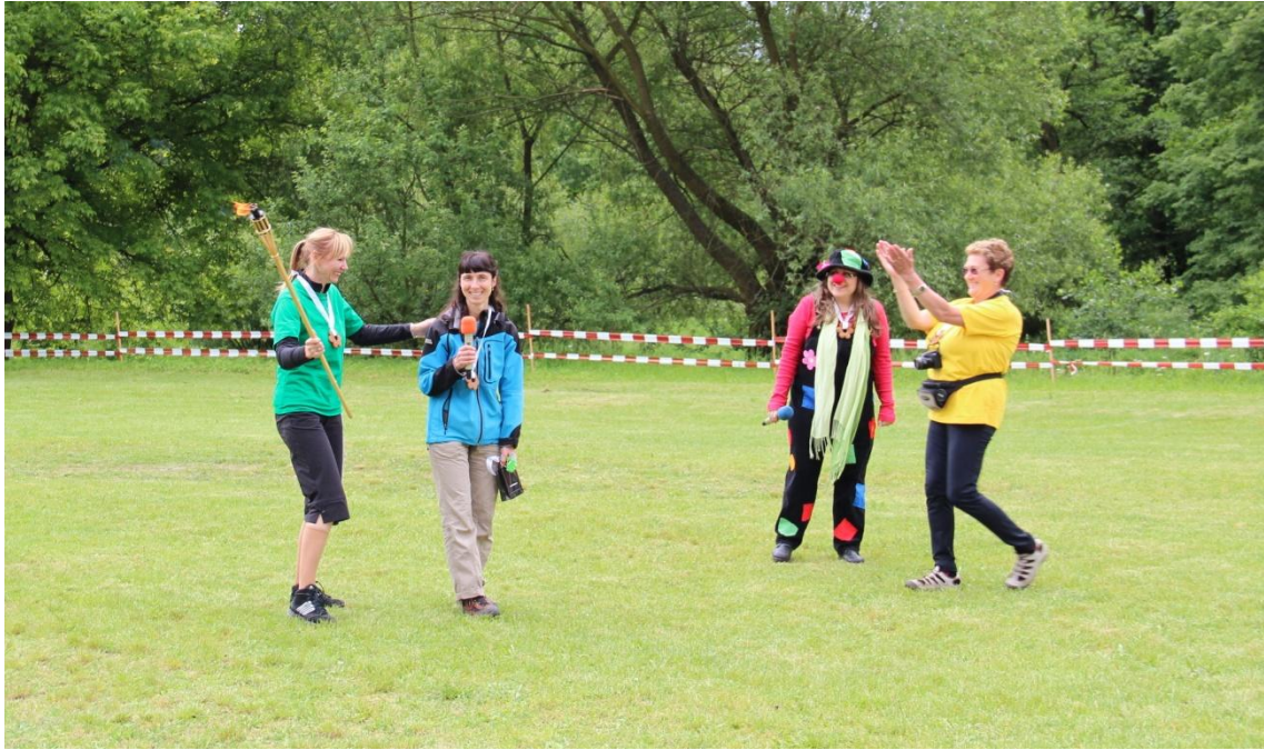
Obrázek 24: Slavnostní předání zapálené pochodně MŠ pro další ročník sportovních her