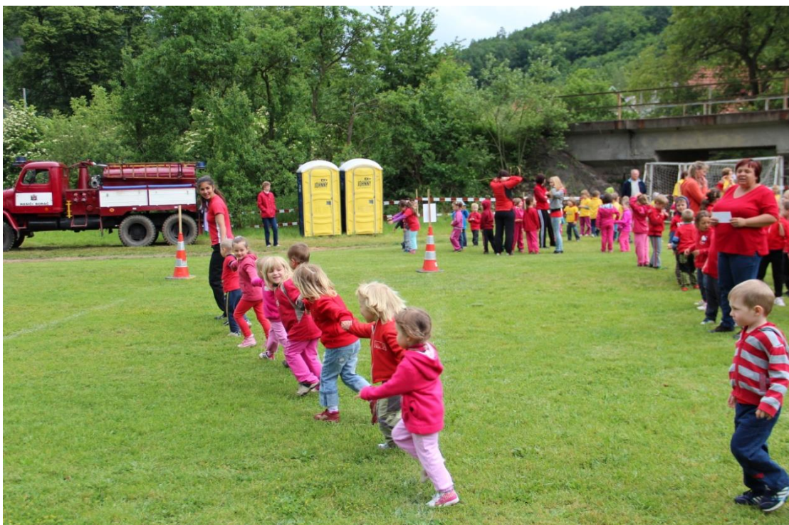
Obrázek 18: Ukázka části uměle připraveného prostředí (sociální zázemí) v roce 2014