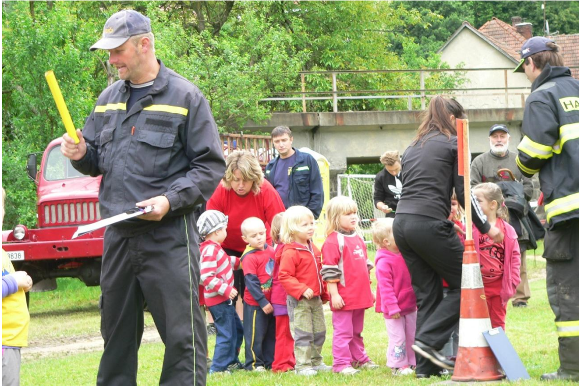
Obrázek 14: Soutěžní disciplína štafetový běh – ukázka práce realizačního týmu