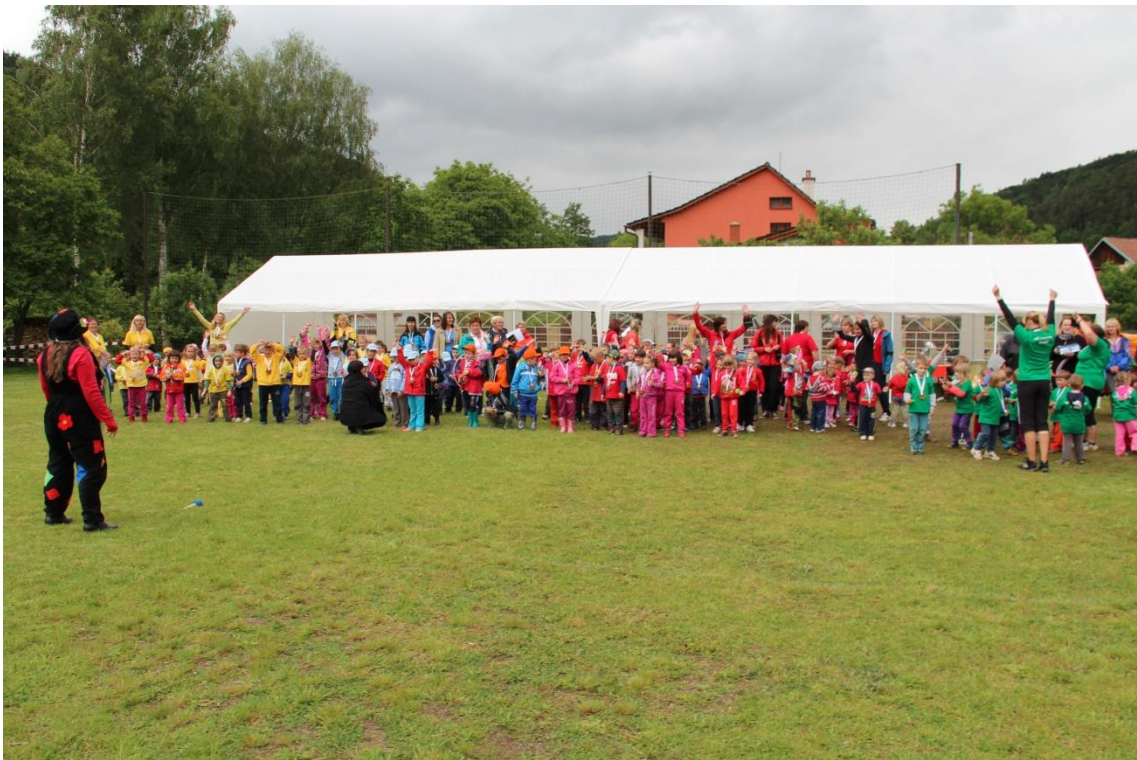
Obrázek 25: Společné rozloučení všech účastníků akce, poděkování a závěrečné ovace