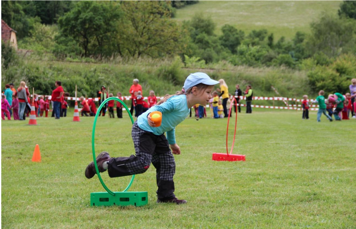
Obrázek 16: Soutěžní disciplína překážkový běh s míčkem, podlézání překážky