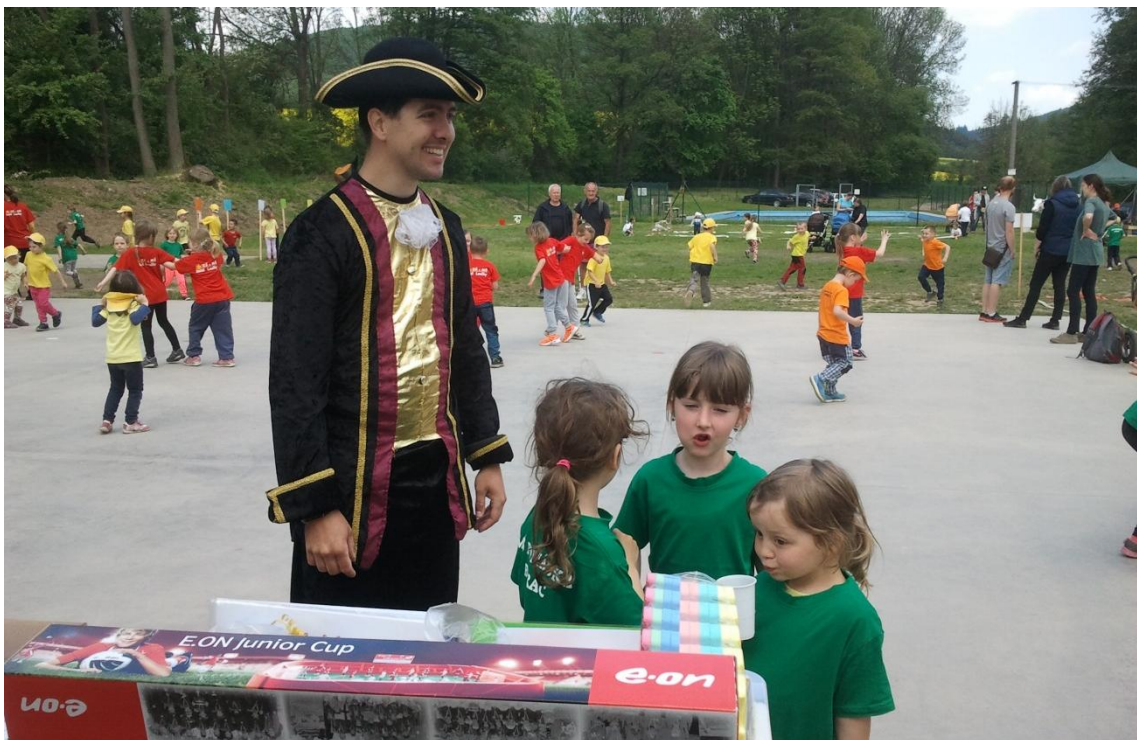
Obrázek 21: Spontánní pohyb dětí, prohlídka dárků pro MŠ se členy realizačního týmu