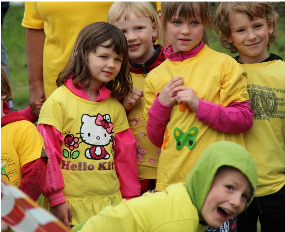
Obrázek 13: Sounáležitost ve skupině a emoce dětí v soutěžním družstvu