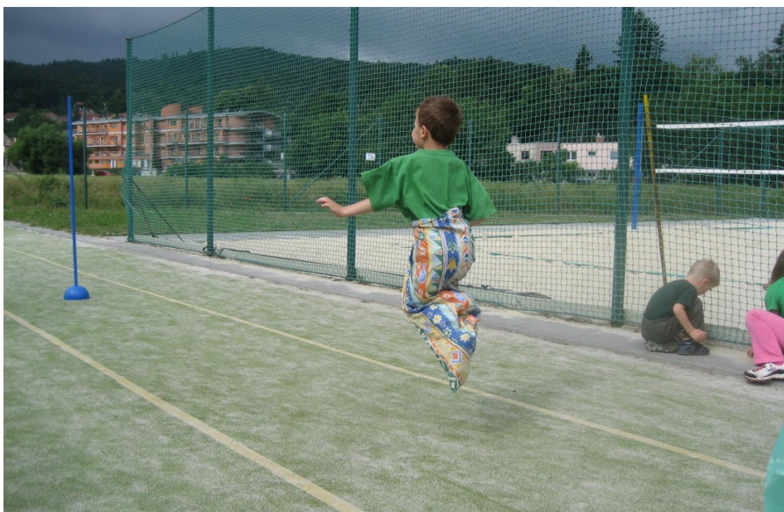
Obrázek 9: Soutěžní disciplína skoky v pytli na umělém povrchu v roce 2012