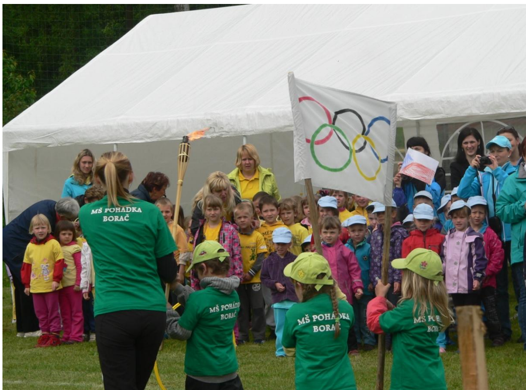
Obrázek 3: Tradiční slavnostní zahájení sportovních her Mikroregionu Porta