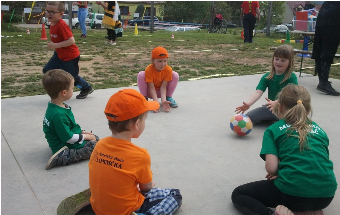
Obrázek 20: Spontánní pohyb a hry dětí v prostorách sportovního areálu v roce 2016