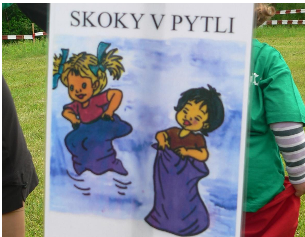
Obrázek 8: Ukázka vizuálního znázornění soutěžní disciplíny skoky v pytli