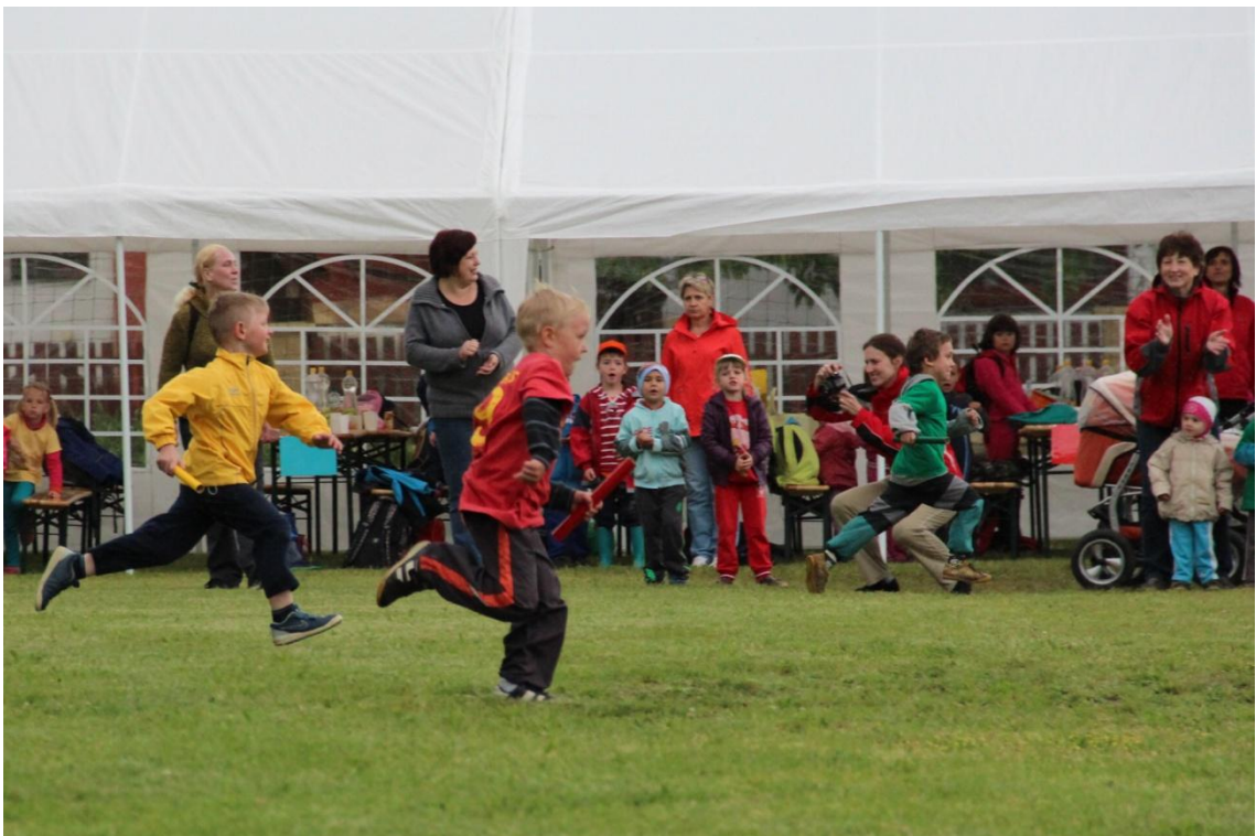
Obrázek 15: Radost z pohybu a rozvíjení fyzické zdatnosti dětí při štafetovém běhu