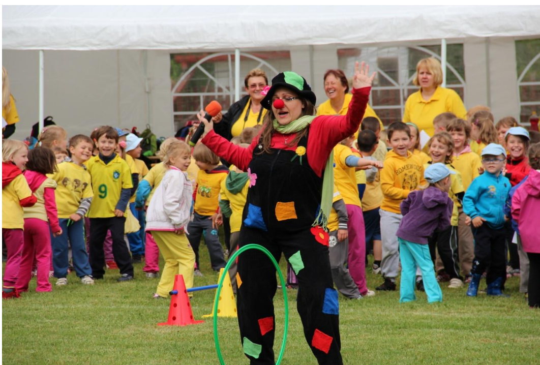
Obrázek 4: Společný zpěv známé písně Není nutno doprovázený pohybem dětí