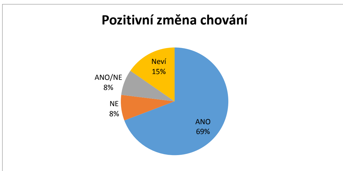
Obr. 2 – Pozitivní změna chování z pohledu komunikačních partnerů