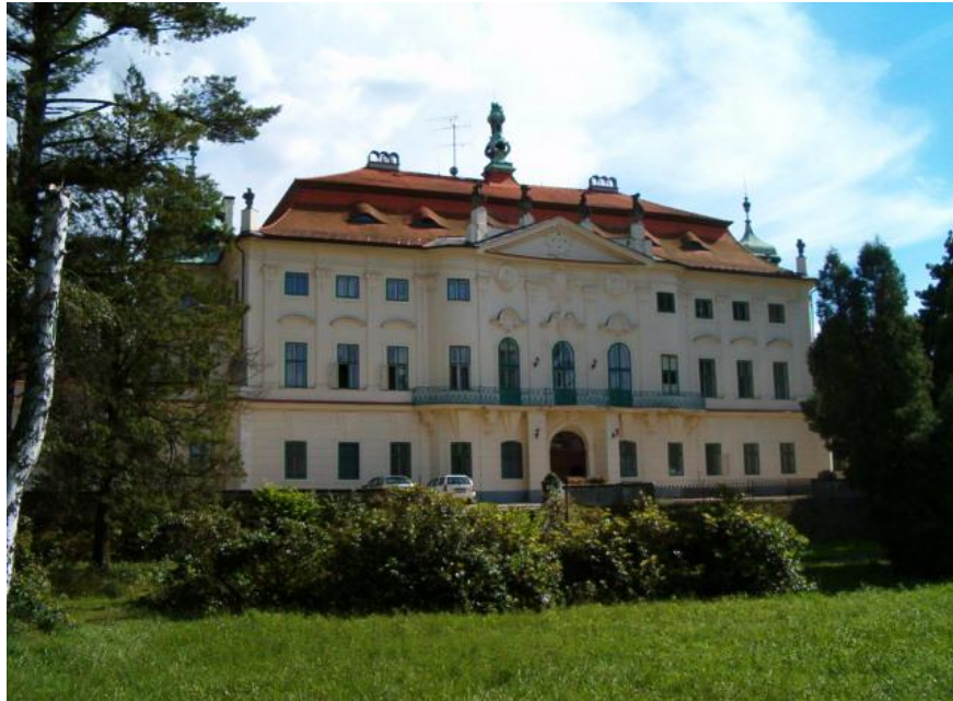
Obrázek 2 Pohled na zadní část budovy