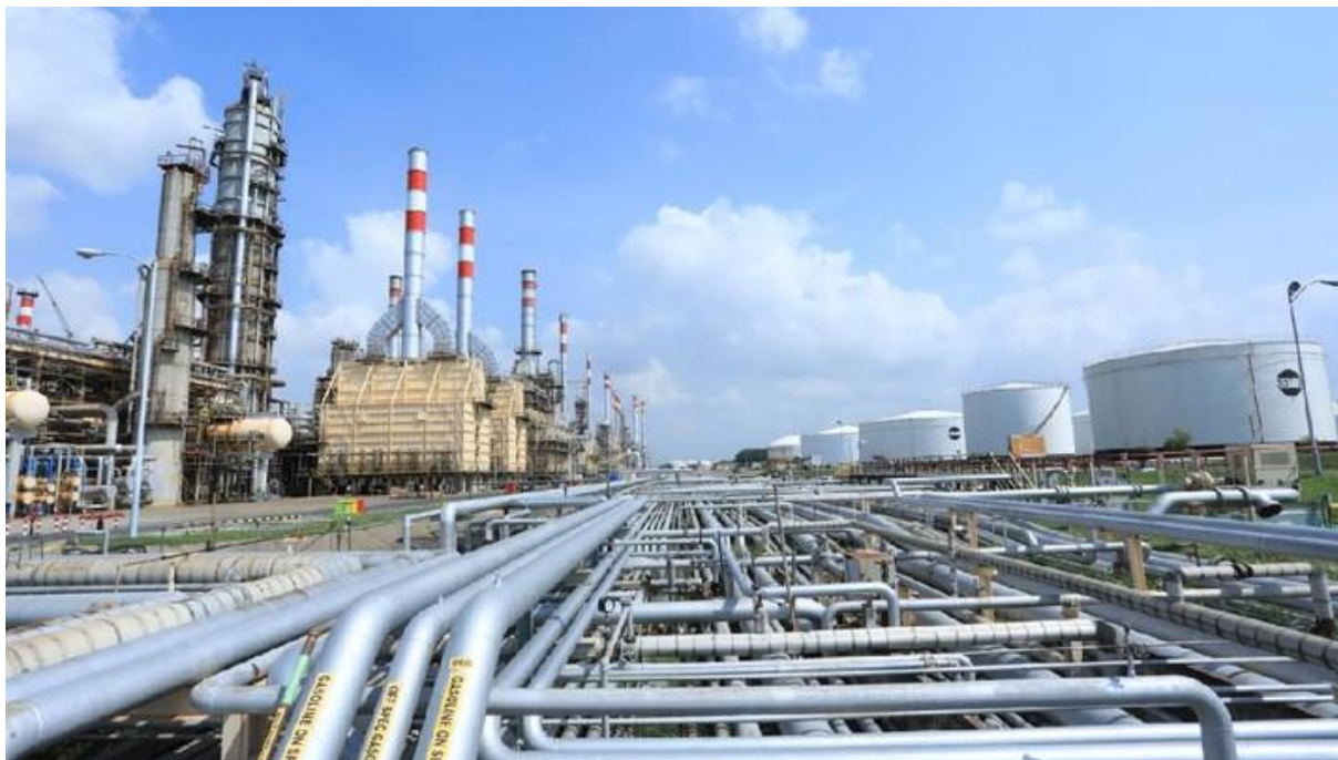
Obr. 5 – Rafinérie Pertamina Uji Coba Green Diesel v Kilang Cilacap

tak klíčových hráčů by mohlo ovlivnit podobu indonéského průmyslu palmového oleje jako celku. 135