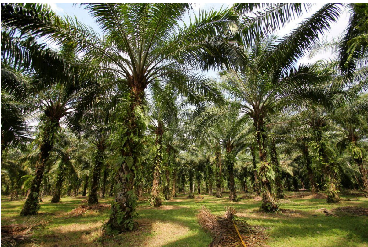
Obr. 2 – Plantáž dospělé palmy olejné.

Semena palmy olejné se obvykle nechávají klíčit metodou suchého tepla, kdy jsou zahřívána na 37–39 °C po dobu 50 dnů a následně je požadovaným způsobem upravena i vlhkost. Po vyklíčení jsou rostliny vysazeny do školek, kde během 10 až 16 měsíců dosahují dostatečné velikosti pro přesun a vysazení na plantáž. Tempo ročního růstu závisí na okolních podmínkách, zpravidla se však pohybuje mezi 25 a 50 cm. První rentabilní sklizeň trsů ovoce bývá dosahováno čtyři až pět let po výsadbě, přičemž rostlina poté plodí 25-30 let a poté přirozeně umírá.