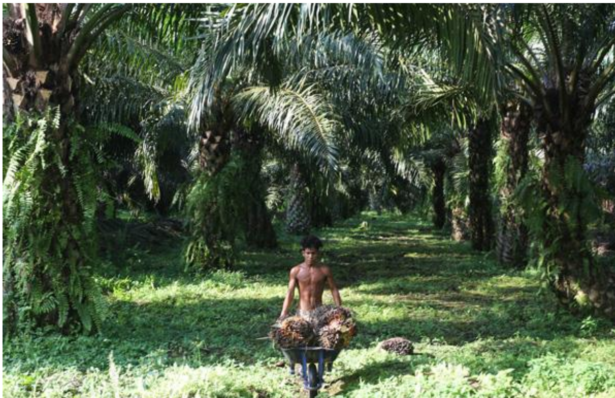
Obr. 3 – Muž sklízající zralé trsy palmy olejně na plantáži v Riau, Sumatra.

se co v největší míře vyvarovat prořezávání jakýchkoli zelených listů, nebyl ještě podstatně mechanizován a zůstává tak náročný na manuální práci. 106