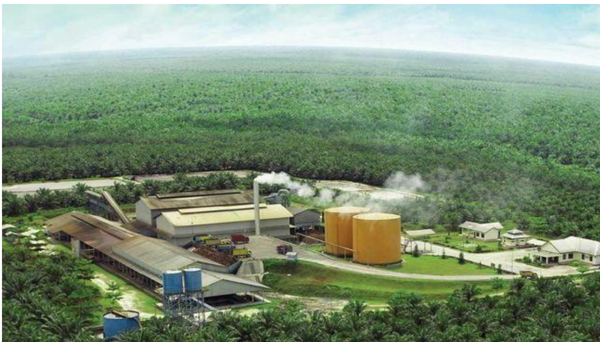
Obr. 4 – Mlýn na zpracování palmového oleje.

Během 24 hodin od sklizně musí být čerstvé trsy palmy olejné transportovány do mlýnů a urychleně zpracovány. Přepravu zajišťují obchodníci, přičemž tuto skupinu prakticky nelze homogenizovat, jelikož zahrnuje širokou škálu aktérů od středně velkých formálních společností až po individuální zprostředkovatele operující v neformální ekonomice. Na rozdíl od předchozího kroku je zpracování trsů vysoce mechanizováno. Celý proces extrakce zahrnuje jejich přijetí, oddělení ovoce od trsů, sterilizaci odděleného ovoce, rozdrčení ovoce při vysokých teplotách, extrakci palmového oleje, čiření a sušení oleje a skladování surového palmového oleje (CPO). Dalším krokem pak je opětovné lisování zbylé směsi vlákniny a palmových ořechů za účelem získání palmojádrového oleje (PKO). Velké závody, které zahrnují všechny tyto vyjmenované kroky nutné k výrobě palmového oleje, obvykle zpracovávají tři až 60 tun čerstvých trsů palmy olejné za hodinu. 124