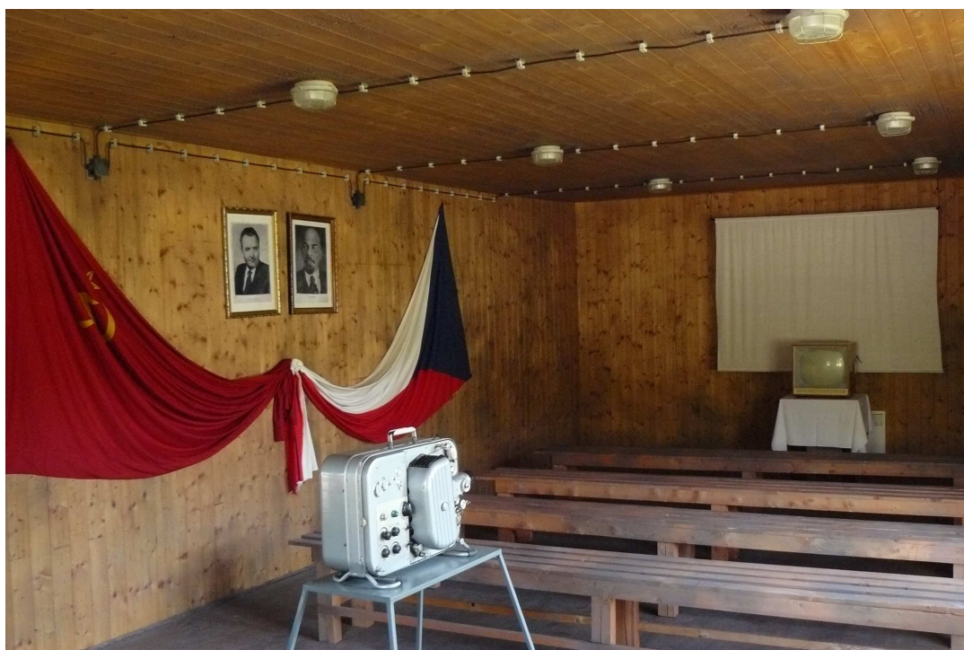
4. Jedna z místností kulturního domu v Památníku Vojna.