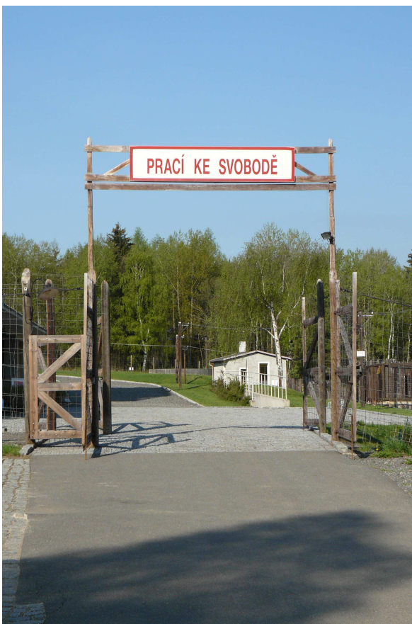
6. Nápis nad vstupní branou do tábora Vojna. Nápadně podobný nápisu „Arbeit macht frei“ z nacistických koncentračních táborů.