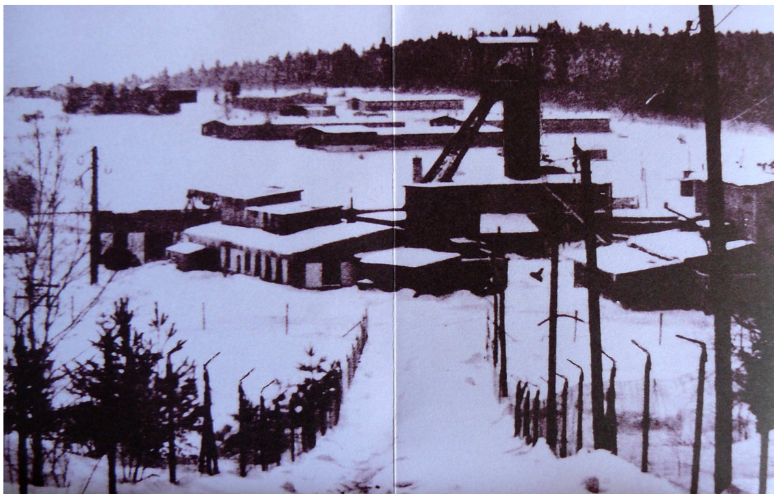
9. Jedna z několika fotografií tábora Vojna z padesátých let.