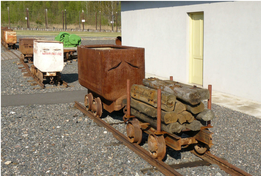
5. Fotografie huntíku. V takovém se vězni pokoušeli o útěk.