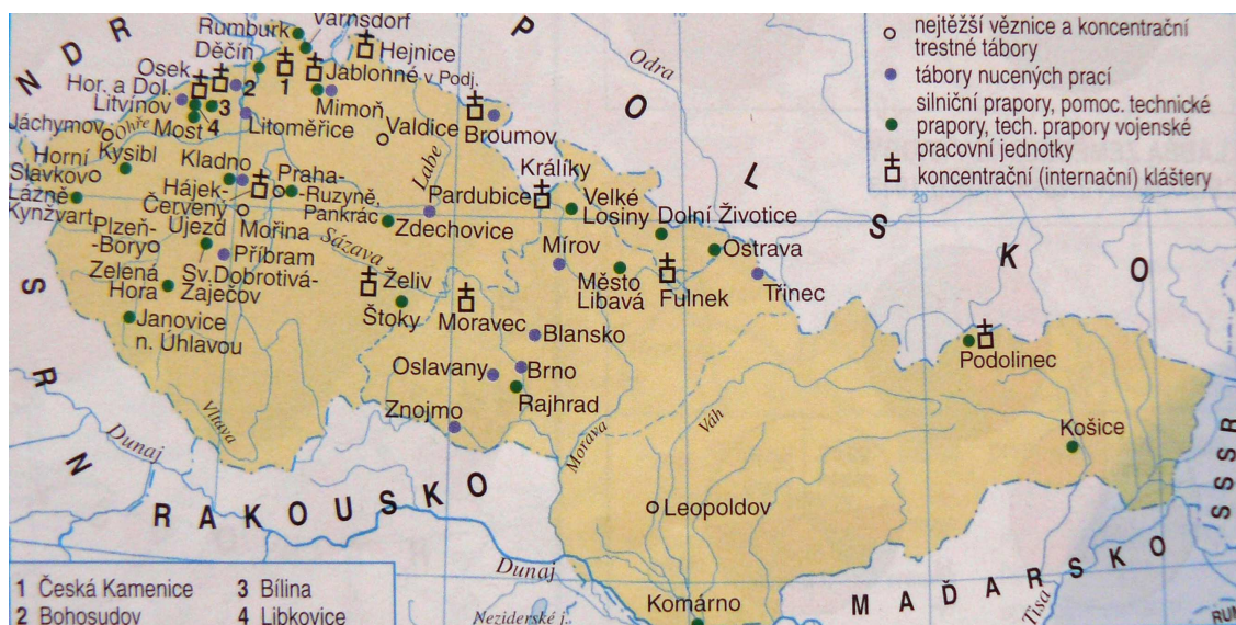
1. Místa izolace a likvidace odpůrců totalitního systému v Československu po roce 1948.