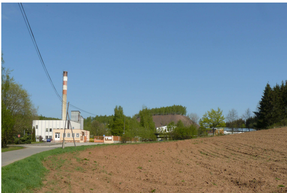
8. Současná podoba dolu Kamenná.