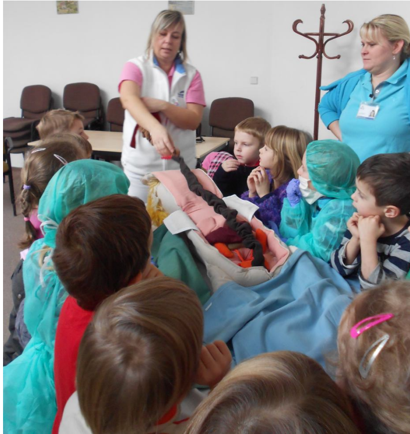
herní terapie – operace slepého střeva