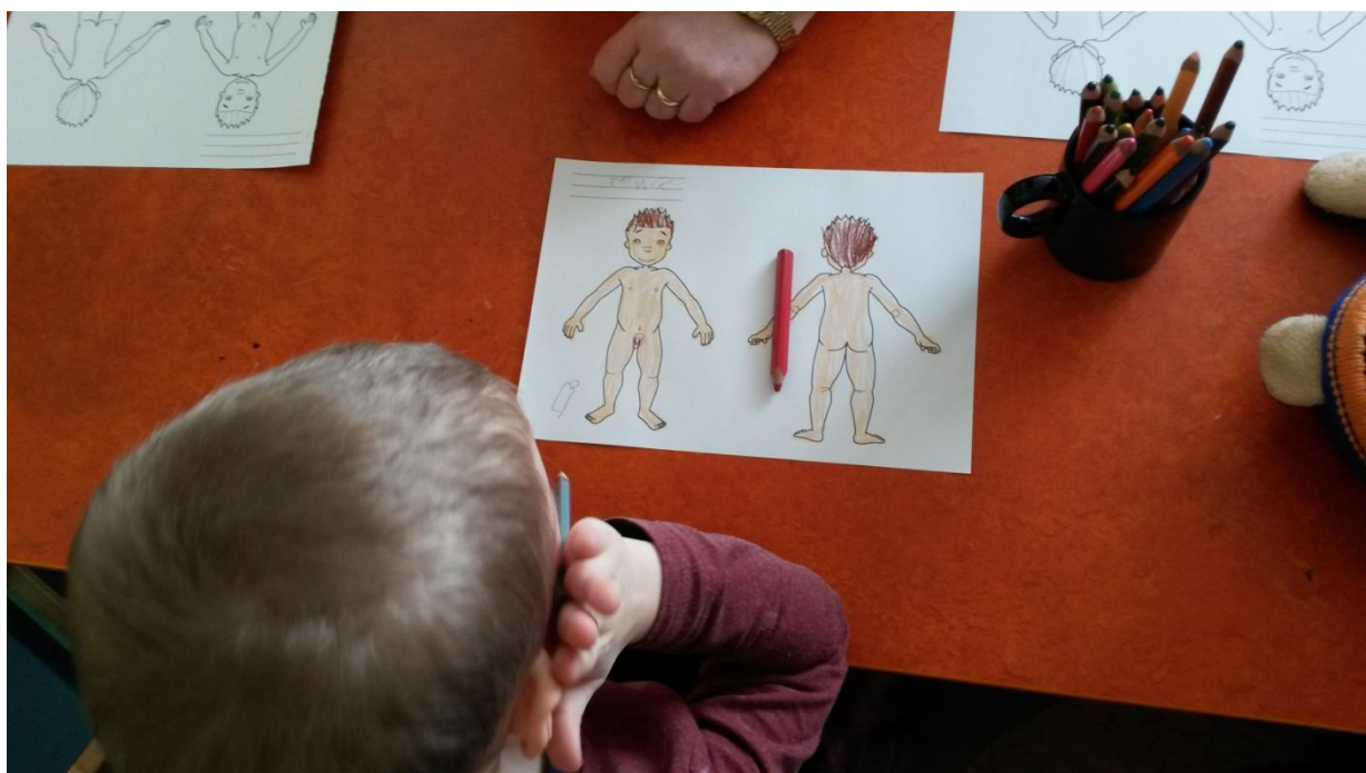
herní terapie – zakreslení potíží dítěte do obrázku