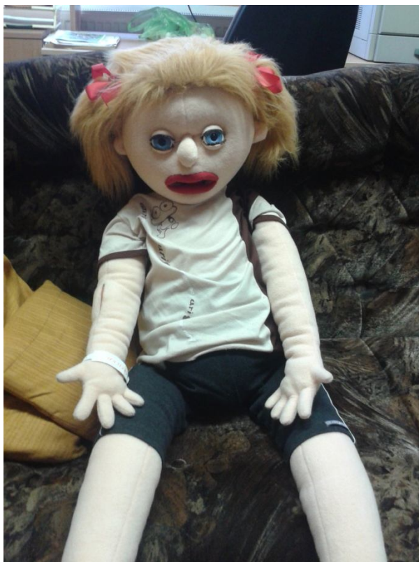
herní panenka „Lucinka“