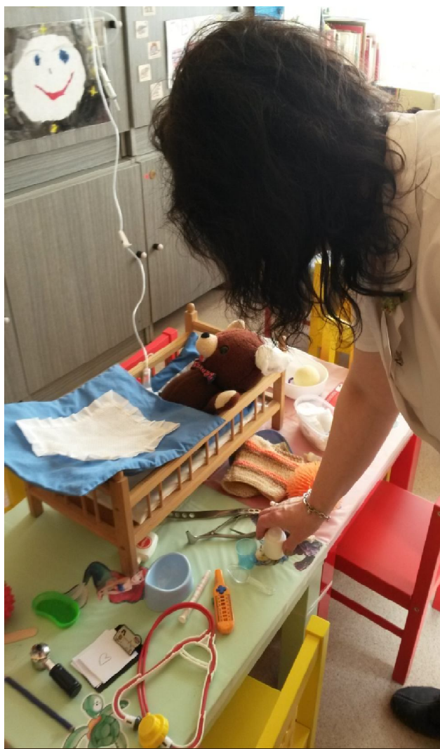
herní terapie – učitelka MŠ – uložení medvídky ke spánku