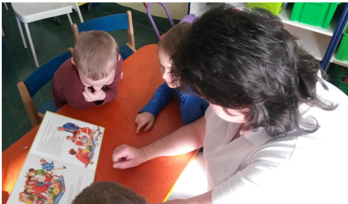
herní terapie – učitelka MŠ – příběh o nemocném chlapci