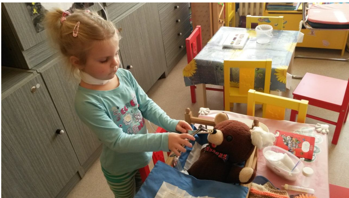
herní terapie – učitelka MŠ - vyšetření medvídky (odd. dětská ORL)