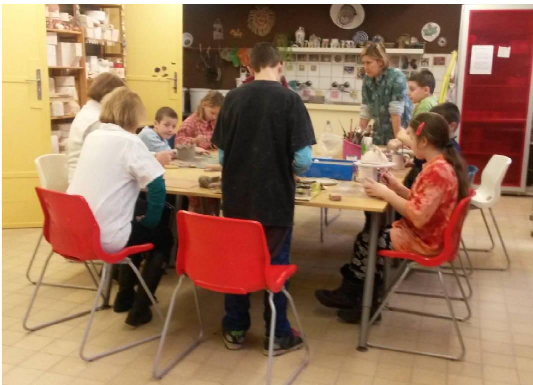
herní terapie – herní specialista – keramická dílna