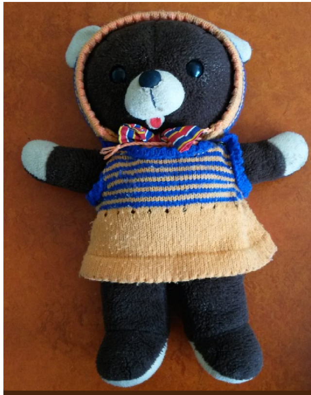
herní loutka – medvídek (dětské interní odd.)