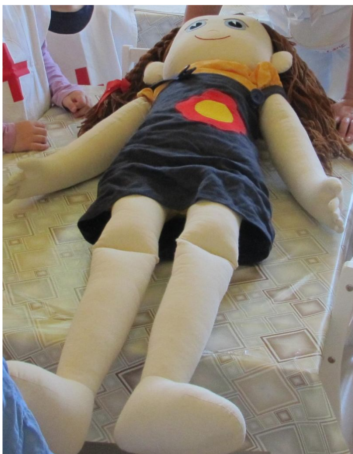
herní loutka „Kačenka“ (nemá vnitřní orgány)