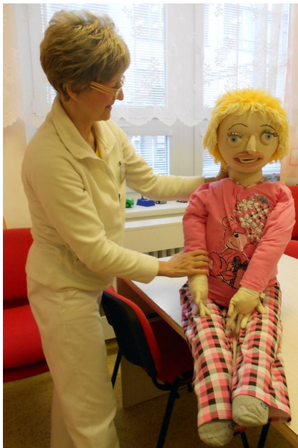
herní panenka „Cecilka“