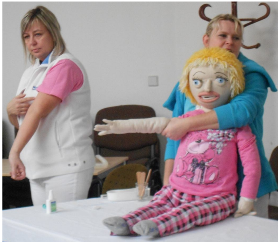
herní terapie – sestry z děts. odd. – odběr krve