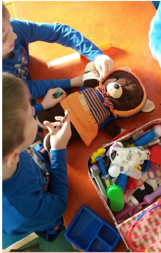
herní terapie – učitelka MŠ - léčení medvídka