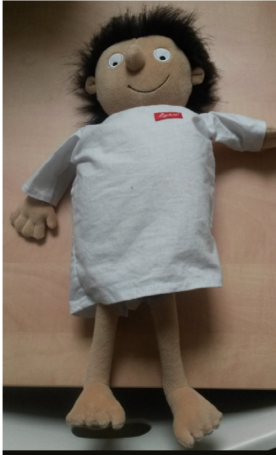
herní loutka (malá) – chlapeček