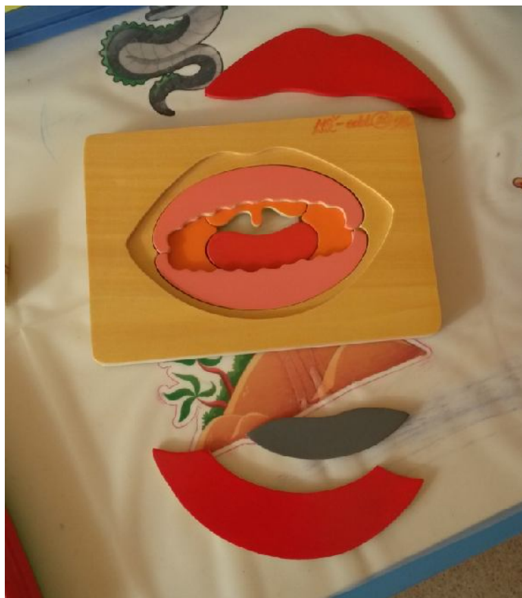
skládačka dutina ústní – herní terapie – dětská ORL