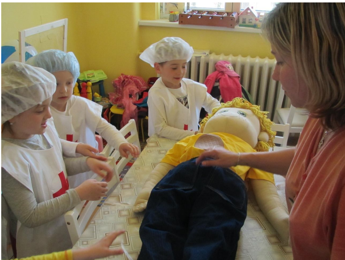
herní terapie – učitelka MŠ – malí lékaři léčí „Kubu“