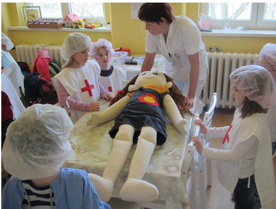
herní terapie – učitelka MŠ – malí lékaři léčí „Kačenu“