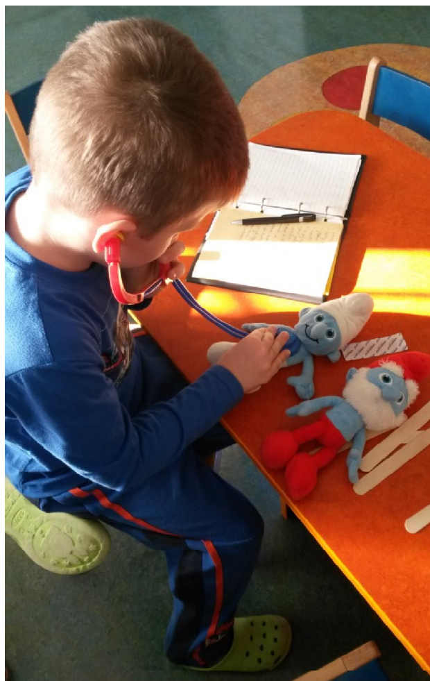
herní terapie – léčení vlastních plyšových hraček