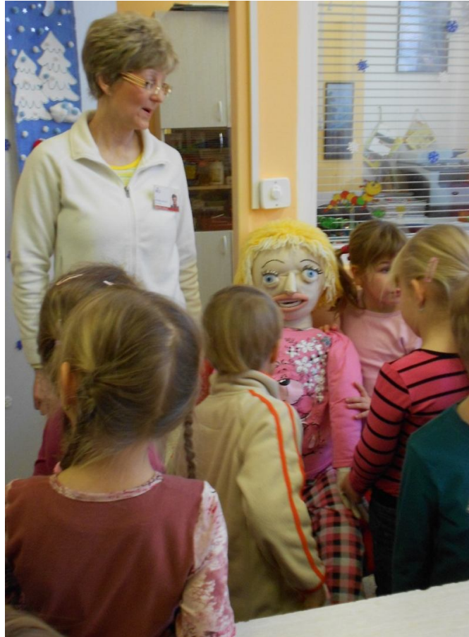
herní terapie – speciální pedagog