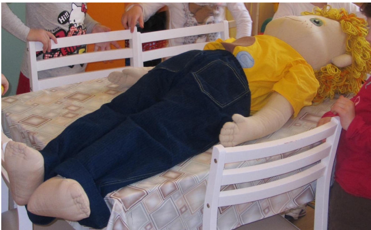
herní loutka „Kuba“ (nemá vnitřní orgány)