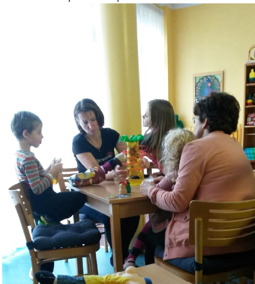
herní terapie – herní specialista – oddělení dětské neurologie