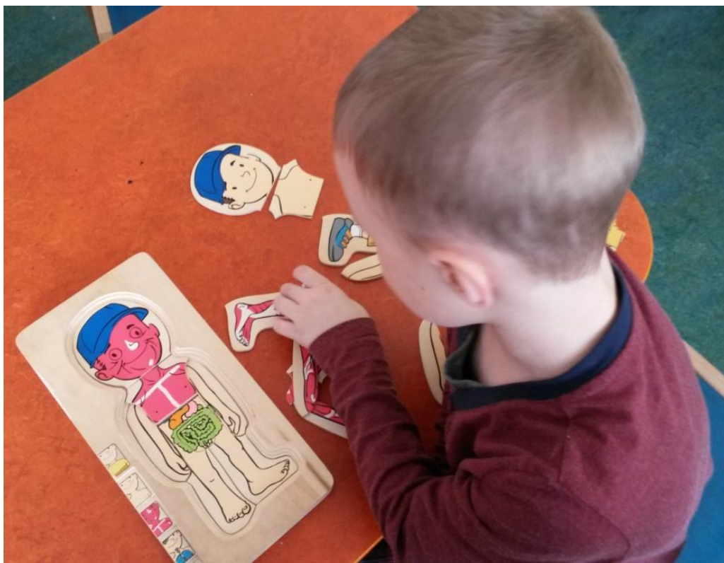
herní terapie – skládání puzzle – jednotlivé vrstvy těla