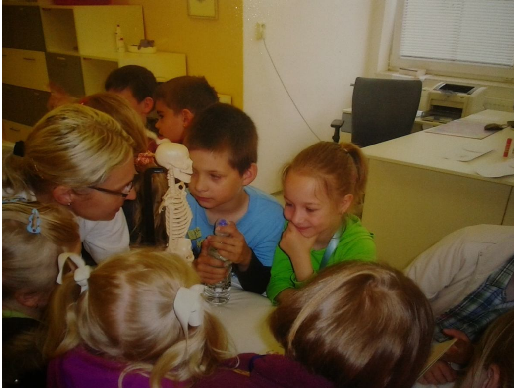
herní terapie – dětská lékařka – seznámení s kostrou