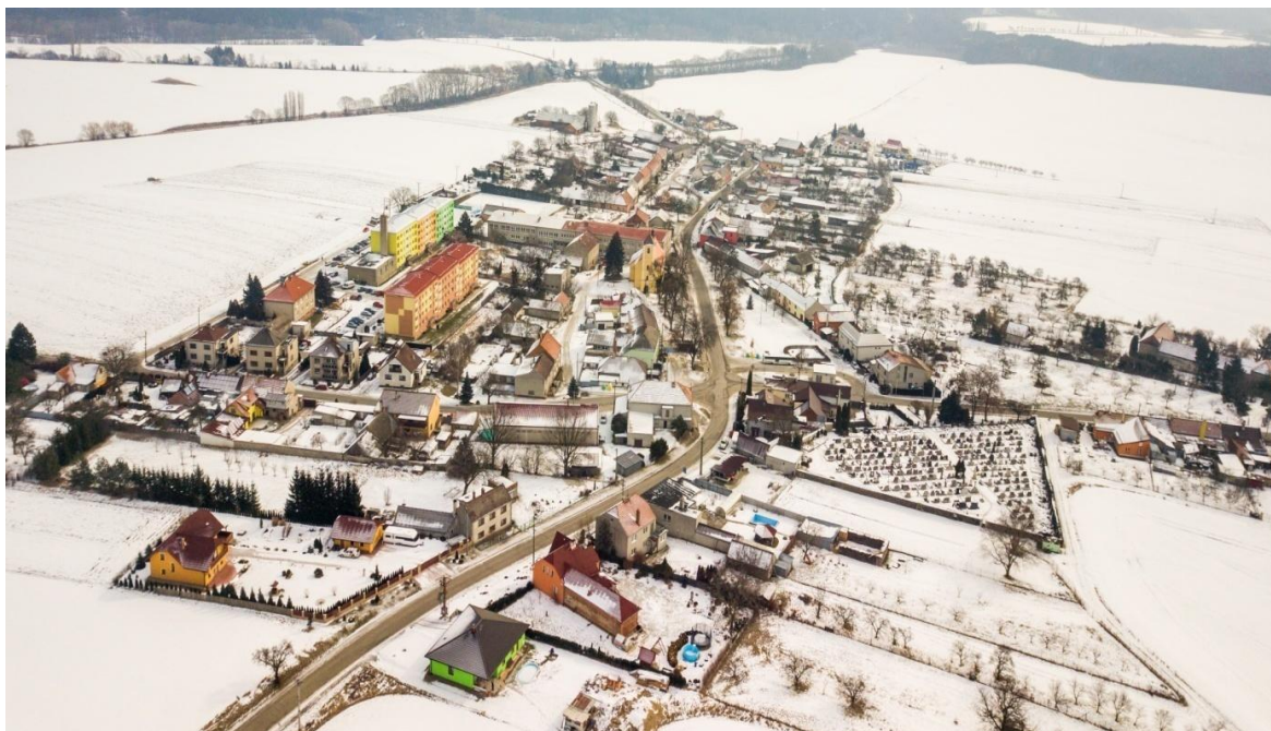
Obrázková příloha č. 3: Obec Bohuslavice