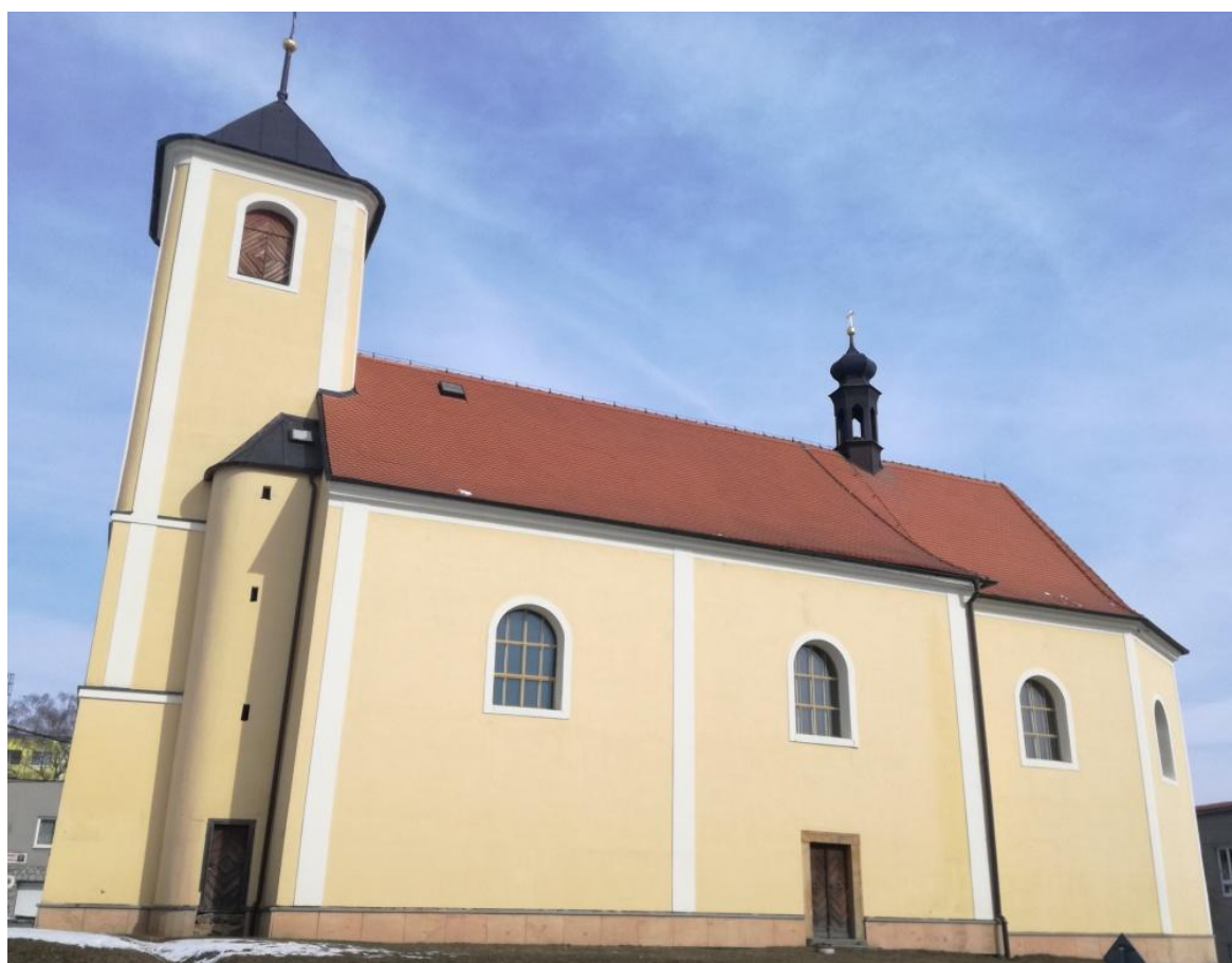
Obrázková příloha č. 4: Kostel sv. Bartoloměje v Bohuslavicích