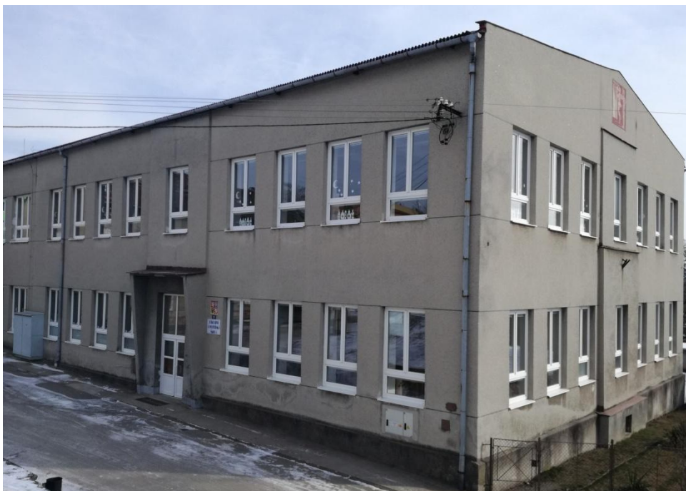
Obrázková příloha č. 7: Nová školní budova v Bohuslavicech