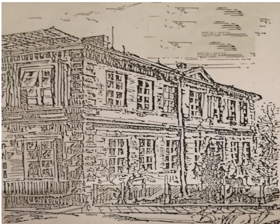
Obrázková příloha č. 5: Stará školní budova postavena roku 1894