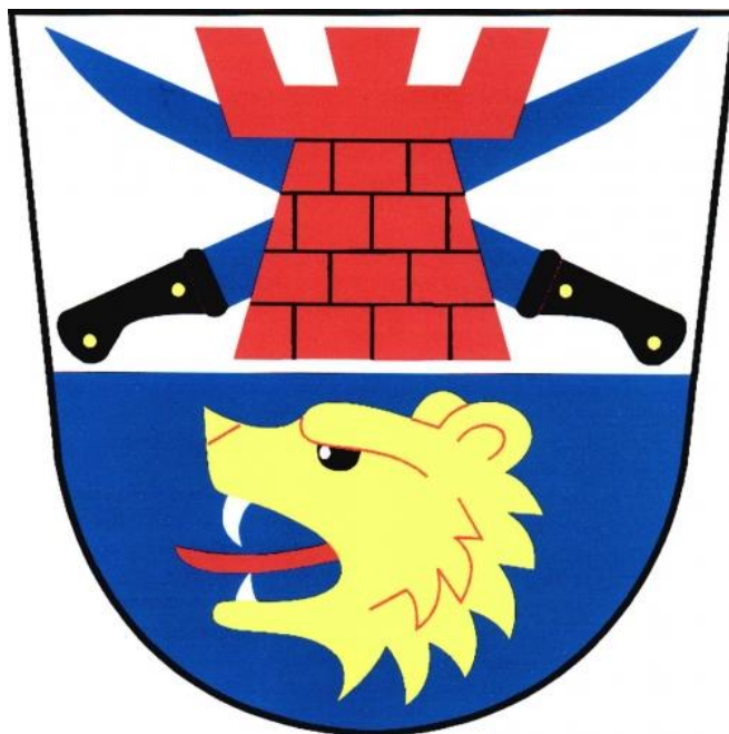
Obrázková příloha č. 1: Znak obce Bohuslavice

Zdroj: ŠMERAL, Ladislav. Bohuslavice: setkání rodáků a 120 let od založení SDH Bohuslavice . Bohuslavice: Obecní úřad, 2005.