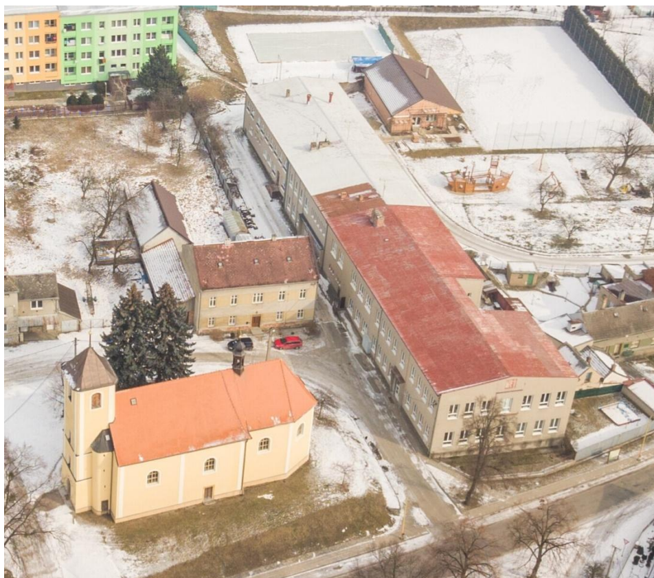
Obrázková příloha č. 8: Školní areál, kostel sv. Bartoloměje, fara