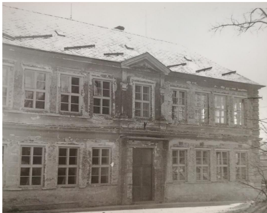
Obrázková příloha č. 6: Stará školní budova před přestavbou