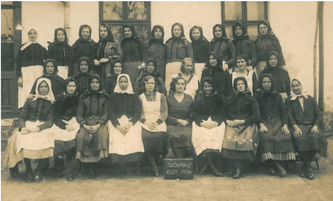
Kurz vaření v roce 1934.