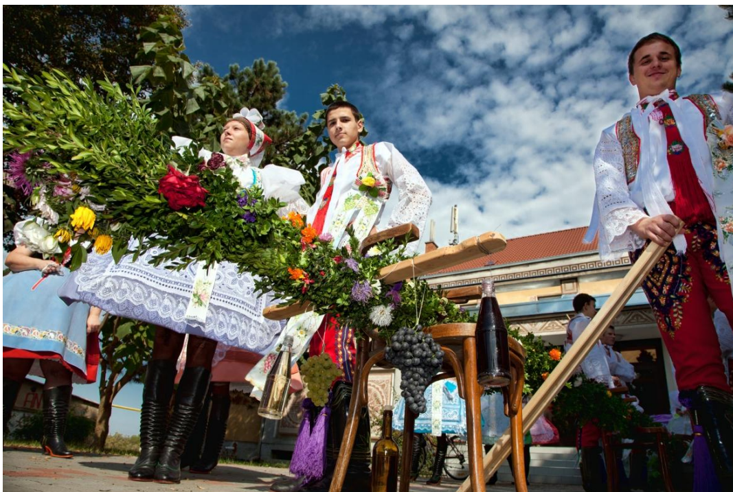
Vinobraní – příprava na průvod.