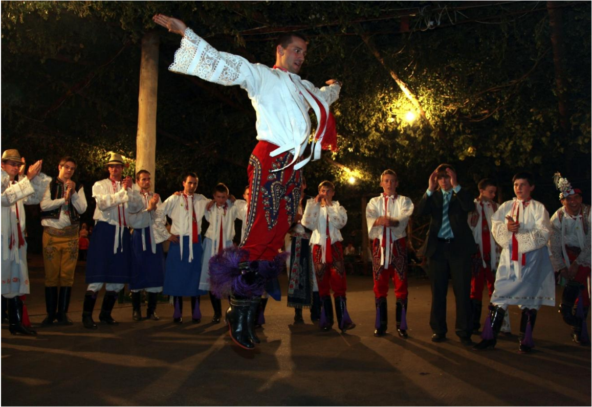
Hody neděle – „hošije“.