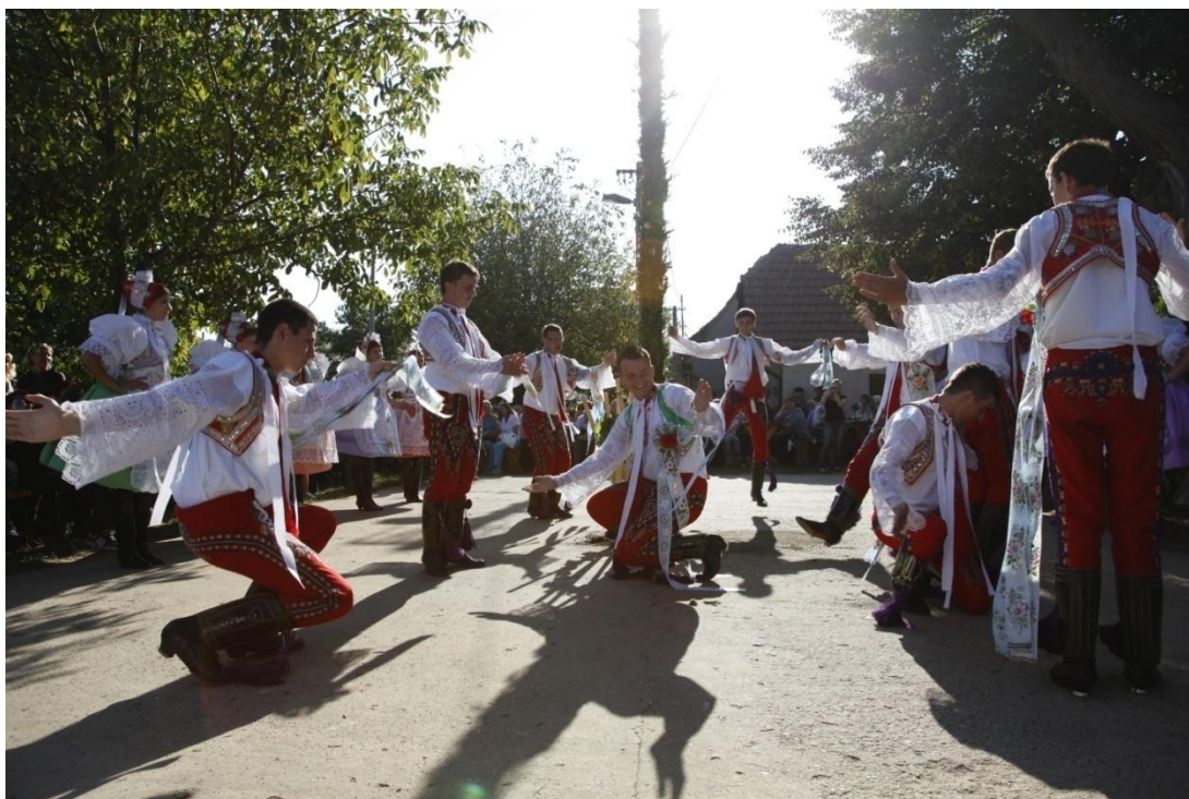
Vinobraní – „verbuňk“. Autor: Petr Omelka.