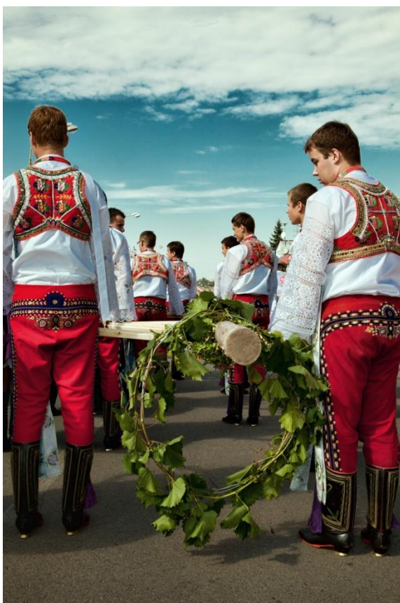
Vinobraní – „šohaj“ nesoucí horu s révovým věncem v průvodu. Autor: Petr Omelka.