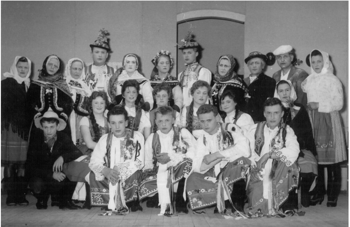
Ochotníci v šedesátých letech.