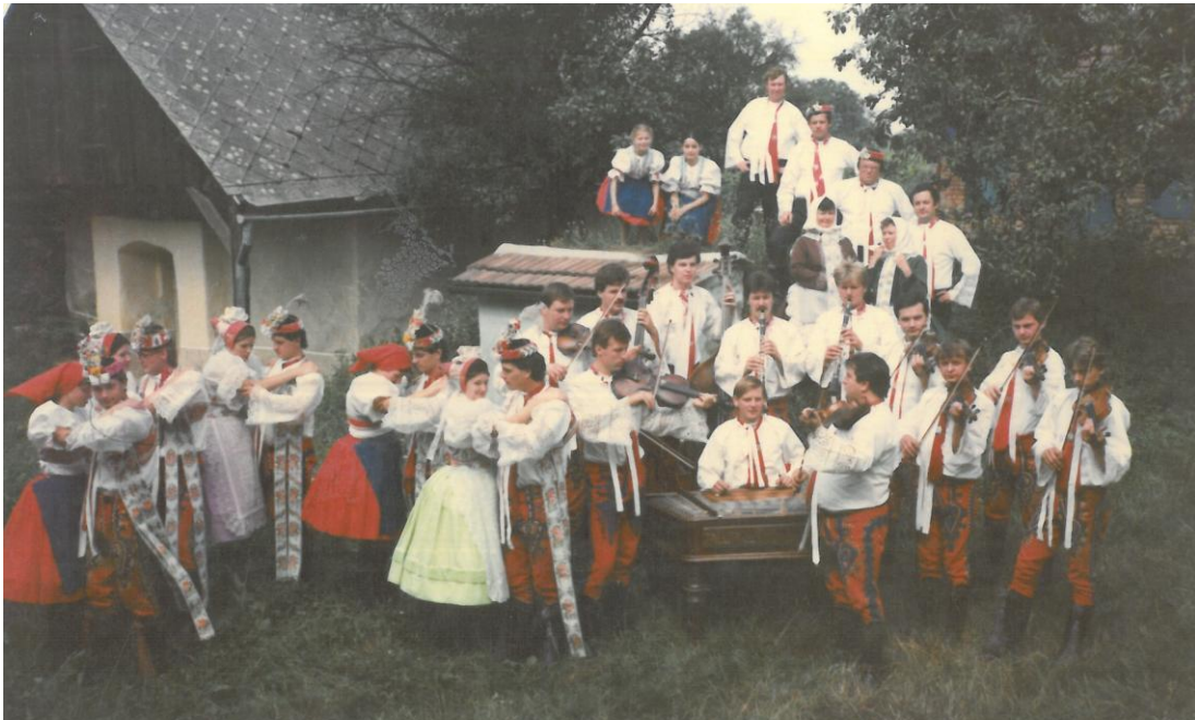
Soubor Šohaj.