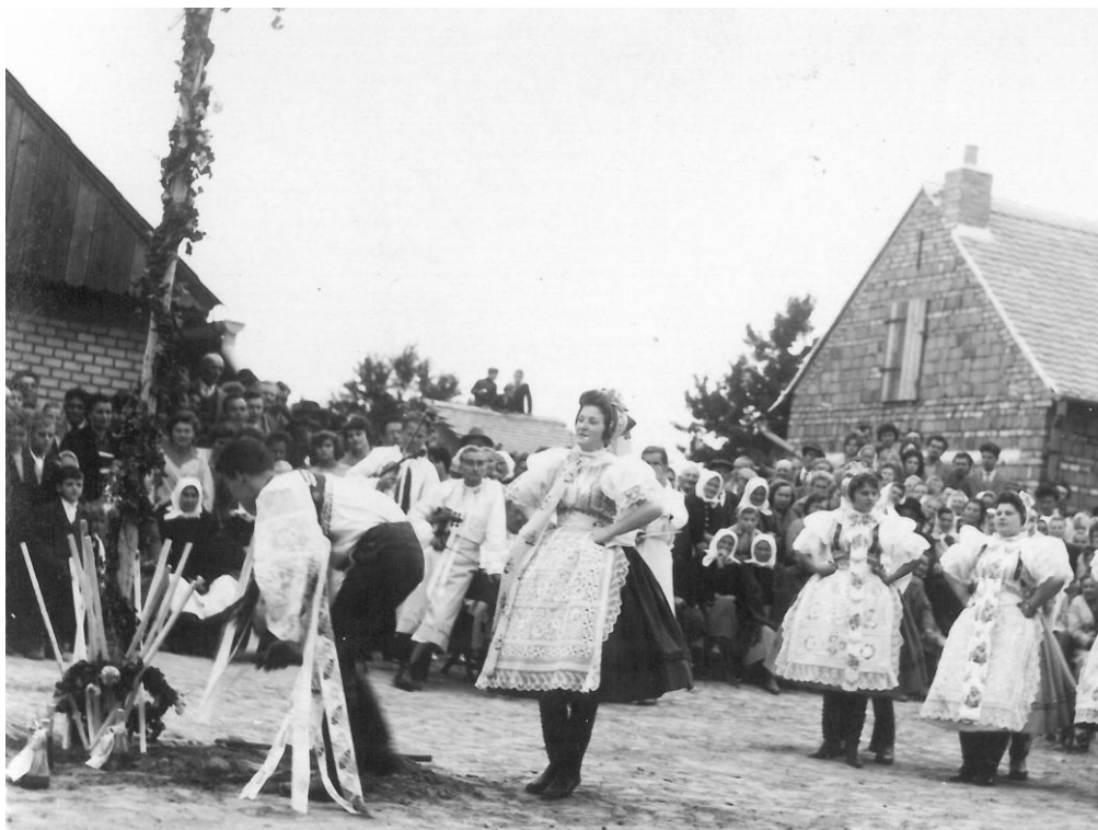
Vinobraní v šedesátých letech.