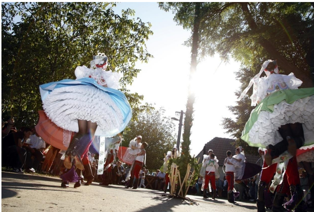
Vinobraní – taneční pásmo, vyhazovaný valčík.