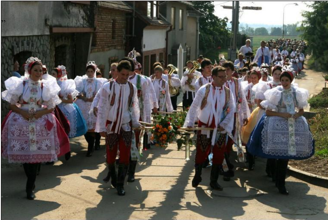
„Zarážání hory“ – průvod. Autor: Lukáš Vaculík.