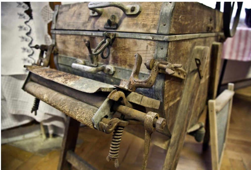
Výstava „ Tradice a historie Prušánek “. Autor: Petr Omelka