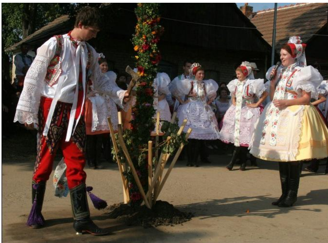
Vinobraní – oklepávání dvanácti kolků a přednášení básničky. Autor: Lukáš Vaculík.