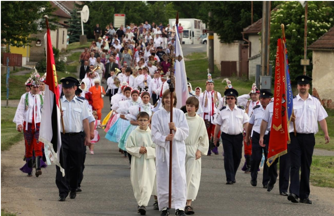
Svěcení kříže – slavnostní průvod.