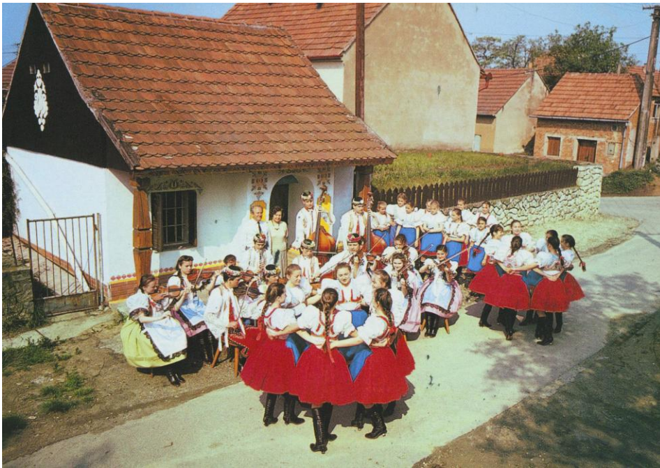
Soubor Podlužánek.