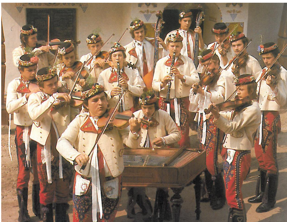
Cimbálová muzika Podlužánek