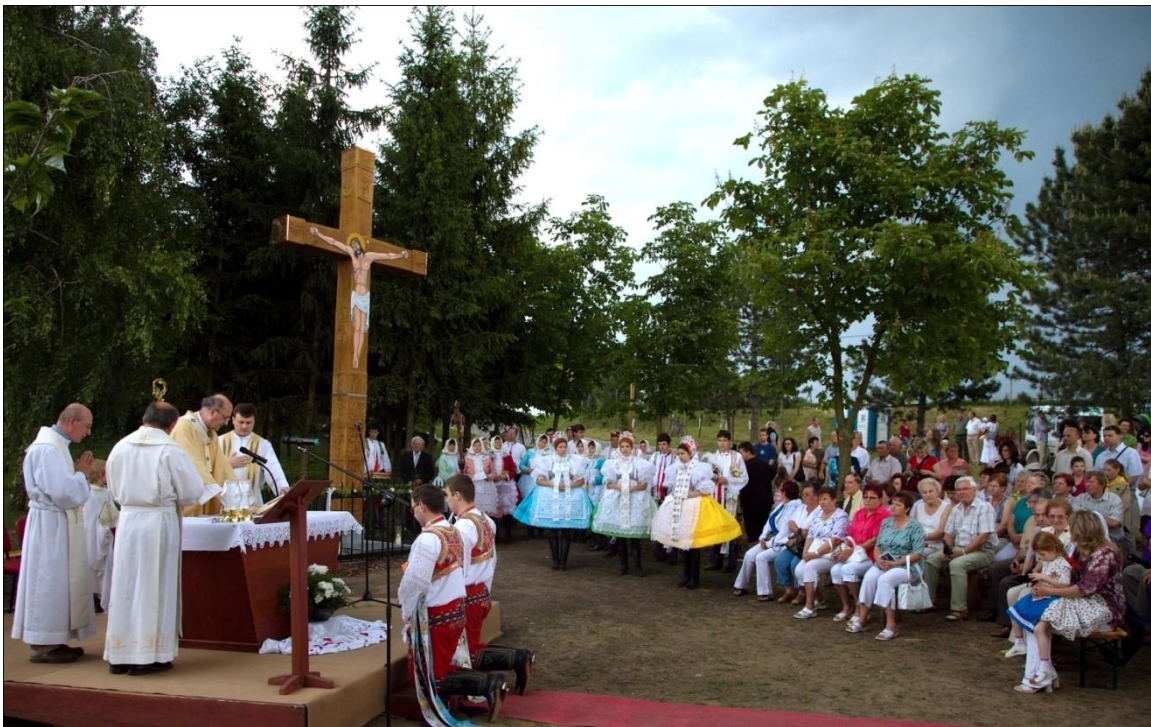
Svěcení kříže. Autor: Petr Omelka.