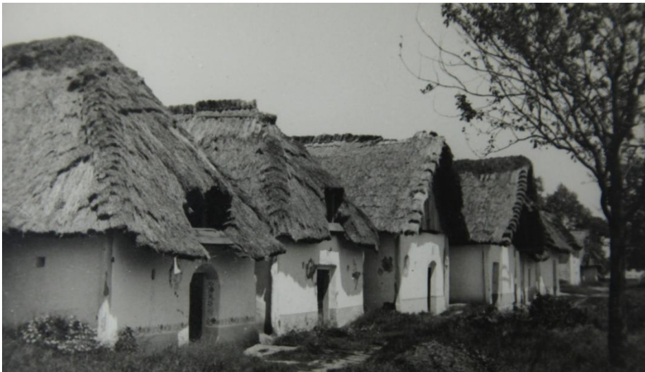
Nechory - doškové střechy.