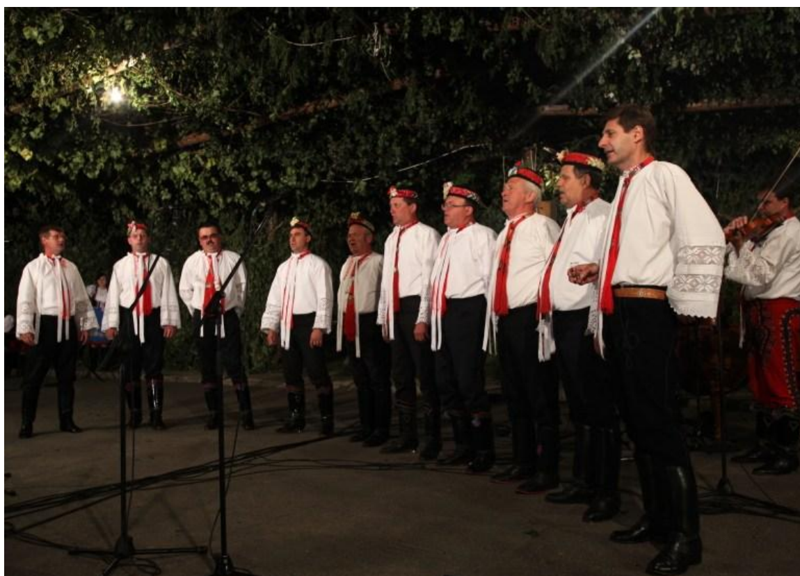
Beseda u cimbálu – „mužácký sbor“. Autor: Petr Omelka.