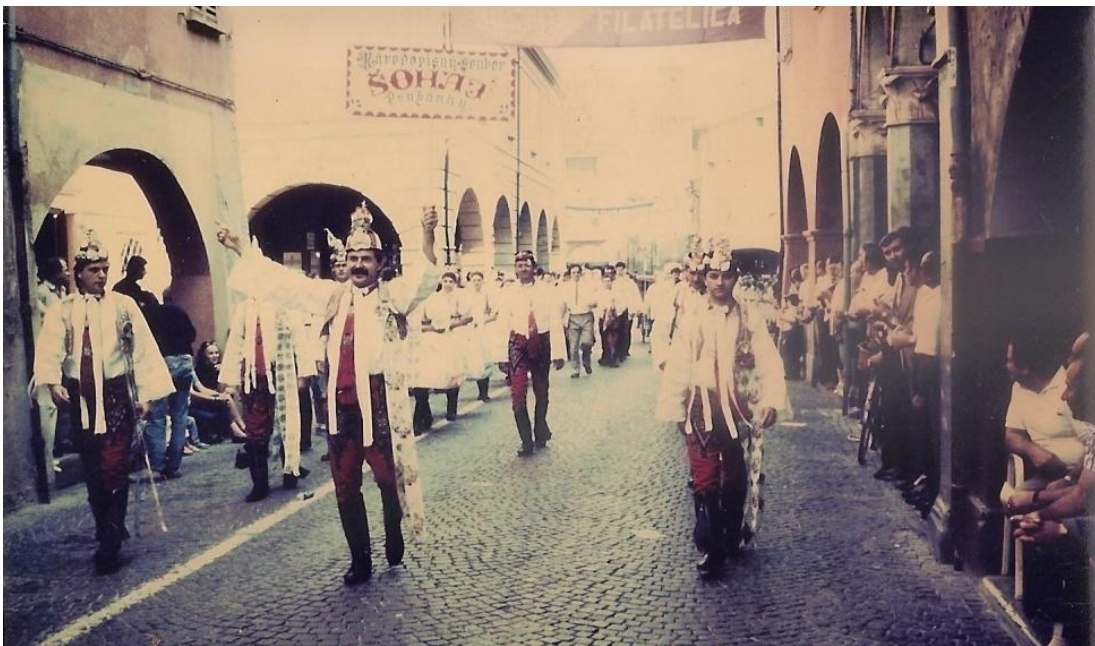
Soubor Šohaj na festivalu v Itálii v roce 1988.