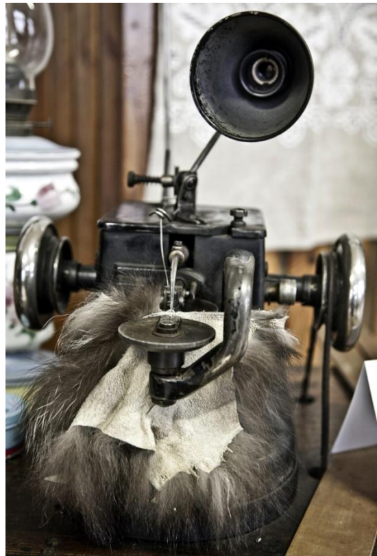
Výstava „ Tradice a historie Prušánek “. Autor: Petr Omelka