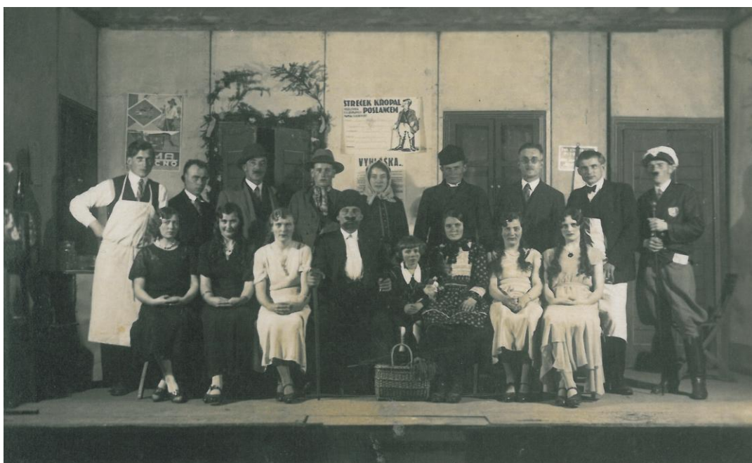
Ochotníci v roce 1932.