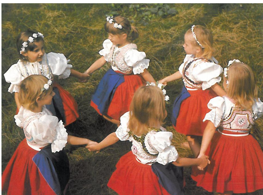
Děti ze souboru Podlužánek - tradiční dětské hry a tance.