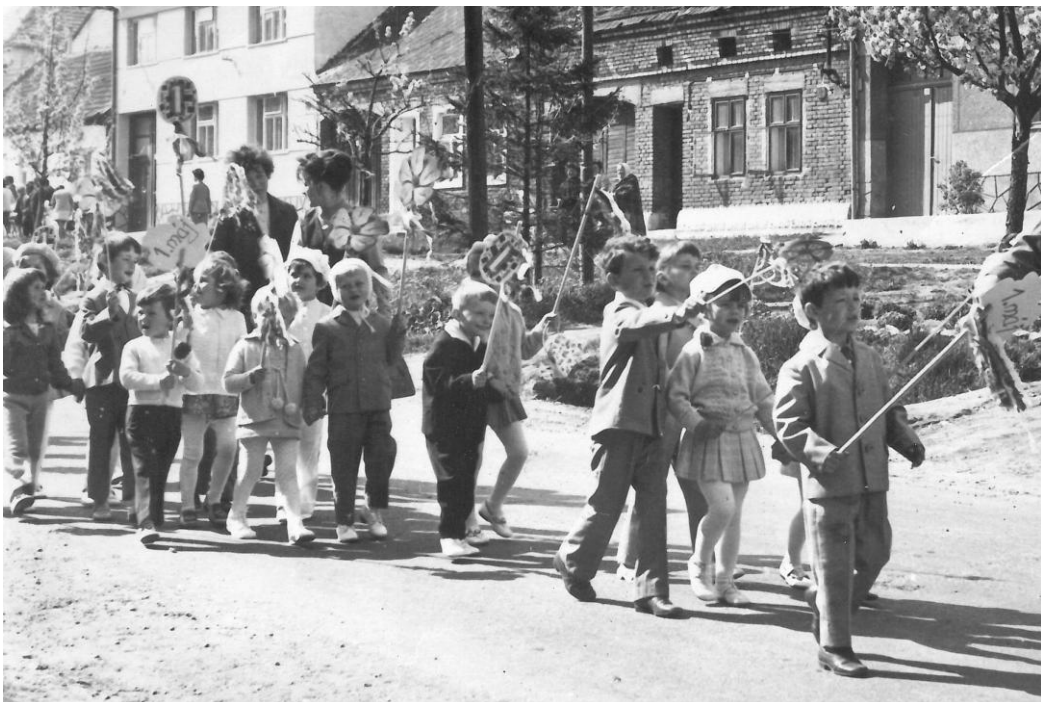
1. máj - svátek práce.