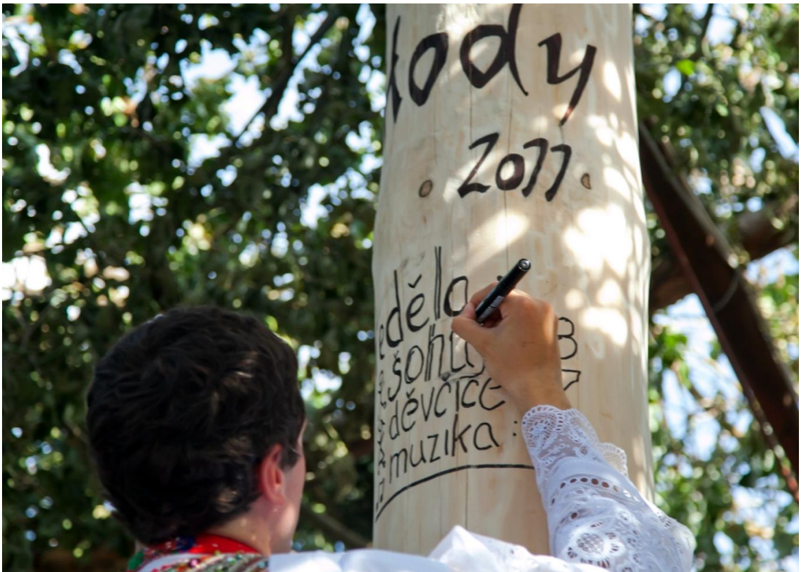
Hody – „mája“. Autor: Petr Omelka.