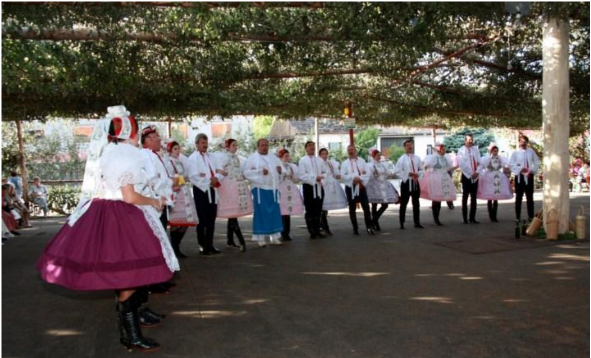
Hody pondělí – „mužácké“ sólo. Autor: Lukáš Vaculík.