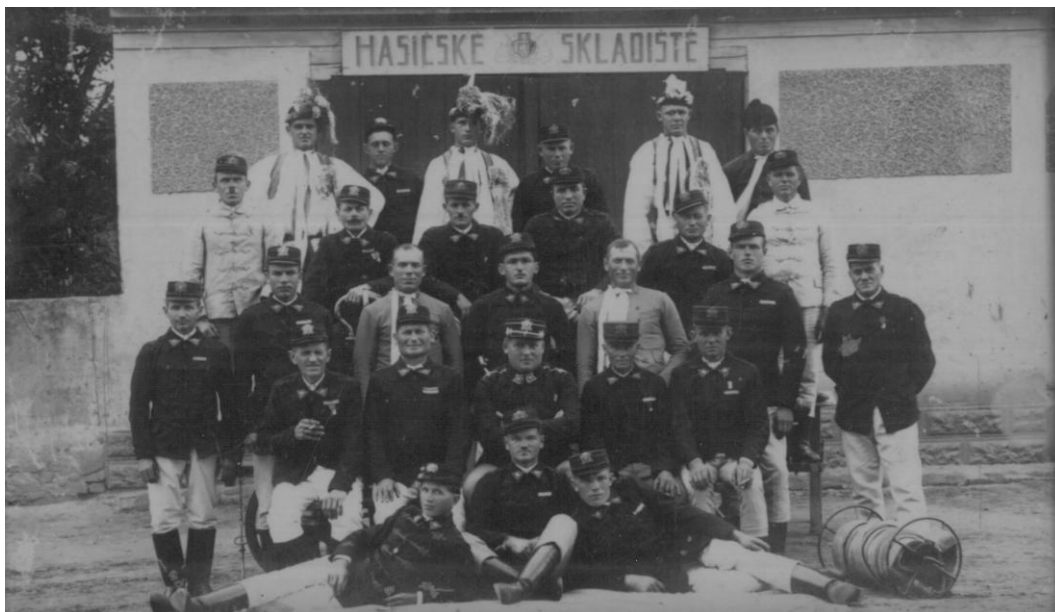
Sbor dobrovolných hasičů ve dvacátých letech.