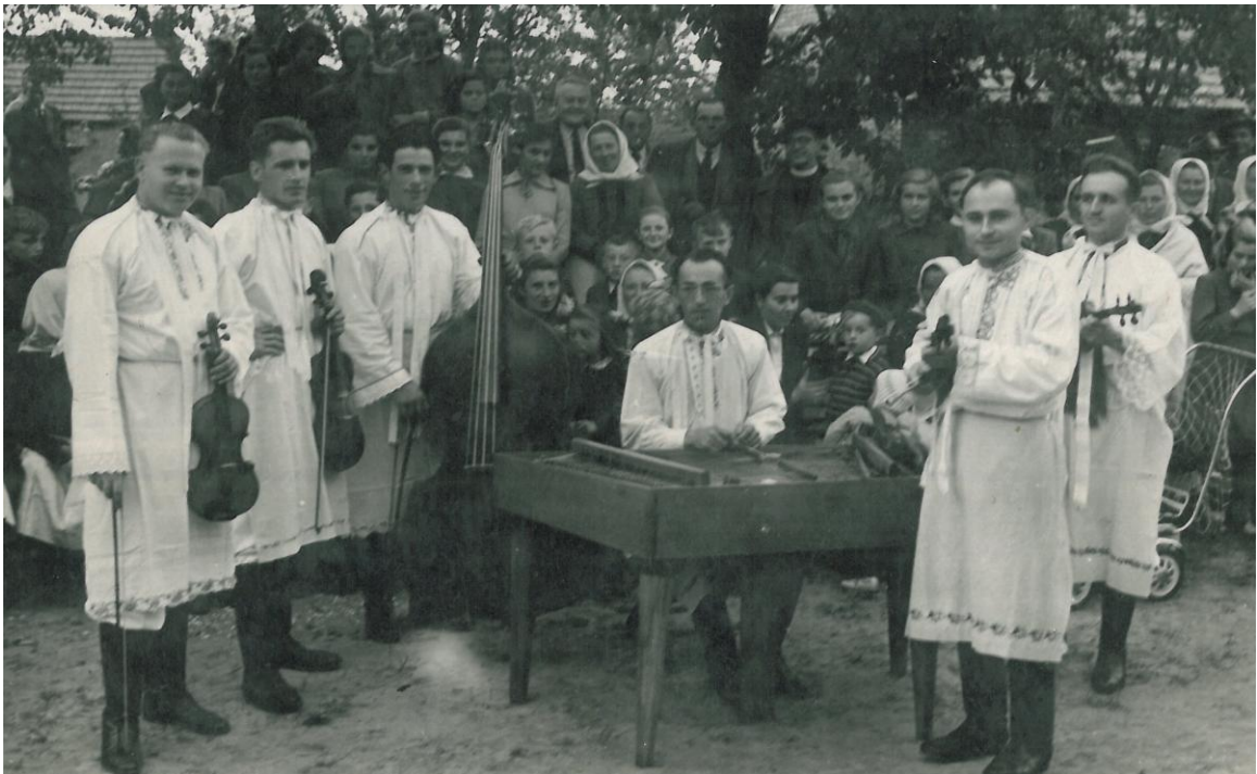
Cimbálová muzika Slovácký krúžek v polovině padesátých let.