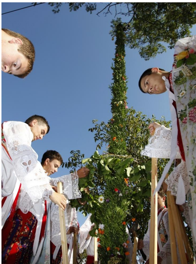
„Zarážání hory“. Autor: Petr Omelka.