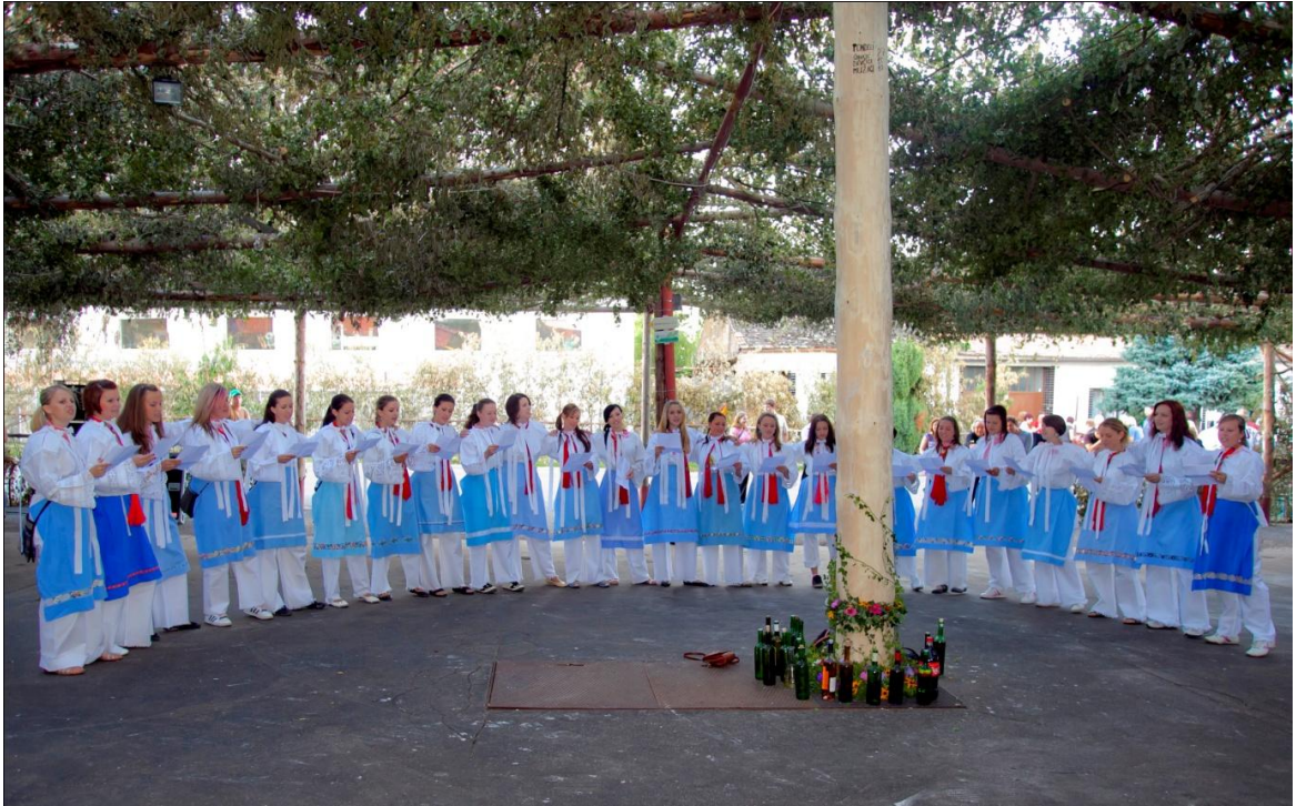
Hody úterý – děvčata za „šohaje“. Autor: Petr Omelka.