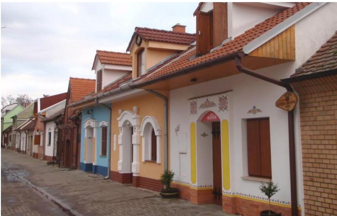
Nechory v současné době.