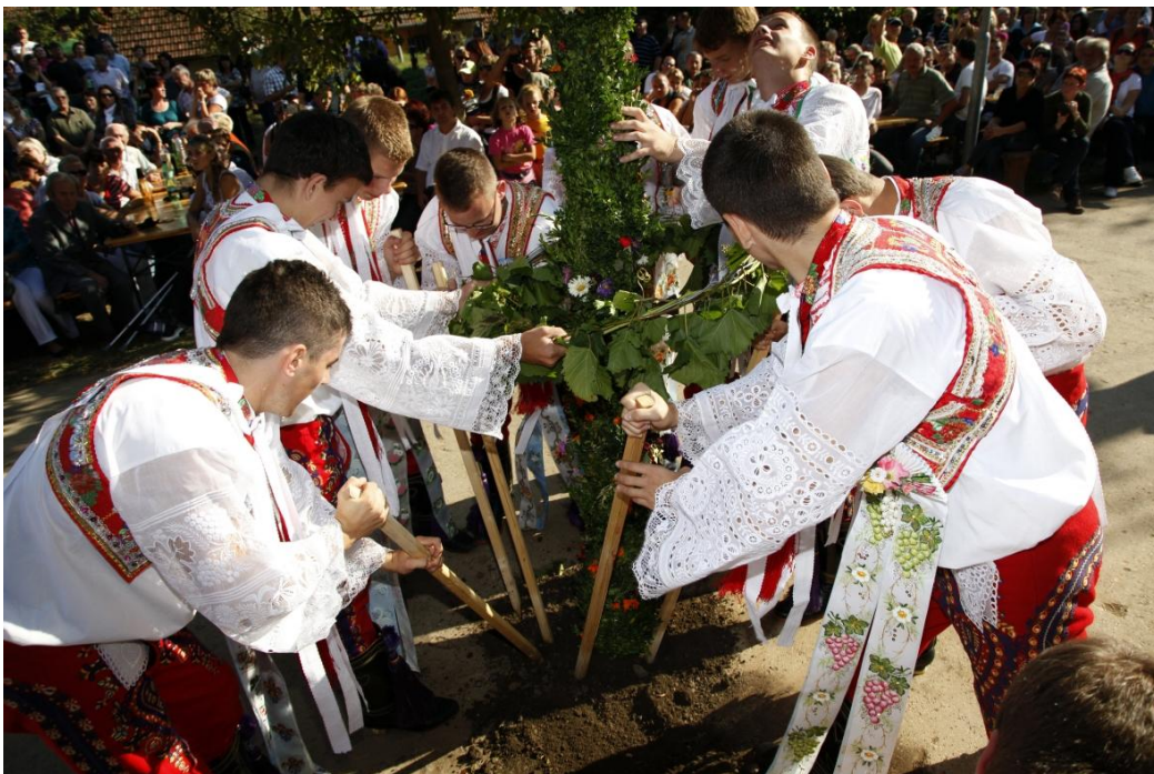
„Zarážání hory“. Autor: Petr Omelka.