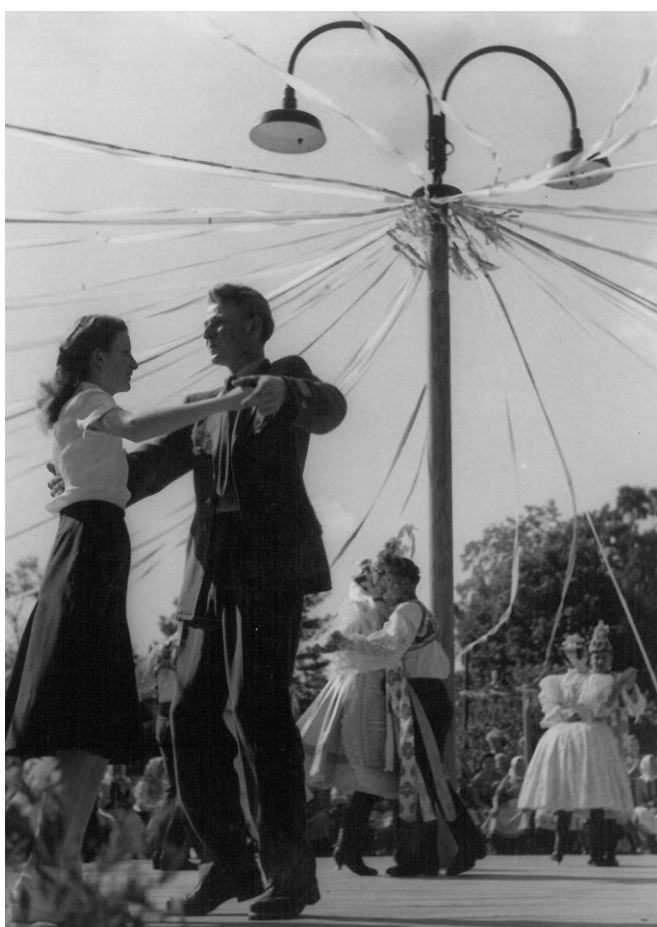
Dožínky v roce 1958.