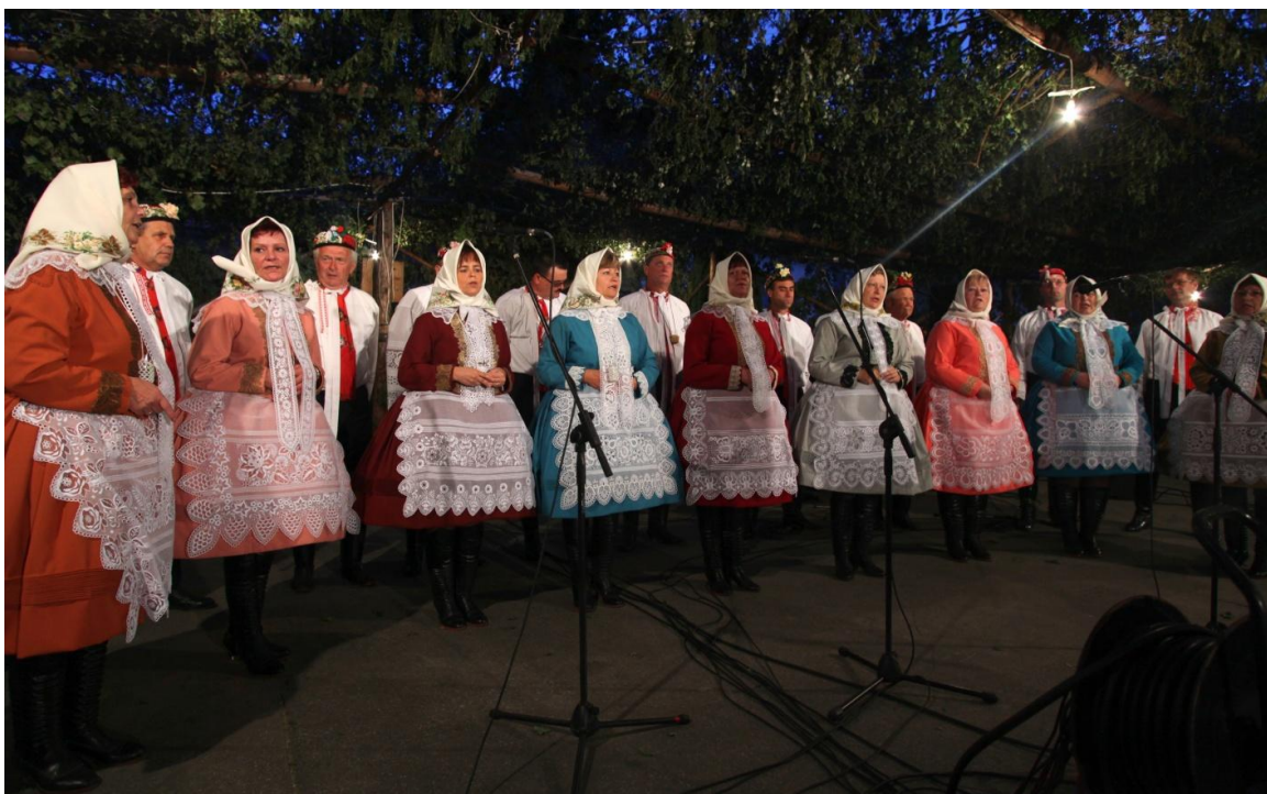
Beseda u cimbálu – ženský sbor. Autor: Petr Omelka.