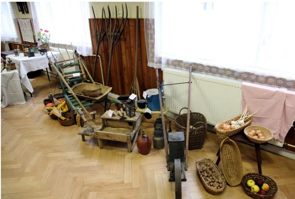
Výstava „ Tradice a historie Prušánek “. Autor: Petr Omelka