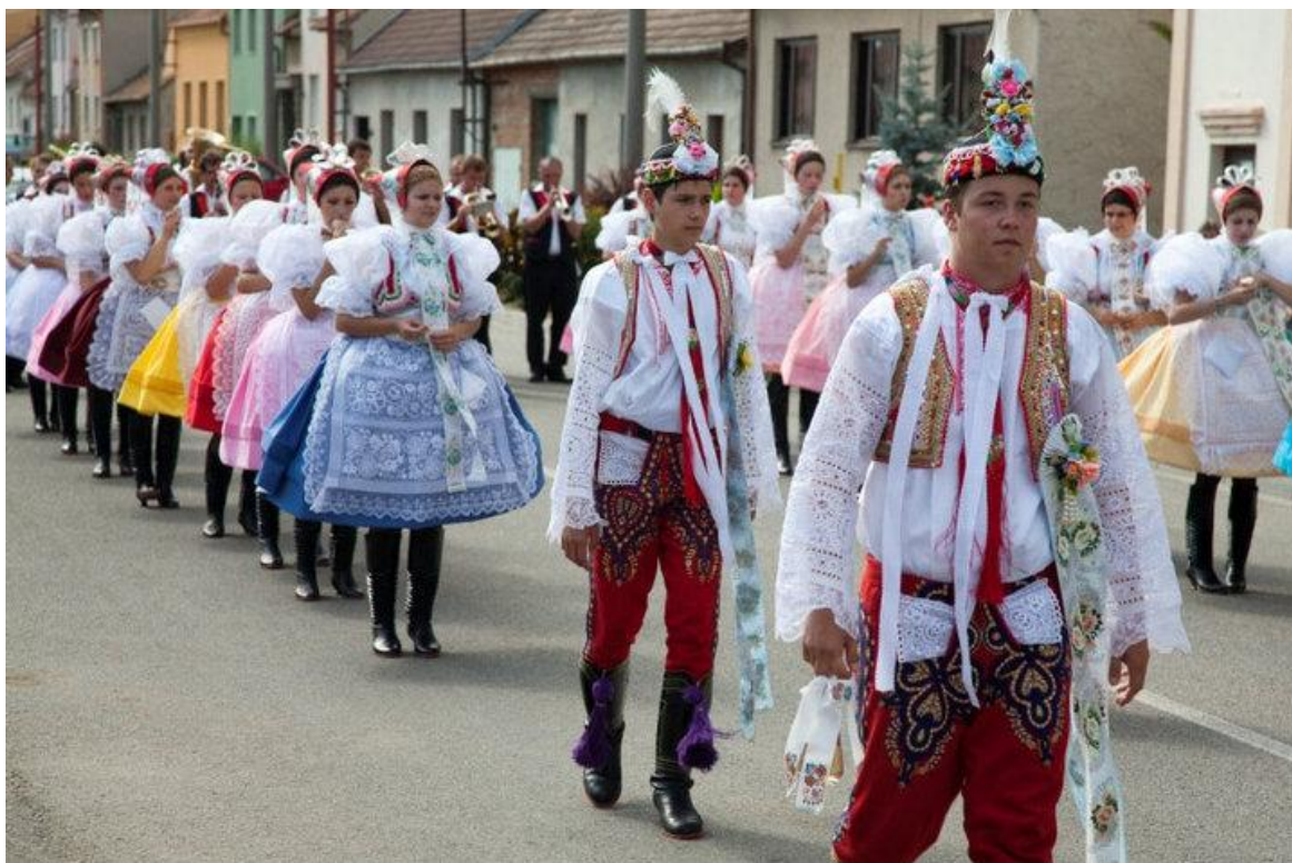
Hody, krojový průvod.