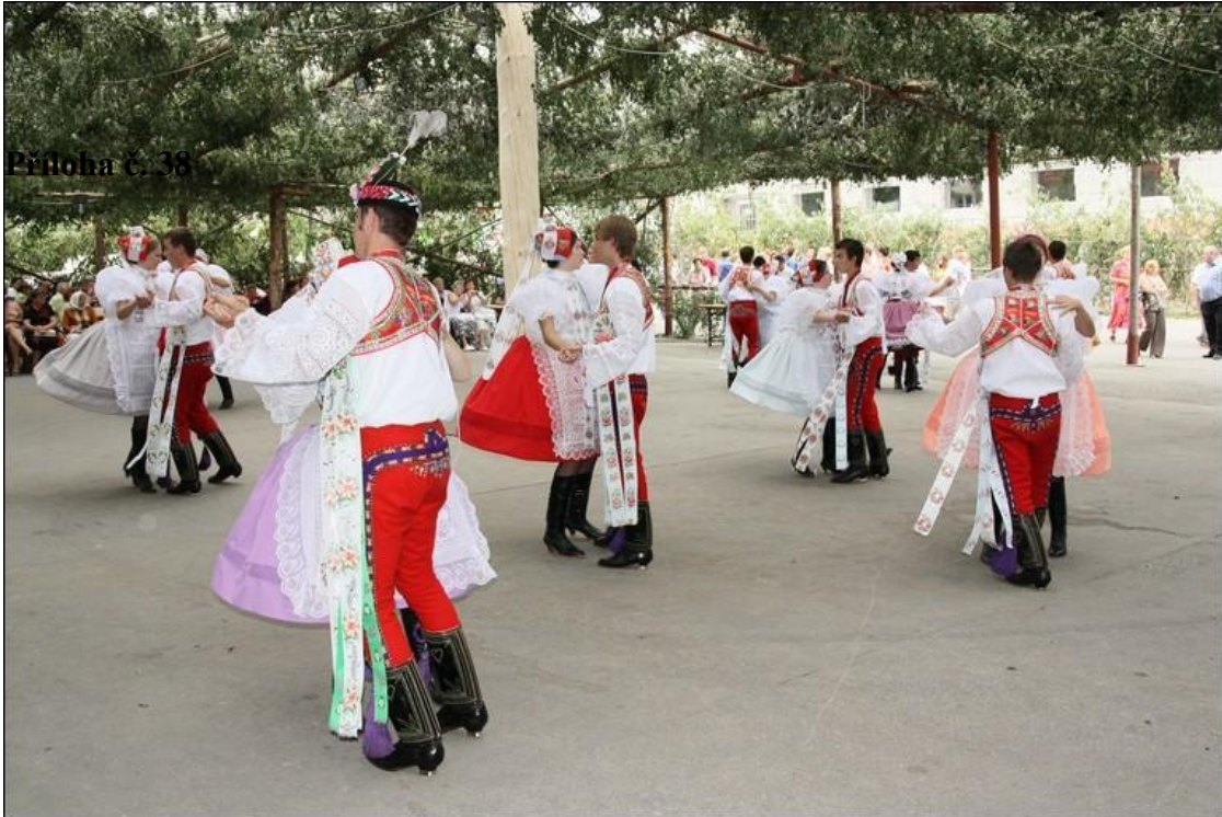
Hody – taneční „sólo“. Autor: Lukáš Vaculík.