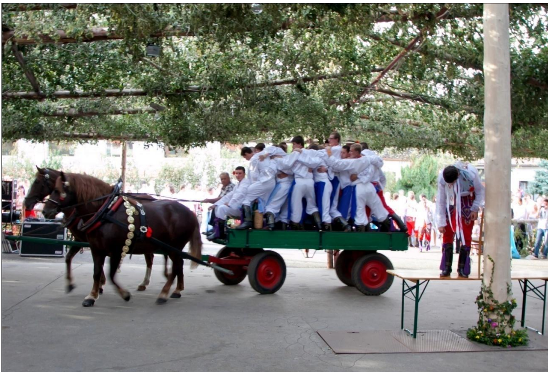
Hody neděle – příjezd přespolních „šohajů“ na koňském povoze.