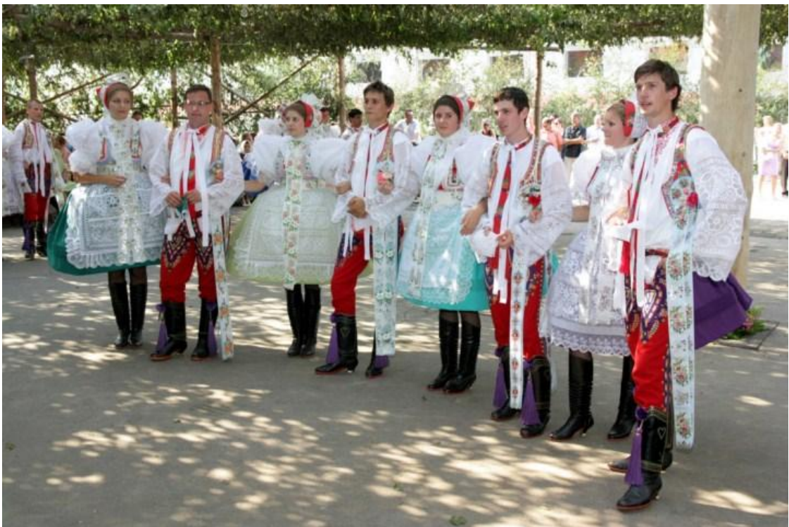
Hody. Autor: Lukáš Vaculík.