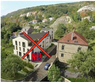
Domy Semmering místo hřiště

Po staletí byly Prokopské a Dalejské údolí zapomenutým místem. Probíhala zde pouze malorozsahová těžba vápence, která naopak přispěla ke zvýšení malebnosti krajiny odkrytím geologických profilů a vytvořením jezírka. Díky své nedostupnosti zůstalo Prokopské údolí jedním z nejzachovalejších přírodních oblastí na území Prahy. Spolu se Šáreckým údolím slouží občanům hlavního města ke každodenní aktivní rekreaci a přírodovědcům ke studiu vývoje Země.