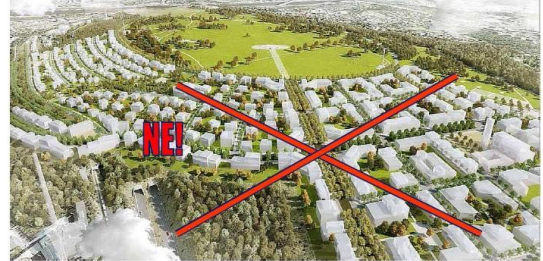
Kobercová zástavba Divčích hradů podle studie zadané MČ Praha 5

Další informace a celý volební program naleznete na www.spdv.wz.cz , www.facebook.com/spdvystavbe