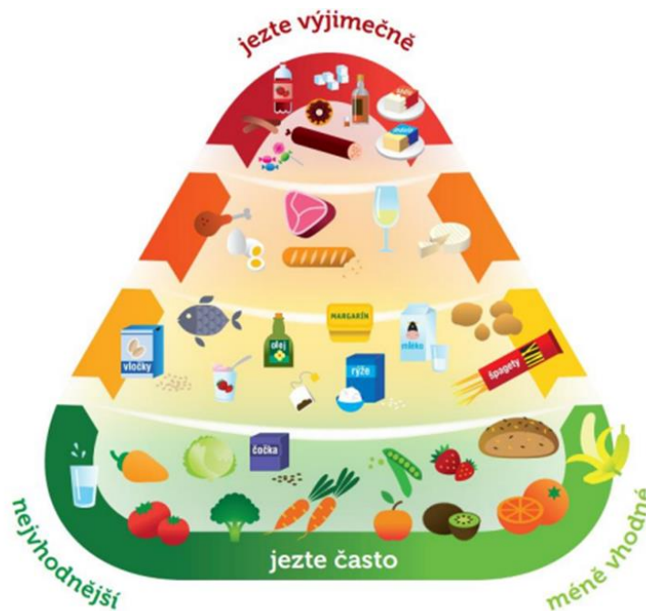
Obrázek 2. Pyramida zdravé výživy (www.fzv.cz, 2013)

Ačkoli je pyramida zdravé výživy efektivním nástrojem pro selekci adekvátních potravin, slouží pouze jen jako orientační průvodce pro průměrného spotřebitele, nikoli jako striktně určený režim. Při plánování osobního stravovacího režimu je nezbytné vzít v úvahu individuální energetické potřeby, zdravotní omezení a specifické preference k určitým potravinám, stejně jako praktické možnosti přípravy pokrmů (Klimešová & Stelzer, 2013).