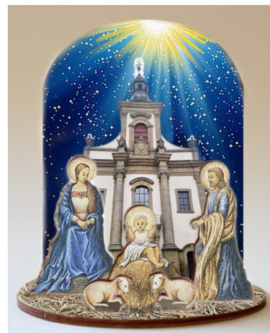
Obrázek 8: Betlém s kostelem v Ústí nad Orlicí

První ročník byl uspořádán v roce 2021 a návštěvnost činila přes 200 návštěvníků. Návštěvnost byla menší také z toho důvodu, že se jednalo o akci novou a že ještě bylo vše omezeno z důvodu koronavirové pandemie (do poslední chvíle nebylo jisté, zda bude moci výstava proběhnout). Druhý ročník byl uspořádán v roce 2022 a návštěvnost během víkendu přesáhla 700 lidí, což lze považovat za úspěch.