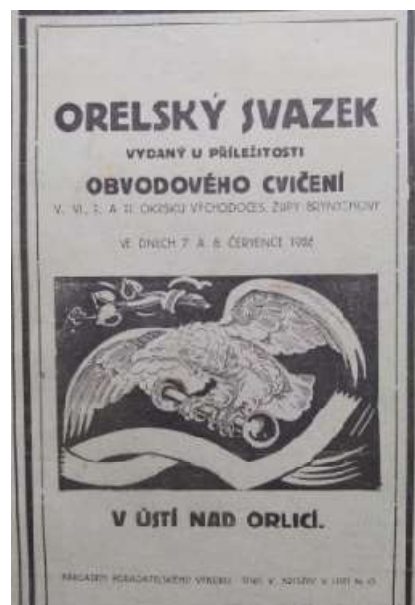
Obrázek 3: Brožura vydána k obvodovému cvičení

V roce 1936 jednota slaví 25 let od založení a je pořízen a posvěcen nový slavnostní prapor, na jehož financování se podíleli sami členové. U této příležitosti byl vydán i odznak. 29 V roce 1938 se v rámci Orla zakládá loutkové divadlo. Poslední veřejné sportovní vystoupení před zákazem Orla nacistickým režimem proběhlo v Klopotech v létě 1939. 30