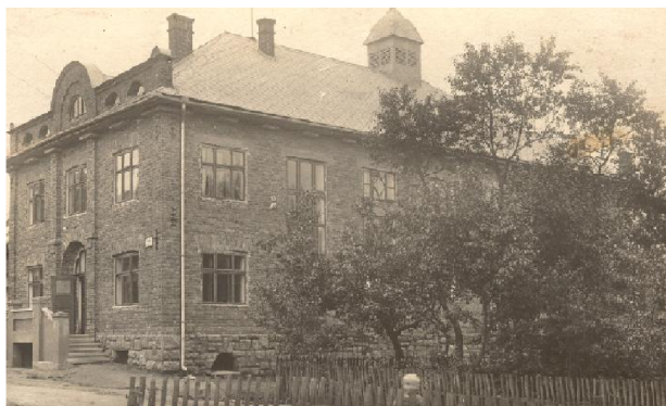
Obrázek 5: Budova Lidového domu

V období mezi světovými válkami se jednota věnovala cvičení ve všech věkových kategoriích: žáci, žákyně, dorostenci, dorostenky, ženy a muži. Ke sportovní a kulturní činnosti byl využíván místní hostinec, ve kterém jednota vykonávala činnost až do postavení Lidového domu (viz obrázek 5 72 ). 73 Členové se zapojovali nejen do činnosti v obci, ale také do okrskových cvičení, účastnili se sletů a veřejných cvičení okolních jednot. Významnou událostí bylo svěcení nového slavnostního praporu v roce 1923, který si téhož roku zakoupili členové. 74