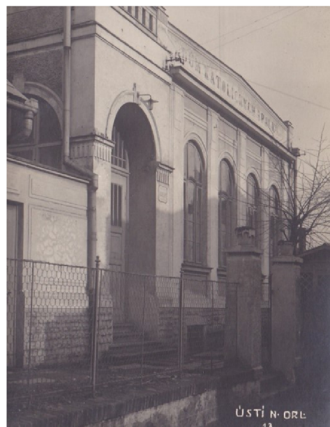
Obrázek 2: Dům Katolických spolků

Předchůdcem Orla v Ústí nad Orlicí byl spolek Svatojosefská jednota katolických jinochů a mužů, který byl založen v roce 1892 šestadvaceti členy a zaměřoval se na náboženskou, kulturní a sportovní činnost. Již v roce 1894 čítá spolek 96 členů. Svatojosefská jednota si pořídila slavnostní prapor, který v 1. polovině 20. století využívala jednota Orla na slavnostní příležitosti. Na přelomu 19. a 20. století pořizuje spolek dům od p. Adamcové, ve kterém má Konsumní jednota Svépomoc svoji prodejnu. Díky zisku