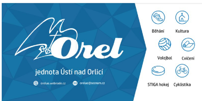
Obrázek 4: Banner Orel jednota Ústí nad Orlicí

Orel si nechal vyhotovit také několik bannerů (viz obrázek 4 70 ), které je možné na akcích umísťovat, a rollup, který svým jednoduchým sestavením plně vyhovuje potřebám jednoty.