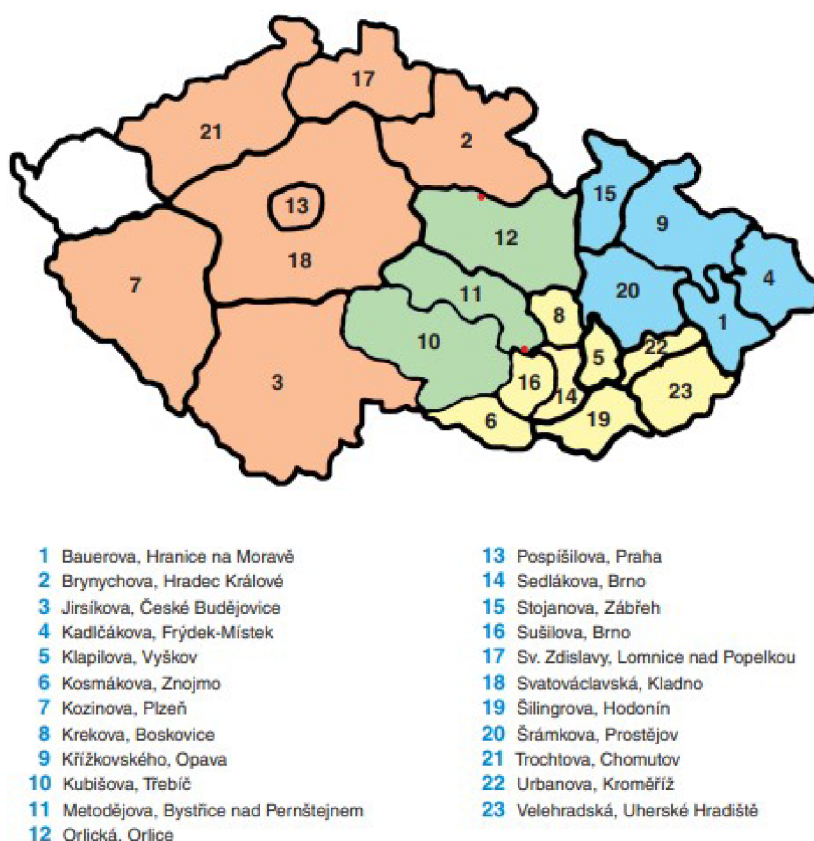
Obrázek 1: Mapa orelských žup vč. měst a obcí, kde má župa zřízeno sídlo

Nejvyšším orgánem župy je župní sjezd. Dále je župa řízena župní radou, která se musí scházet alespoň 2x ročně, a župním předsednictvem, které zajišťuje činnost župy mezi zasedáními župní rady. Župa má rovněž zřízenou župní revizní komisi. 5