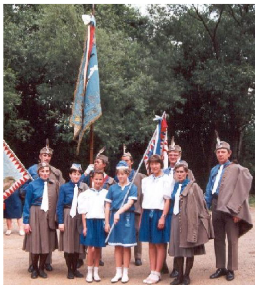
Obrázek 6: členové jednoty Orla Dolní Dobrouč při oslavách obce v roce 1992

K obnově jednoty došlo 24. 11. 1992 (viz obrázek 6 81 ) a ihned po založení se začalo jednat o navrácení Lidového domu. Za tímto účelem probíhala složitá jednání. Ta nebyla podložena právními dokumenty, záměr o navrácení budovy nemohl být realizován a žádný majetek odcizený jednotě Orla po roce 1948 nemohl být Orlu navrácen. 82 Více informací, proč nebylo zabránění majetku právně doloženo, almanach neuvádí.