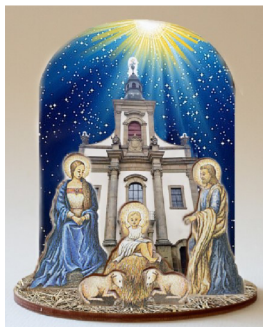
Obrázek 8: Betlém s kostelem v Ústí nad Orlicí

První ročník byl uspořádán v roce 2021 a návštěvnost činila přes 200 návštěvníků. Návštěvnost byla menší také z toho důvodu, že se jednalo o akci novou a že ještě bylo vše omezeno z důvodu koronavirové pandemie (do poslední chvíle nebylo jisté, zda bude moci výstava proběhnout). Druhý ročník byl uspořádán v roce 2022 a návštěvnost během víkendu přesáhla 700 lidí, což lze považovat za úspěch.