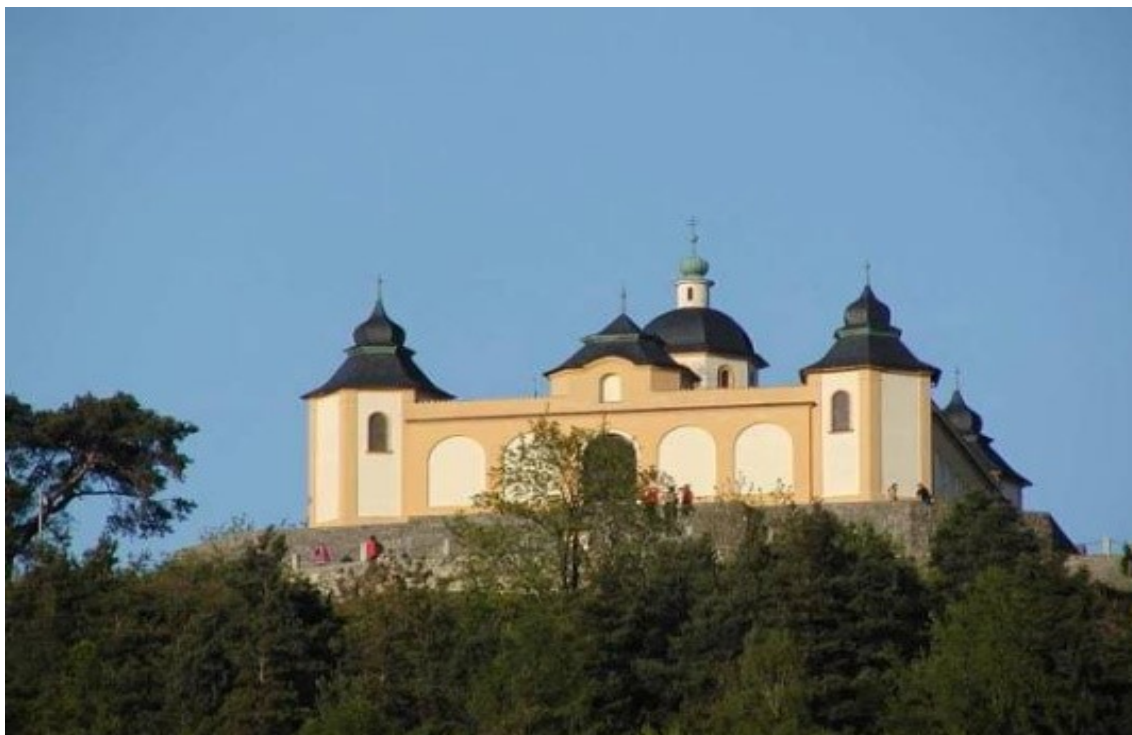
Obr. č. 6. Kostel sv. Felixe z Kantalicia řádu bratří kapucínů