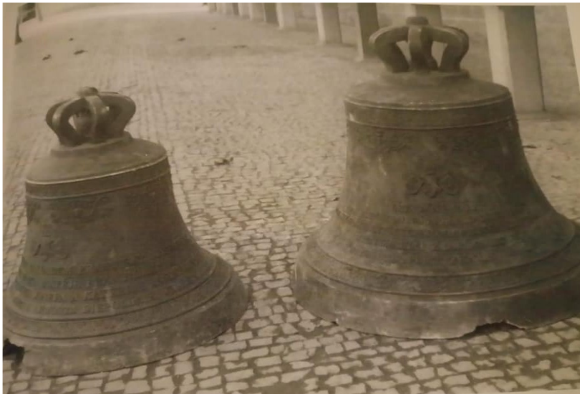
Obr. č. 13. Slavnostní svěcení zvonů Václav, Vojtěch a Jan Nepomucký 23. října 1932