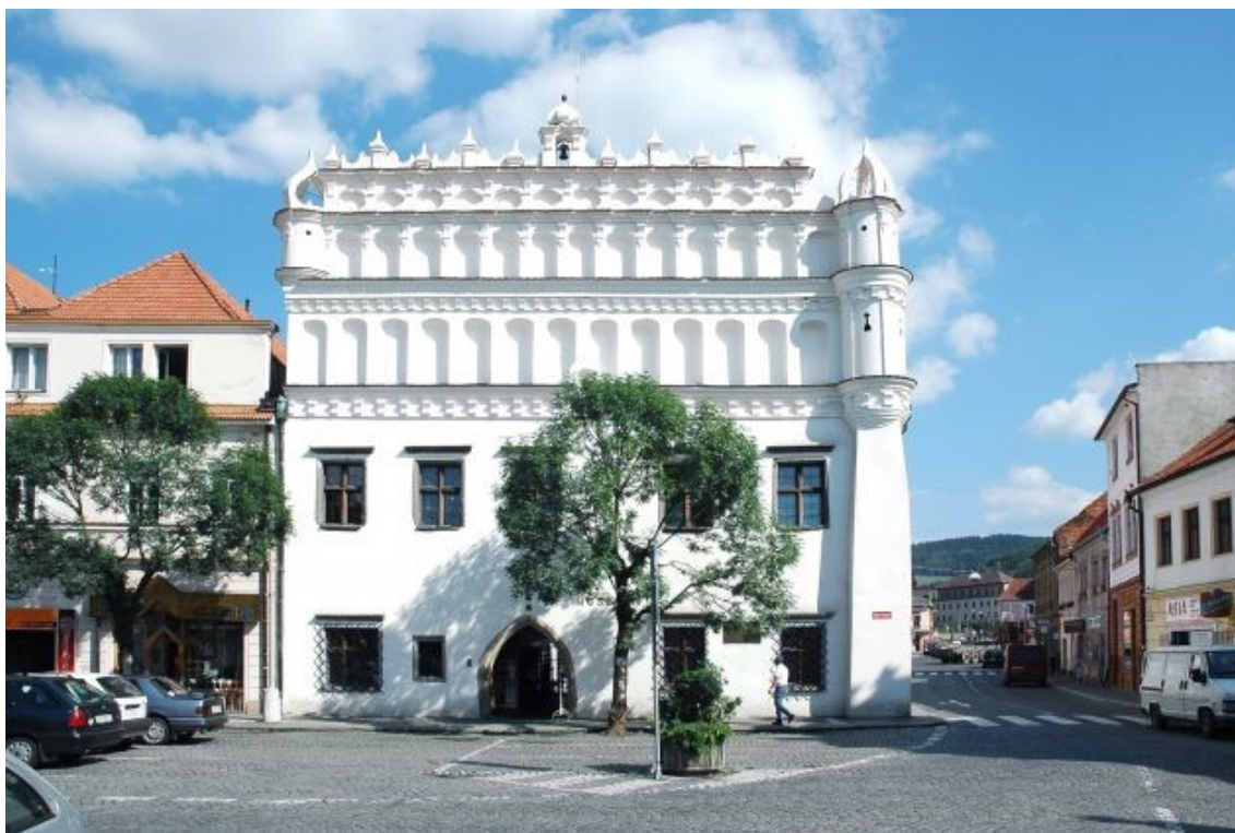
Obr. č. 16. Budova děkanství „Na Baště“. Postavena roku 1933