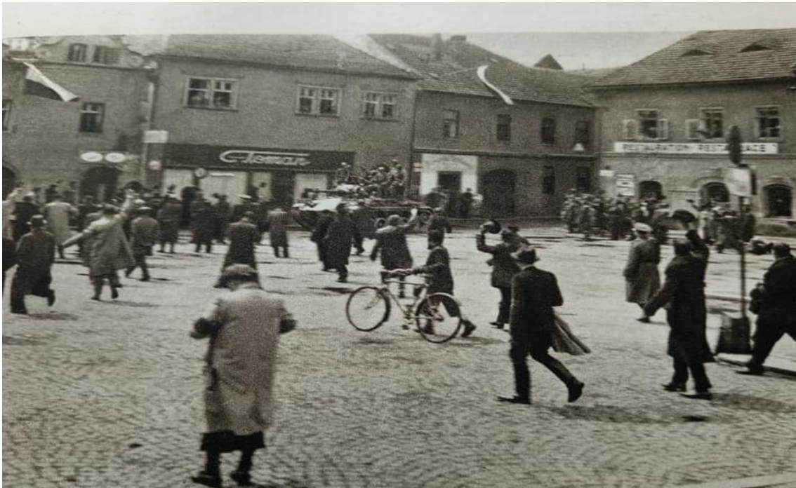
Obr. č. 21. Osvobození. Sušičtí občané zaplnili náměstí, aby se společně radovali nad znovunabytou svobodou a projeví vděk osvoboditelům