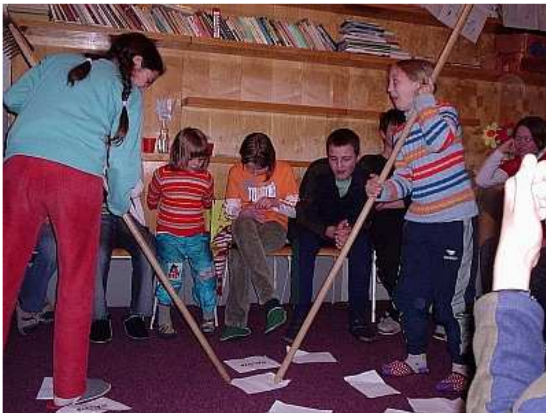
Příloha IV: Fotografie z činnosti SHM Klub Kruceburk