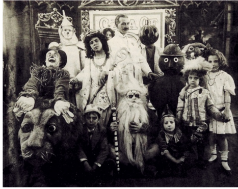
Obrázek 3 – Neznámý autor, L. Frank Baum obklopený postavami v The Fairylogue and Radio-Plays , 1908.