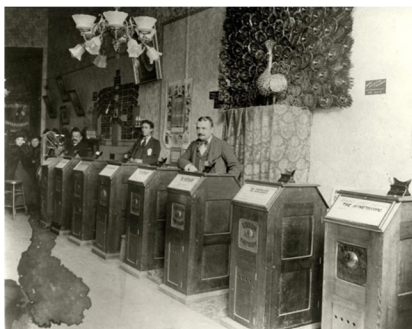
Obrázek 1 – Neznámý autor: Kinetoskop v San Franciscu, 1894–95.

poskytnout vizuální doprovod k hudebním záznamům. Spolu s asistentem William Kennedy Dicksonem odhalil v roce 1891 revoluční kinetograf – kameru zaznamenávající objekty v pohybu. Pohyby postav přenášel na celuloidový film, a jednotlivé nahrávky prezentoval pomocí kinetoskopu , raného předchůdce filmového projektoru. Po řadě testů si mohla veřejnost poprvé užít krátké ozvučené filmové smyčky promítané do zvětšovacíh čoček na horní části přístroje. 2