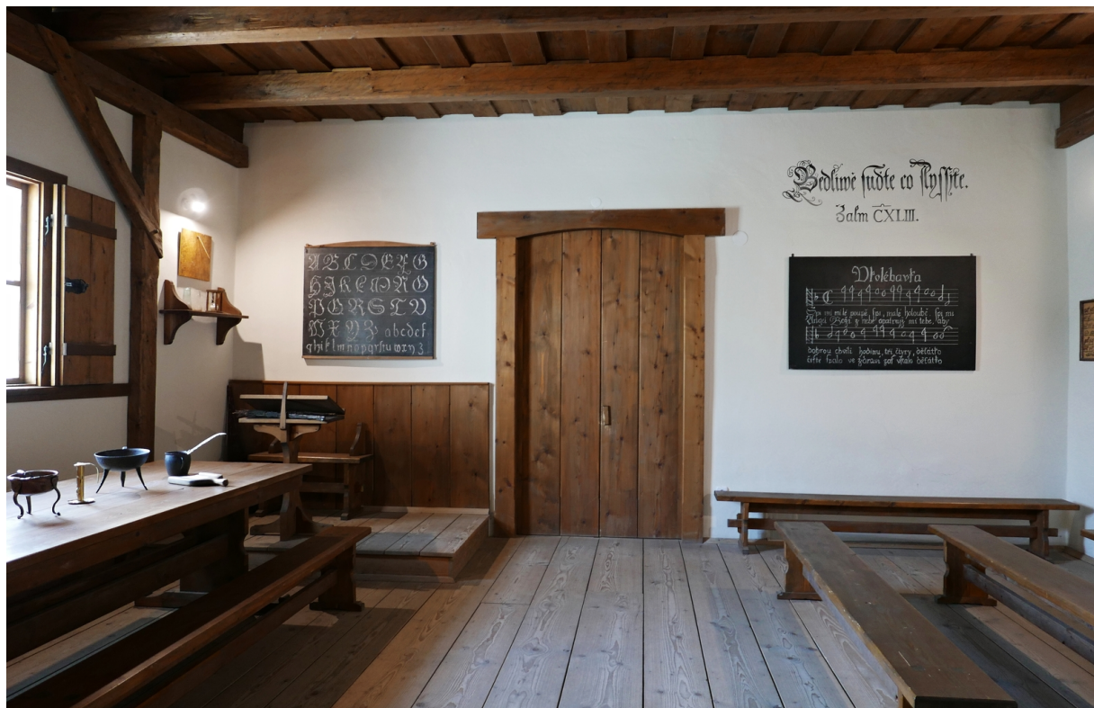
Fotografie č. 1: Rekonstrukce třídy 17. století z dob Jana Ámose Komenského