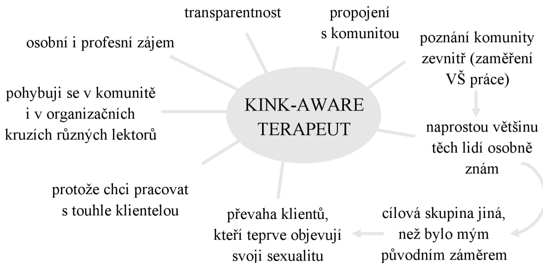
Graf 3: Schéma znázorňující aspekty související s označováním se jako kink-aware terapeut

Rozhovor se od ostatních lišil tím, že se jednalo o nejkratší rozhovor a jako jediný proběhl skrze telefonní spojení. Právě možná kvůli tomu, že jsme se s danou respondentkou nemohly vidět, byl rozhovor tak rychlý. Zároveň jsem pocítovala jistý odstup ze strany respondentky, který mohl mít souvislost s jejími negativními zkušenostmi z předchozího poskytování rozhovorů. Nicméně jsem si velmi vážila její ochoty se zúčastnit a času, který mi věnovala, protože se jednalo o další z velmi milých a inspirativních rozhovorů.