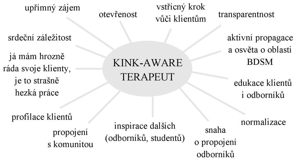
Graf 5: Schéma znázorňující aspekty související s označováním se jako kink-aware terapeut

Tímto jsme si tedy představili všech pět respondentů, kteří se zúčastnili našeho výzkumu. A jak můžeme vidět, ačkoliv všichni z nich používají stejné označení kink-aware, pro každého představuje přeci jen trochu něco jiného a přiřkládají mu různou váhu. Podobně se liší i jejich cesty, jak se k této oblasti či samotnému pojmenování dostali. Jedno mají však společné. Jedná se o osoby, jež se rozhodly veřejně prezentovat jako kink-aware terapeuti a tím klientům usnadnit vyhledávání odborné péče. Jasně tak klientům dávají najevo, že jsou otevřeni pracovat s touto klientelou a nabídnout jim bezpečné a přijímající prostředí. Pojdme se tedy společně podívat, jaké další společné aspekty se objevily napříč jednotlivými případy a v jakých ohledech se podobají.