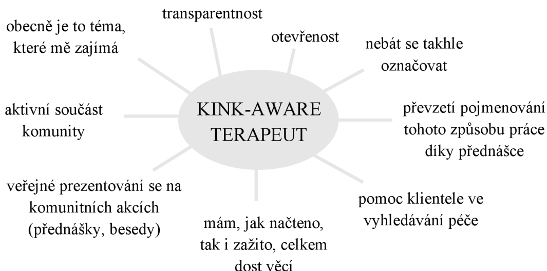
Graf 4: Schéma znázorňující aspekty související s označováním se jako kink-aware terapeut

Naše setkání bylo uskutečněno prostřednictvím online platformy a trvalo 50 minut. Na respondentce jsem velmi oceňovala její autentičnost a otevřenost, kterou si udržovala po celou dobu rozhovoru. Po jeho skončení mě zároveň mile překvapila i svými doplňujícími otázkami na celý výzkum i moji osobu a celá diskuse byla opět velmi příjemná.