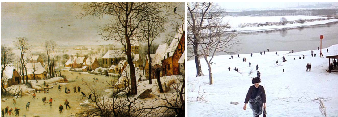
Obrázek 4 a 5: Pieter Brueghel, Zimní krajina s bruslaři X Andrej Tarkovkij, Zrcadlo