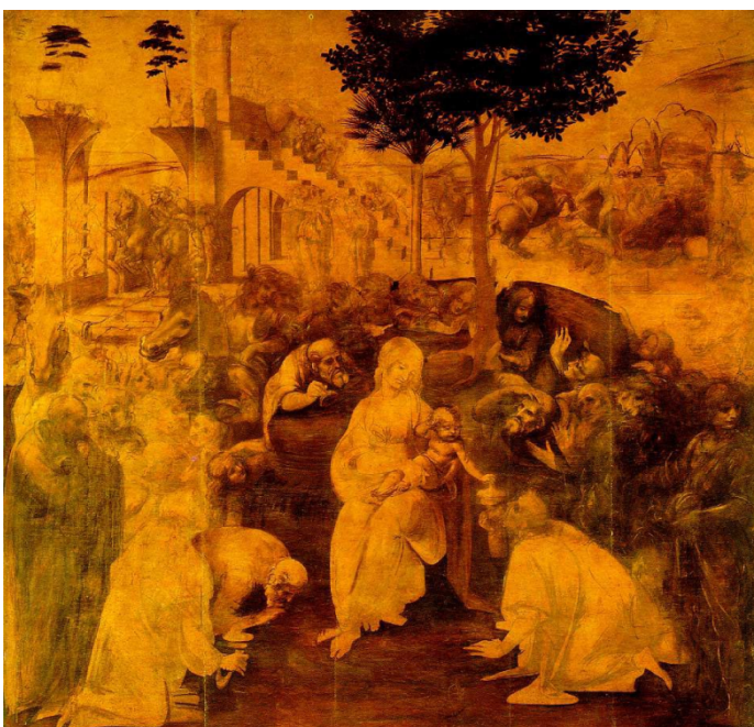
Obrázek 8: Leonardo da Vinci, Klanění tří králů