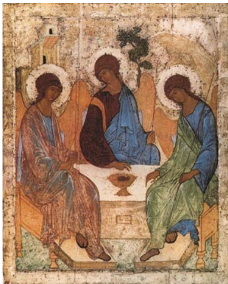
Obrázek 1: Andrej Rubljov, Svatá trojice