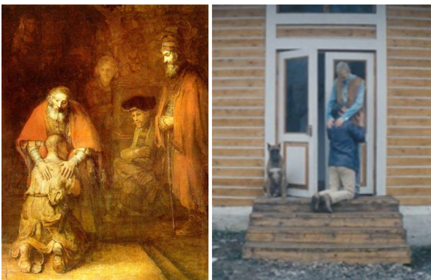
Obrázek 2 a 3: Rembrandt van Rijn, Návrat marnotratného syna X Andrej Tarkovskij, Solaris