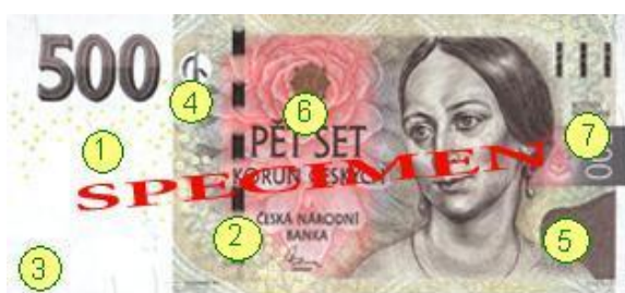
Obr. 11: Ochranné prvky na nominálu 500 Kč - líc

7. Mikrotext. Lze ho nalézt v pruhu vybíhající do pravého okraje papíru. Kolem velké nominální hodnoty jsou mikropísmem vepsány malé nominální hodnoty.