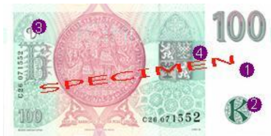
Obr. 6: Ochranné prvky na nominálu 100 Kč – rub

4. Mikrotext. Je umístěn vedle státního znaku a opakuje se zde text sto korun. Na první laický pohled jej není možné rozeznat.