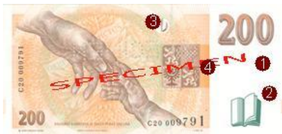
Obr. 9: Ochranné prvky nominálu 200 Kč – rub