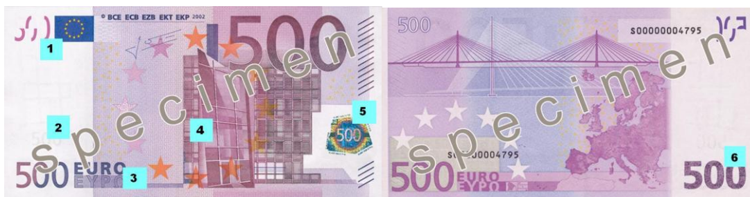
Obr. 35: Ochranné prvky na nominálu 500 €