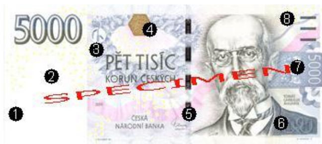
Obr. 20: Ochranné prvky na nominálu 5.000 Kč – líc

8. Iridiscentní pruh. Rozprostírá se mezi hlavním portrétem a hmatovou značkou, přičemž částečně zasahuje do obou. Má nepravidelný tvar a je na něm uvedena světlým tiskem nominální hodnota. Odráží se od něj zlaté a fialové odlesky.