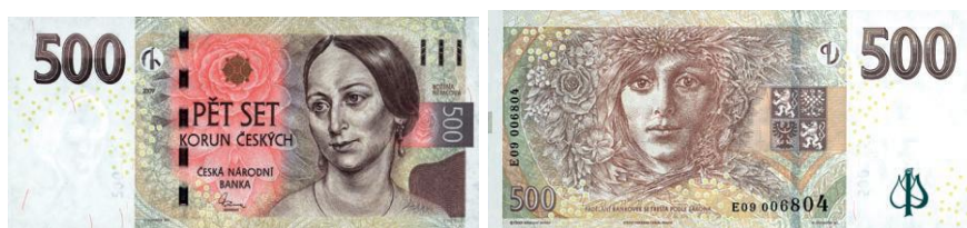
Obr. 10: 500 Kč

Česká národní banka vydala v roce 2009 již čtvrtý vzor bankovky o nominální hodnotě 500 Kč (viz obr. 10). Předcházející vzory byly vydány v letech 1993, 1995 a 1997, ale v současné době je první vzor již neplatný. Bankovce vzoru 2009 byla ponechána velikost i základní charakteristické rysy, ale vzhledem k poměrně velkému časovému skoku vydání bankovky byla významně posílena ochrana tohoto nominálu. Na lící straně v pravém horním rohu jsou umístěny tři svislé proužky, které slouží pro zrakově postižené osoby jako hmatový znak.