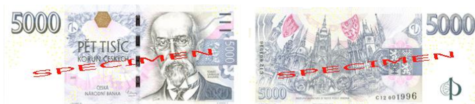
Obr. 19: 5.000 Kč

Česká národní banka v roce 2009 (viz obr. 19) vydala již třetí vzor pětitisícikoruny. Předcházely mu vzory 1993 (již neplatný) a 1999. Hmatovou značkou pro zrakově postižené osoby jsou zde tři vodorovné čárky pod sebou.