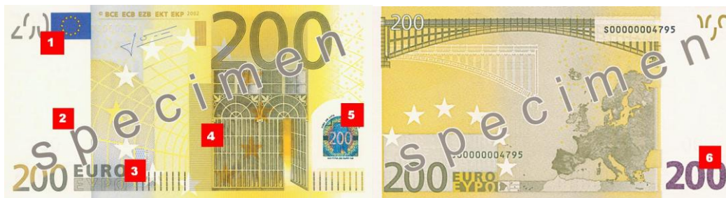
Obr. 33: Ochranné prvky na nominálu 200 €

6. Opticky proměnlivá barva. V závislosti na tom, z kterého úhlu bude na nominální hodnotu v pravém dolním rohu hleděno, se střídá fialová barva se zelenohnědou.