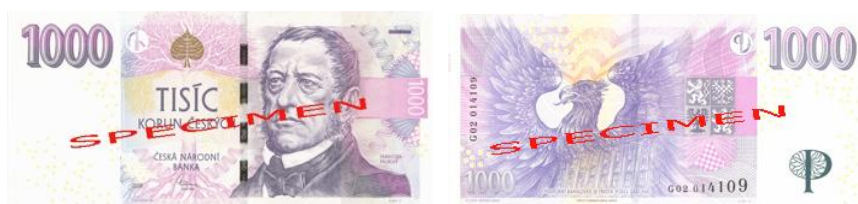
Obr. 13: 1.000 Kč

Bankovka s nominální hodnotou 1.000 korun českých má tři vzory. Nejstarší je z roku 1993 (již neplatný, ale stále v bankách vyměnitelný), následoval vzor 1996 a poslední byl vydán v roce 2008 (viz obr. 13). Na tomto nominálu slouží jako hmatový znak pro zrakově postižené osoby jedna vodorovná čárka v pravém horním rohu papíru.