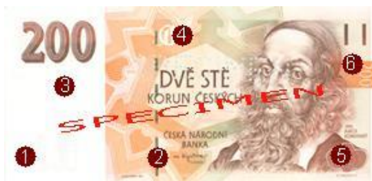
Obr. 8: Ochranné prvky nominálu 200 Kč – líc