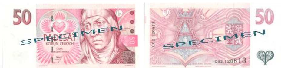
Obr. 1: 50 Kč

Bankovka s nominální hodnotou 50 Kč byla poprvé vydána v roce 1993 (tento vzor je již neplatný). Následovaly ho vzory 1994 a 1997 (viz obr. 1), které již také ukončili svou platnost. Na lící straně bankovky lze najít hmatový znak pro zrakově postižené, jež má podobu tří kroužků umístěných svisle pod sebou v pravém horním rohu bankovky.