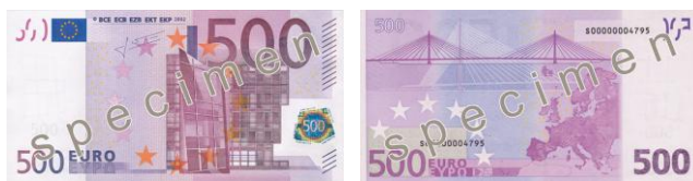
Obr. 34: 500 €