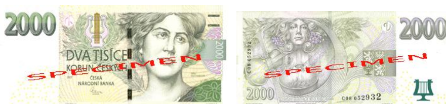
Obr. 16: 2.000 Kč

Dvoutisícikoruna je jedinou českou bankovkou, která nebyla vydána poprvé v roce 1993, a přesto má již tři vzory. Poprvé světlo světa spatřila v roce 1996, poté v roce 1999 a poslední vzor byl vydán v roce 2007 (viz obr. 16). Dvě vodorovné čárky pod sebou v pravém horním rohu bankovky symbolizují hmatový znak pro zrakově postižené.