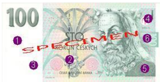
Obr. 5: Ochranné prvky na nominálu 100 Kč - líc