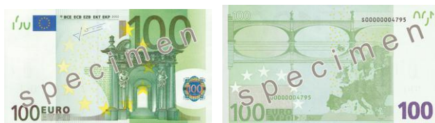
Obr. 30: 100 €

Zelená barva symbolizuje bankovku s nominální hodnotou 100 euro (viz obr. 26). Hlavní motiv ztvárňuje dva vzájemně si podobné architektonické slohy – baroko a rokoko. V těchto stylech dominuje především přehnaná zdobnost veškerých děl, zejména sloupů.