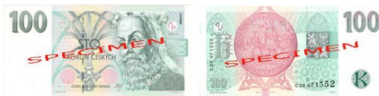
Obr. 4: 100 Kč