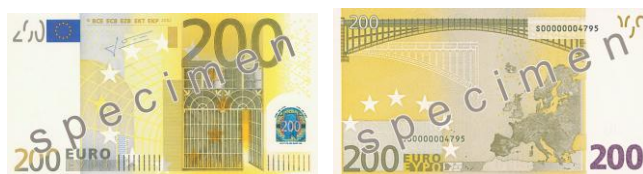
Obr. 32: 200 €

Bankovka o nominálu 200 euro (viz obr. 27) upoutá naši pozornost svou hnědožlutou barvou. Hlavní motivy jak na lici, tak na rubu papíru se nesou v duchu architektury 19. století.