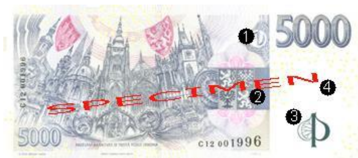
Obr. 21: Ochranné prvky na nominálu 5.000 Kč – rub