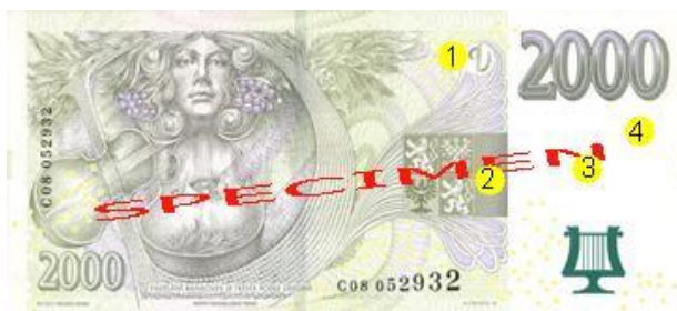
Obr. 18: Ochranné prvky na nominálu 2.000 Kč - rub