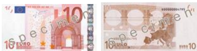
Obr. 24: 10 €

Nominál 10 euro (viz obr. 24) je zbarvený do červena. Podle nezaměnitelného půlkruhového oblouku vykresleného na líci poznáme románský architektonický sloh. Rubové straně vévodí taktéž most.