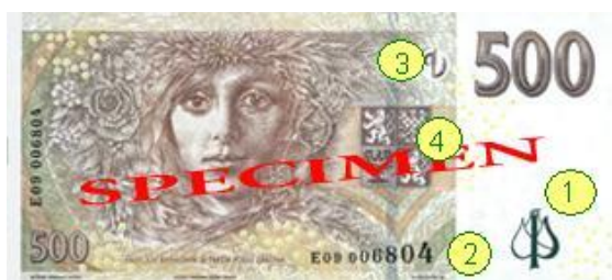
Obr. 12: Ochranné prvky na nominálu 500 Kč – rub