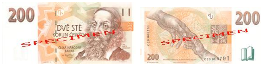
Obr. 7: 200 Kč

V roce 1998 byl vydán již třetí vzor dvousetkoruny (viz obr. 7). Následoval vzory 1993 (již neplatný) a vzor 1996. Jako hmatová značka pro zrakově postižené zde slouží dvě svíslé čárky umístěné v pravém horním rohu bankovky.