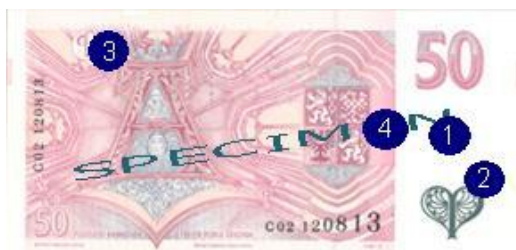
Obr. 3: Ochranné prvky na nominálu 50 Kč – rub