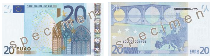
Obr. 26: 20 €