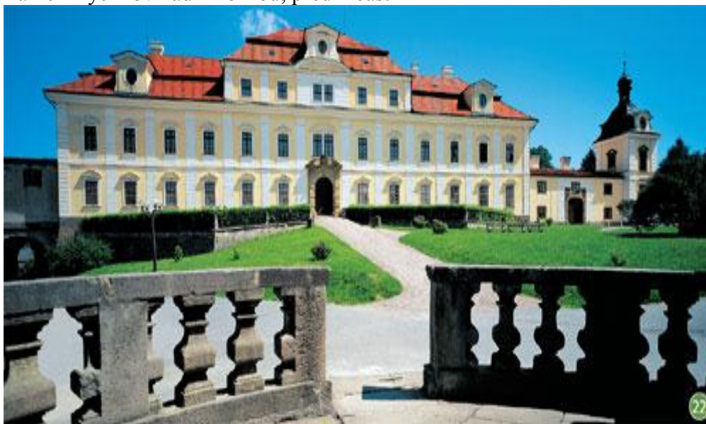
Zámek Rychnov nad Kněžnou, přední část