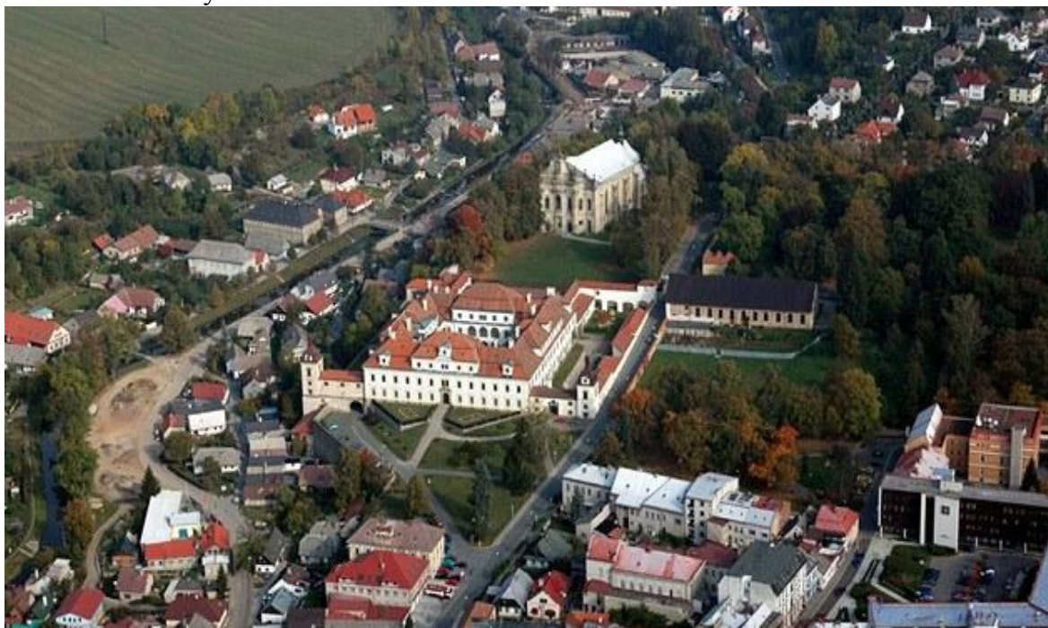
Historická část Rychnova nad Kněžnou