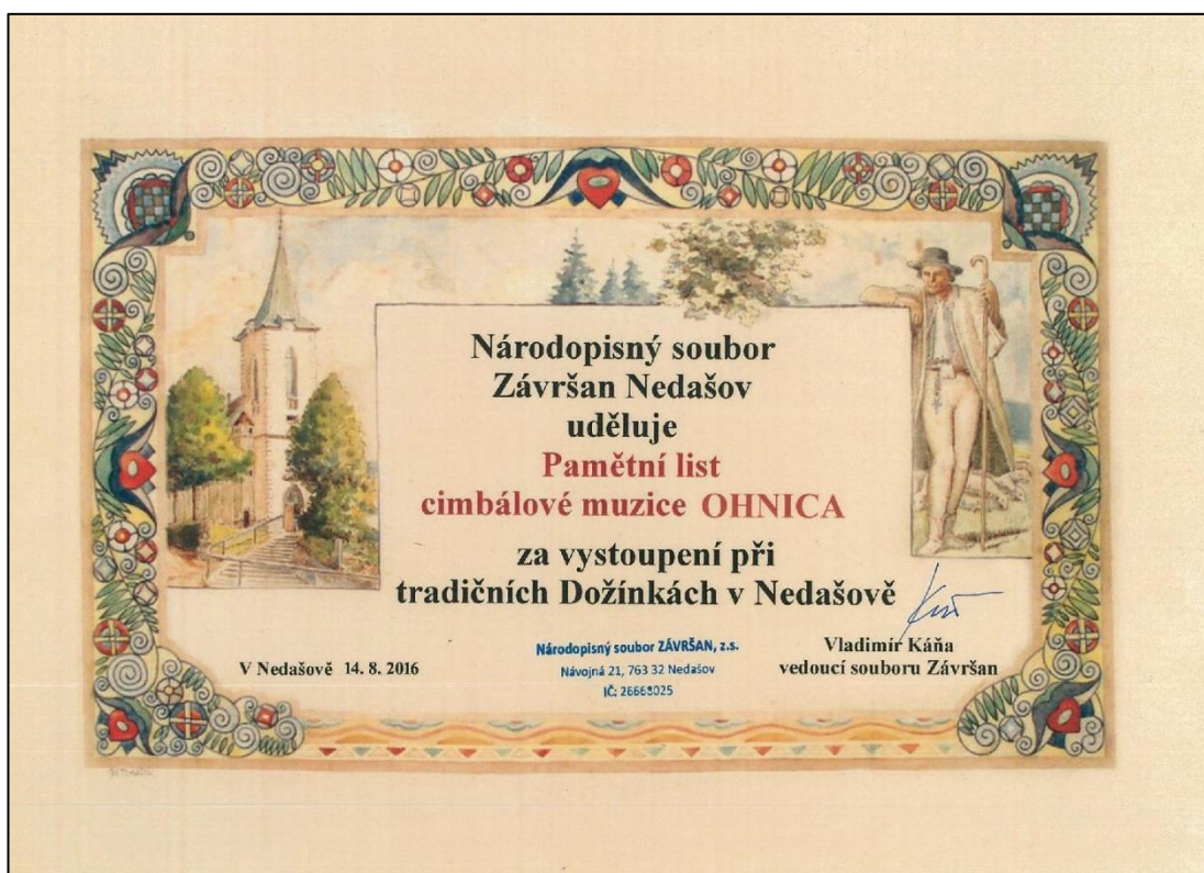
Příloha č. 22 – Pamětní list muziky za vystoupení při tradičních Dožínkách v Nedašově ze dne 14. srpna 2016