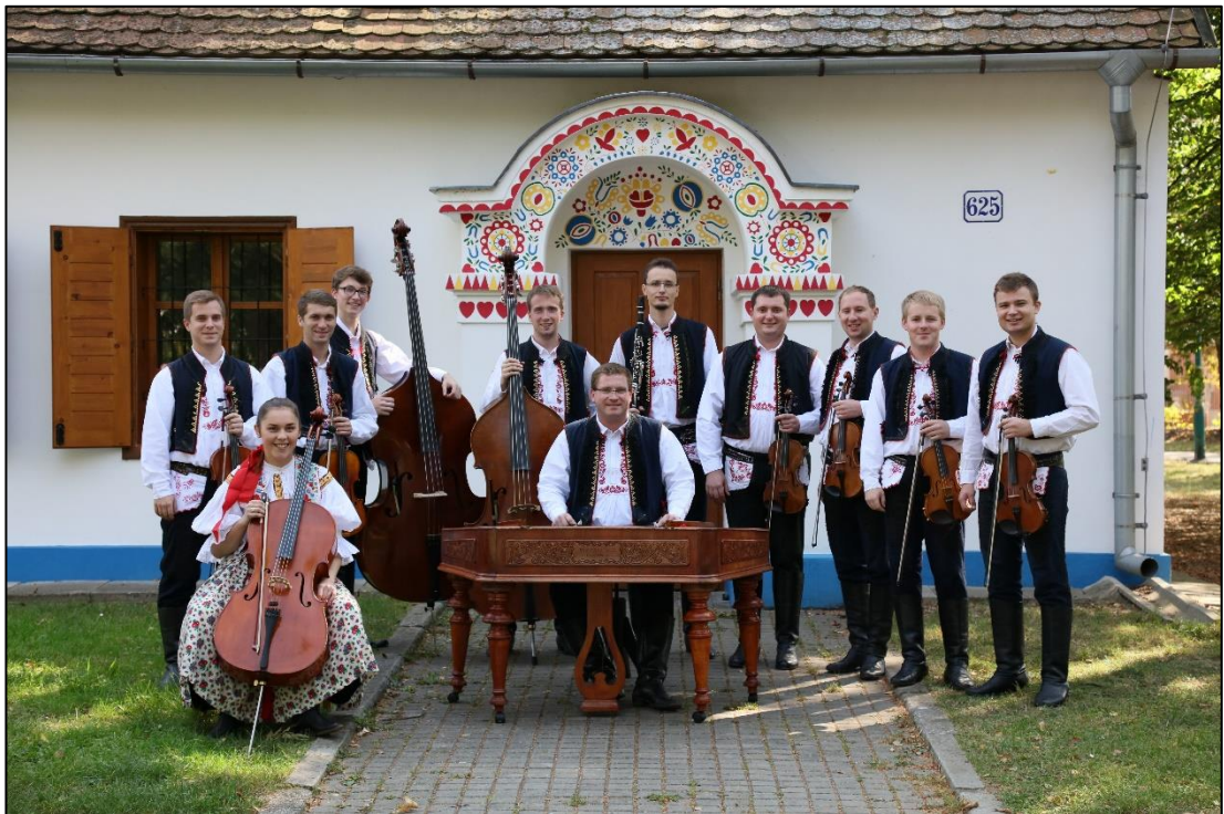
Příloha č. 24 – Fotografie cimbalové muziky Ohnica