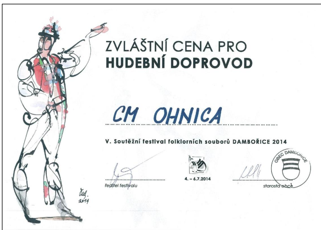
Příloha č. 20 – Zvláštní cena pro hudební doprovod CM Ohnica, V. Soutěžní festival folklorních souborů DAMBOŘICE 2014 ze dne 4.–6. července 2014