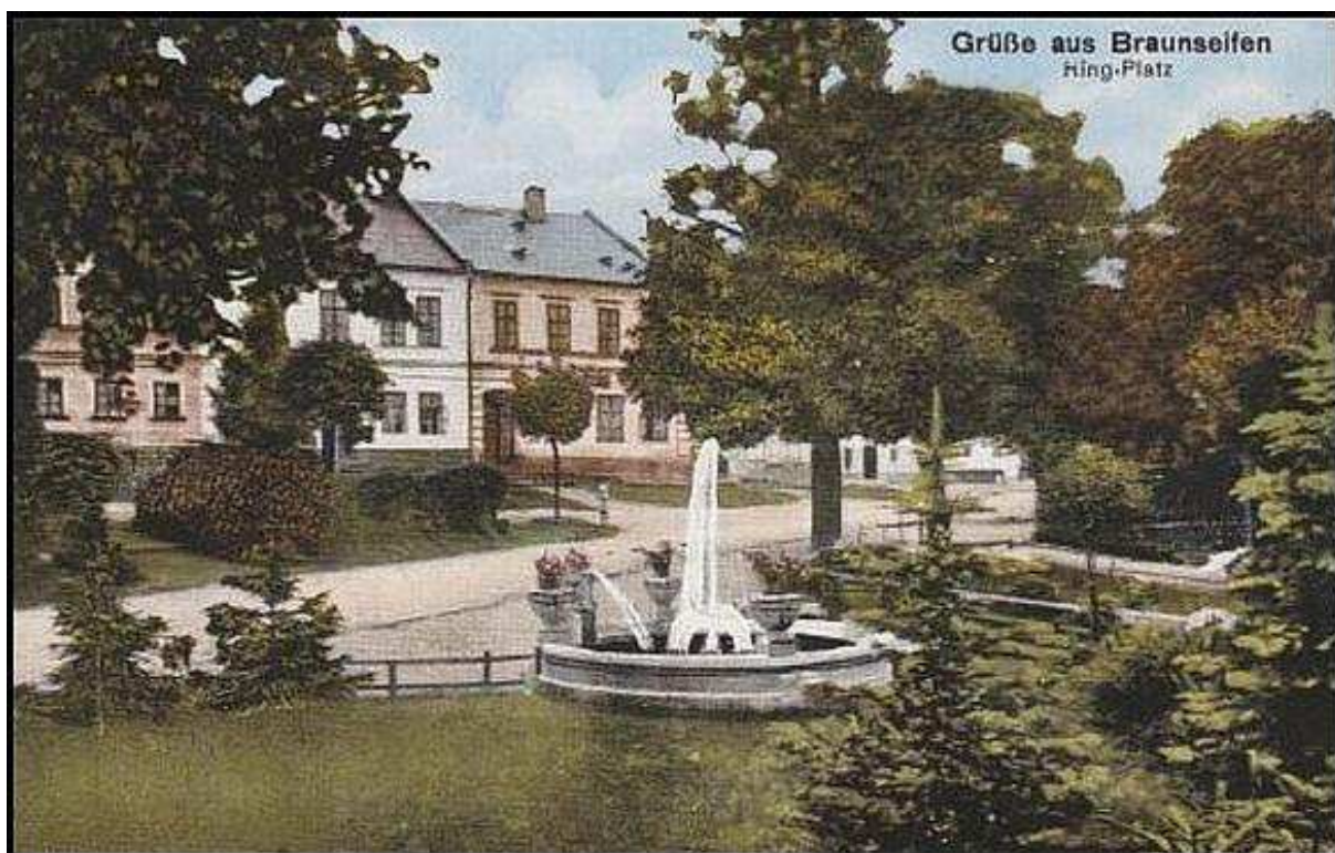
Obr. 2. Náměstí v Rýžovišti. Mezi lety 1900 – 1920.