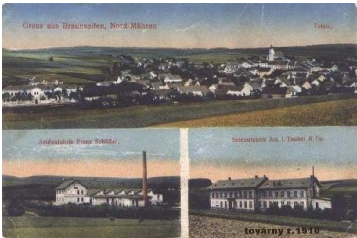
Obr. 2. Celkový pohled na Rýžoviště, Tauberova továrna, továrna Schöller (později Löri). Kolem roku 1910.