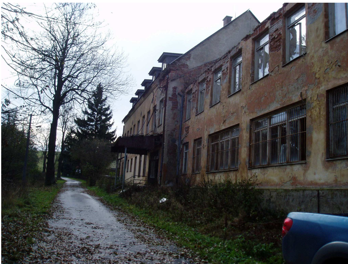
Obr. 1. Bývalá Tauberova továrna, nynější stav.