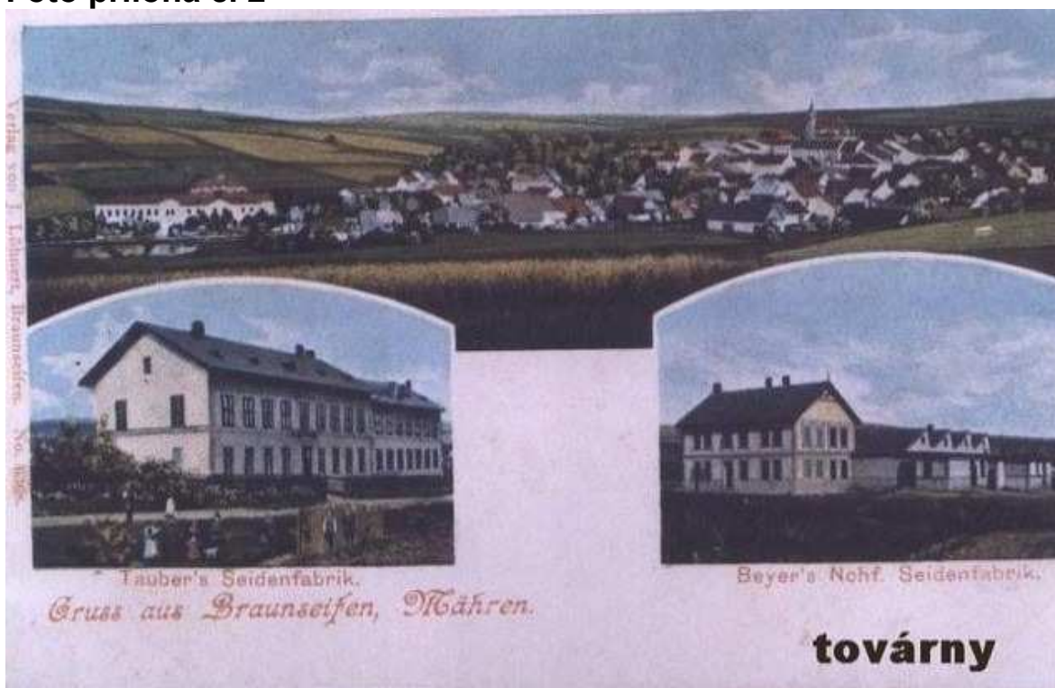
Obr. 1. Celkový pohled na Rýžoviště, Tauberova továrna, továrna Bayer. Kolem roku 1910.