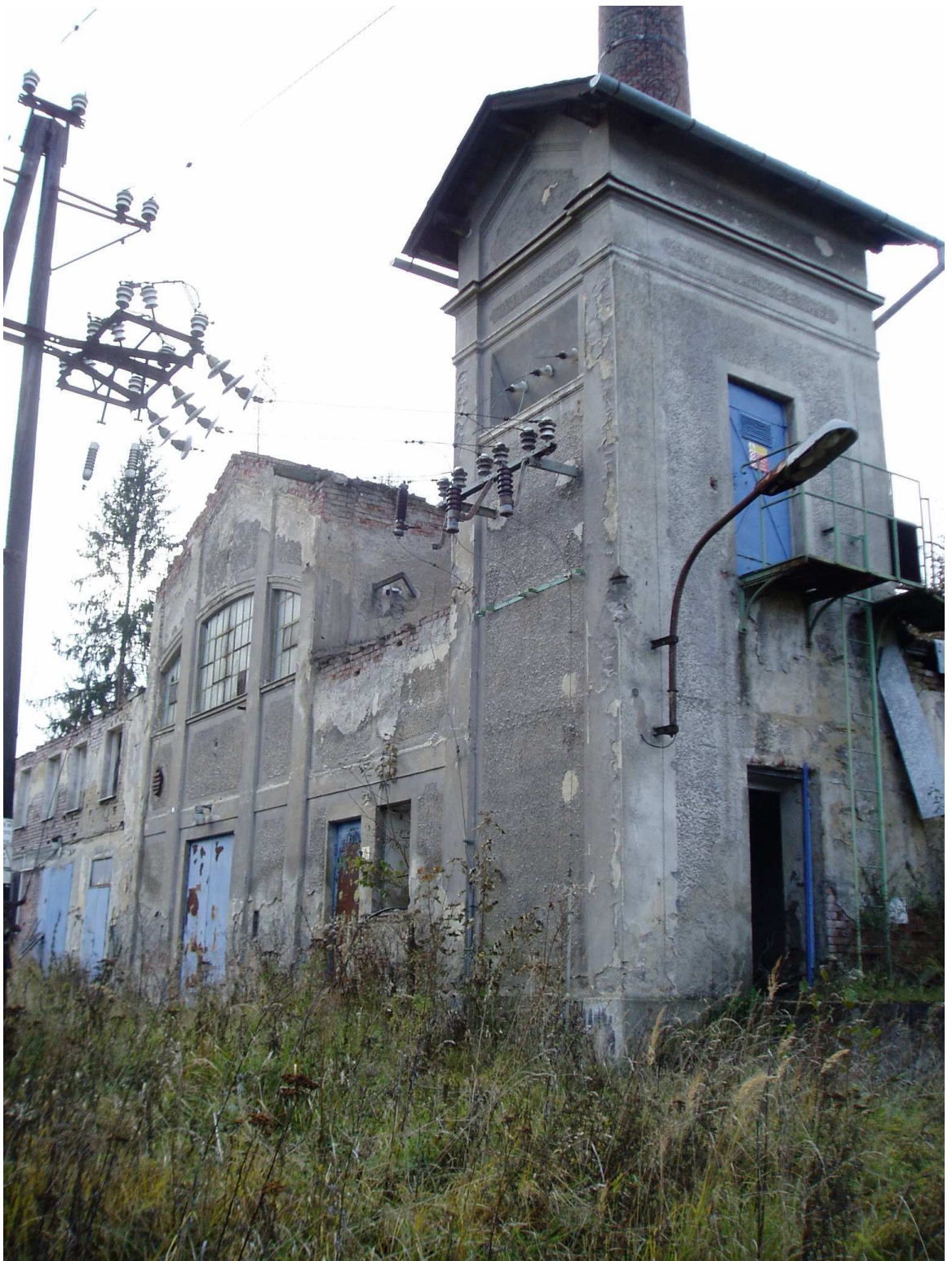
Obr. 2. Továrna na výrobu hedvábného zboží Heinrich Löri, nynější stav.