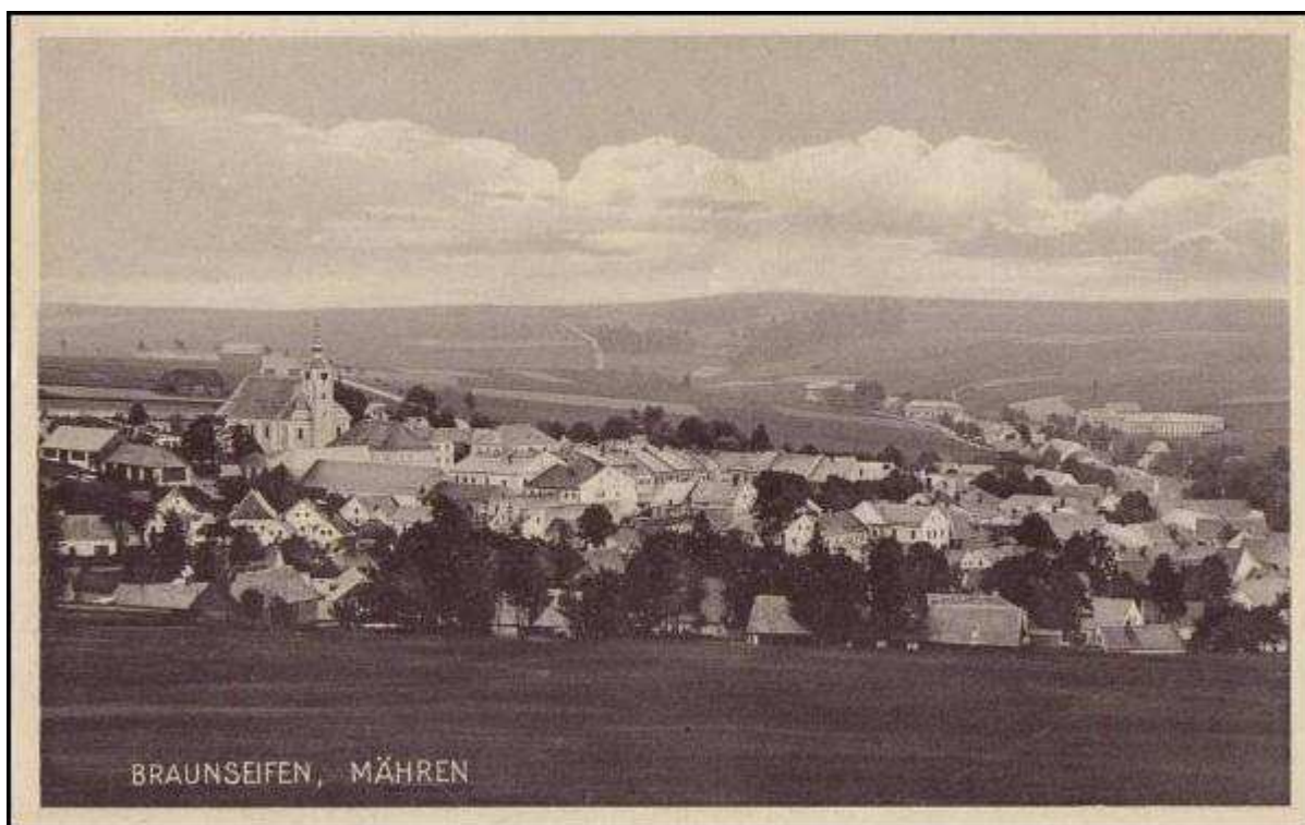
Obr. 1. Celkový pohled na město v roce 1936.