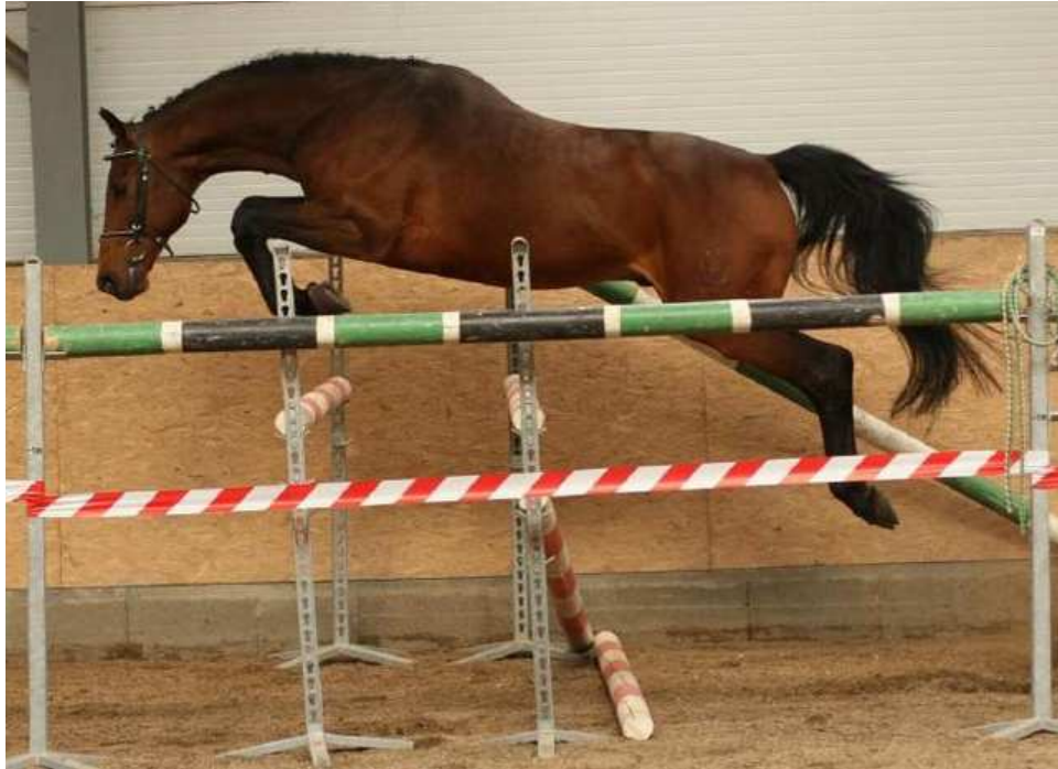
Obr. 3: Conway-T