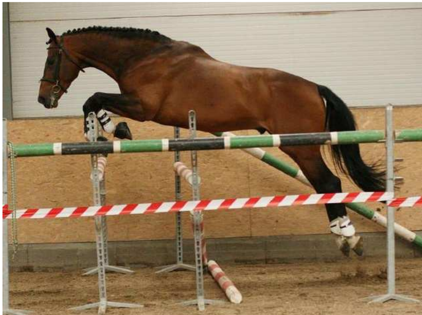
Obr. 6: Orido

Zdroj: http://www.muller-equine.cz/reprodukce-koni-1/historie-stanice/rok-2007-1/orido.htm