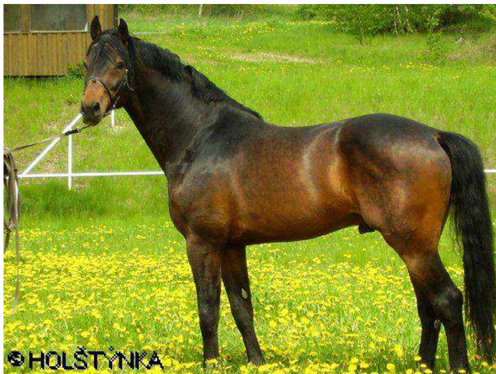
Obr. 1: Acordino-T