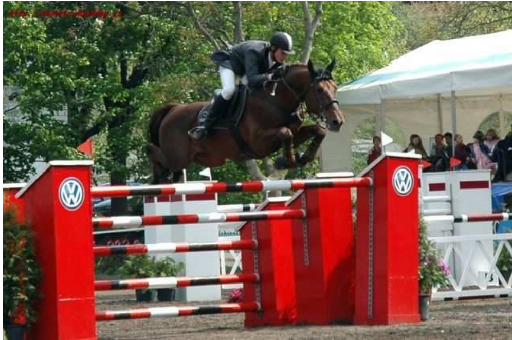
Obr.7: Przedswit Rufa