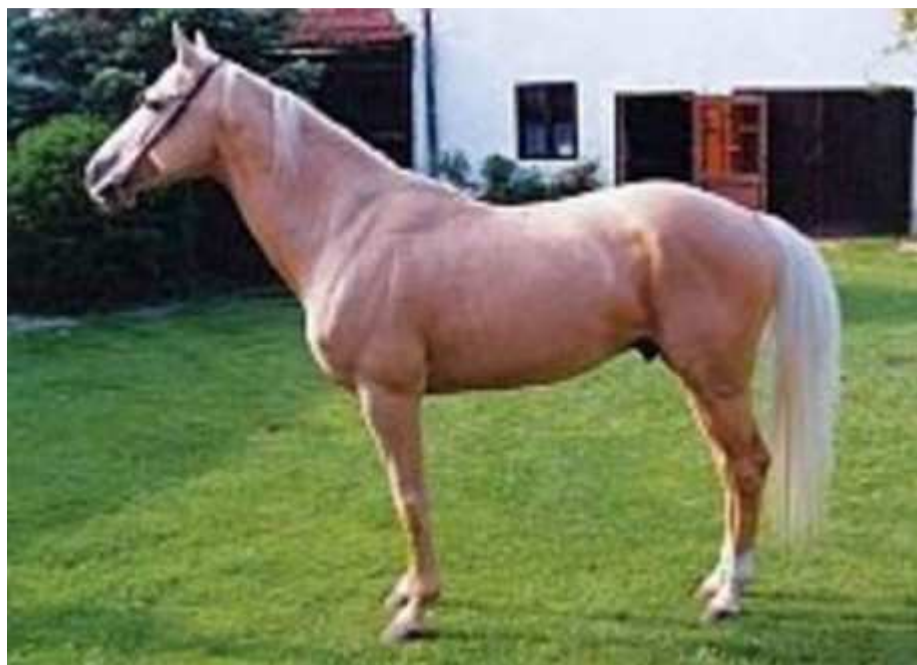
Obr. 2: Bell Ami