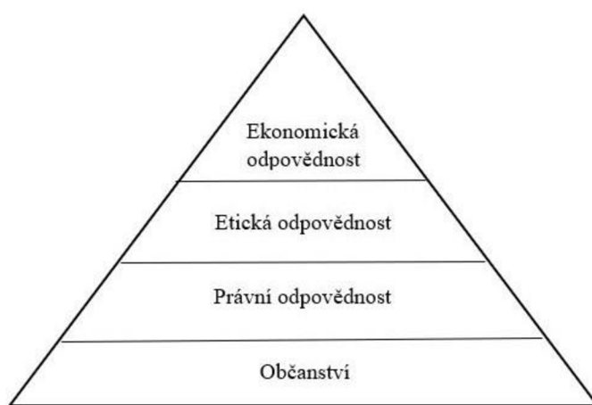
Obrázek 2 Pyramida společenské odpovědnosti ve veřejné správě