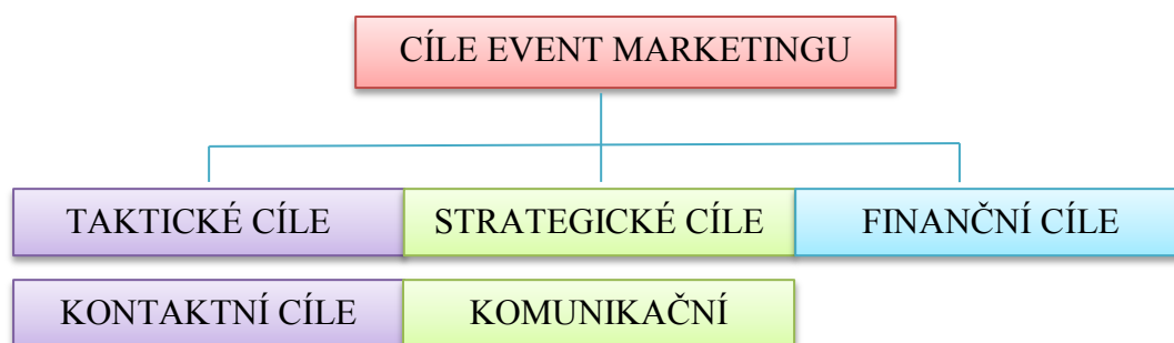
Obr. 3 - Dělení cílů event marketingu