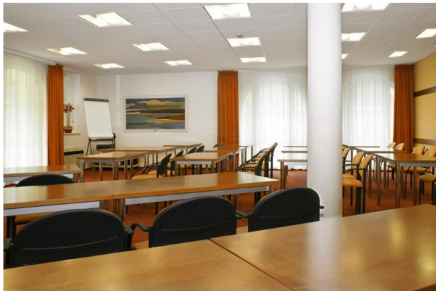
Obr. 6: Školní uspořádání sálu č. 4