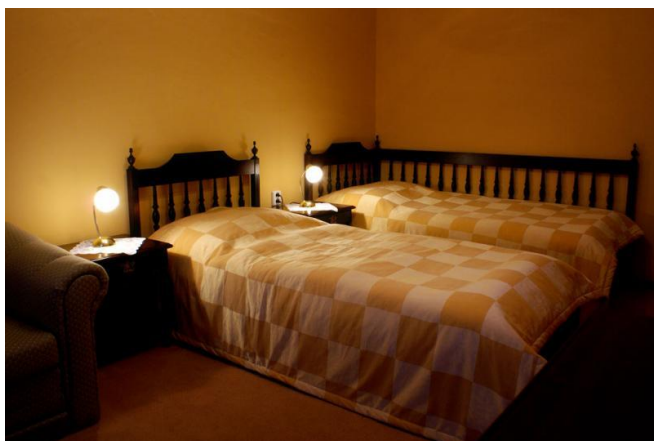
Příl. 6: Standartní dvoulůžkový pokoj