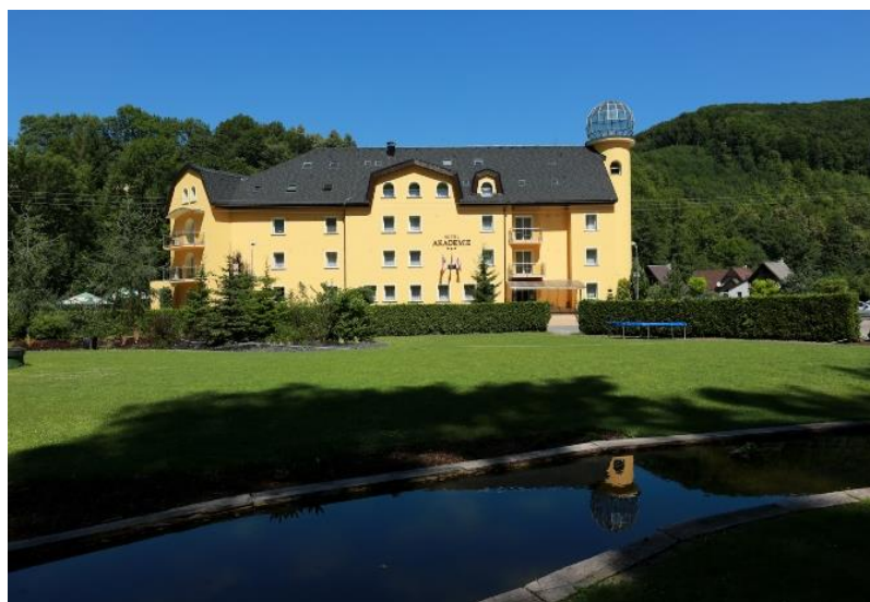
Obr. 5 - Seminární hotel Akademie na Hrubé Vodě