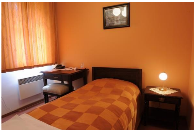
Příl. 5: Standartní jednolůžkový pokoj