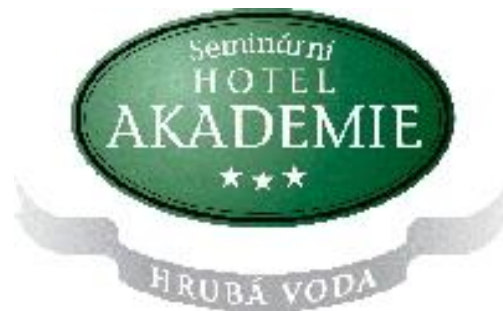
Obr. 4 - Logo Seminárního hotelu Akademie Hrubá Voda