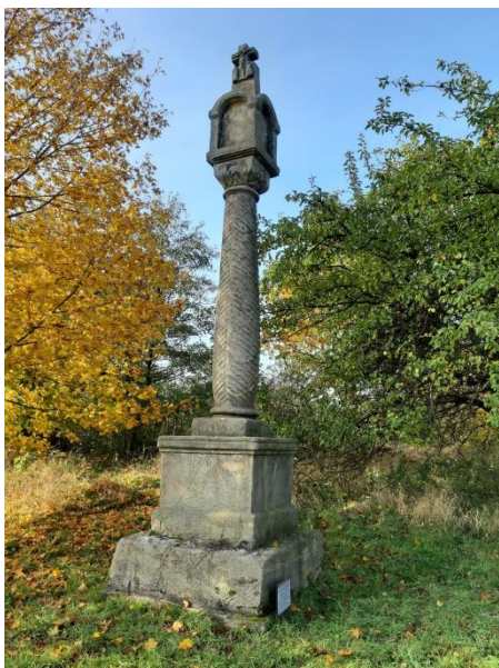
Obrázek 6 – Morový sloup na Převahách

Tato památka je pro Hodkovice jednou z nejvýznamnějších. Nachází se na cestě z Hodkovic na Petrašovice a Bílou. Jedná se o sloup, kterému nikdo neřekne jinak než Boží muka. (Poche 1977, s. 391) Údajně se stavěl v době, kdy se na české země hnala morová epidemie (1678). Byl symbolem Boží vůle a památkou na předchozí pohromy. Dílo je výjimečné svým zdobením. Jedná se o pískovec, který je šikmě žebrován po celém obvodu sloupu. Zajímavá je i horní kamenná lucerna, v jejíchž mělkých nikách byly dříve umístěny obrázky svatých, nejprve malované na dřevě, později na plechové destičce. V kronice města se uvádí, že nejprve se tato Boží muka nacházela v Liberecké ulici na místě, kde stojí sousoší tří svatých. Toto bylo stavěno v roce 1750 a morový sloup nese letopočet 1761. Ten má být údajně rokem jeho přestěhování, je tedy možné, že nejprve stál jinde než nyní. (Nejedlo, Čermák, Buriánek 2018, s. 29)