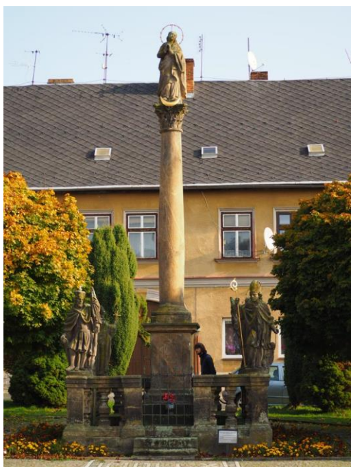
Obrázek 3 – Sousoší na náměstí