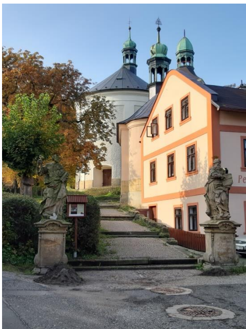
Obrázek 7 – Sochy svatého Petra a Pavla