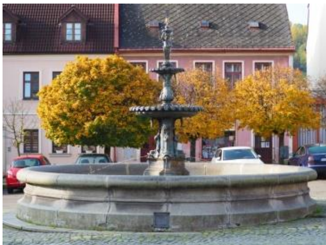
Obrázek 5 – Kašna