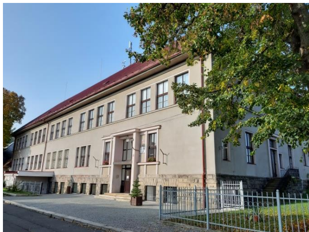
Obrázek 8 – Základní škola T. G. Masaryka

Od roku 1989 se jedná se o velmi prosperující školu, která se postupně rozrůstá o nové učebny, sportovní a dětská hřiště a o přístavbu školní družiny. (Obr. 8)