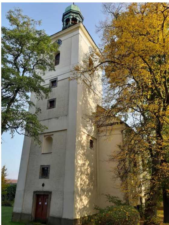
Obrázek 2 – Kostel svatého Prokopa