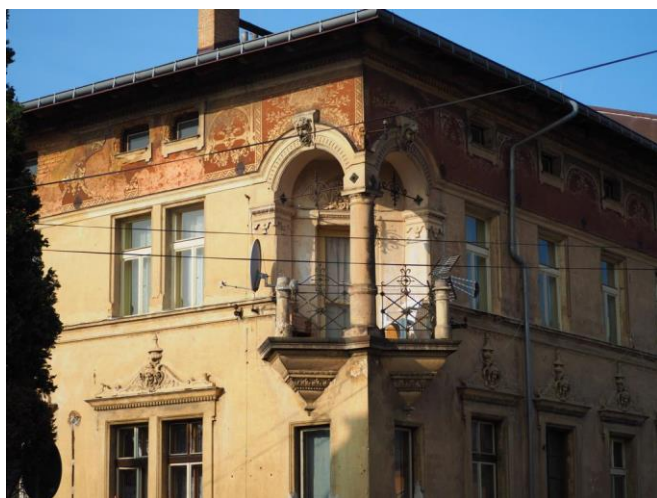
Obrázek 1 – Dům bývalé tiskárny

Významné rodiny, které se podílely na vývoji a prosperitě průmyslu v Hodkovicích, také budovaly mlýny, kterých vzniklo v okolí Hodkovic přibližně jedenáct. Většina těchto mlýnů není již nijak dochována, ale kdysi patřily k velice důležitým provozům v Hodkovicích. (Zajíček 2016, s. 132) Jeden z nejdůležitějších mlýnů byl nejstarší, zvaný Semerádův. Druhým se stal Knoblochův mlýn. (Nejedlo, Buriánek, Čermák 2018, s. 51)