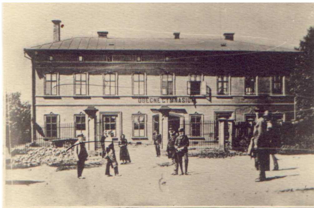
Obr. 5: Původní budova gymnázia, foto z roku asi 1895

Dvůr Králové – Hankovo (1895). Fotohistorie [online]. Radomír Roup, 2015 [cit. 2017-04-11]. Dostupné z: