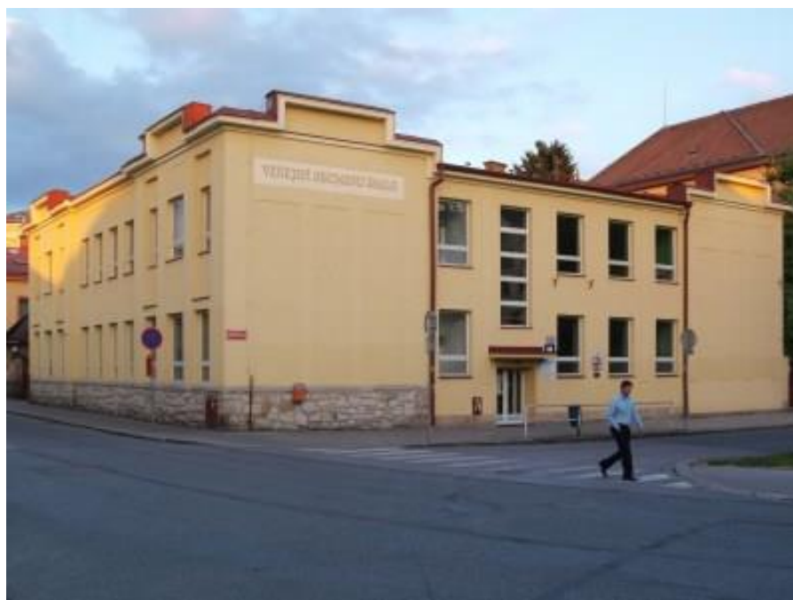
Obr. 2: Dnešní podoba SŠIS dříve Veřejné obchodní školy

Dvůr Králové – nábřeží (1918). Fotohistorie [online]. Ivo Petr [cit. 2017-04-11]. Dostupné z: http://www.fotohistorie.cz/Kralovehradecky/Trutnov/Dvur_Kralove_nad_Labem/Dvur_Kralove_-_Husova/Default.aspx