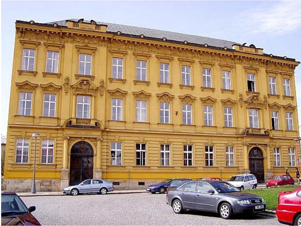
Obr. 7: Dnešní podoba gymnázia

Krkonošský deník [online]. Trutnov: VLTAVA LABE MEDIA, 2014 [cit. 2017-04-11]. Dostupné z: http://krkonosky.denik.cz/zpravy_region/sestilete-tridy-gymnazia-kraj-nakonec-rusit-nehodla-20140115.html