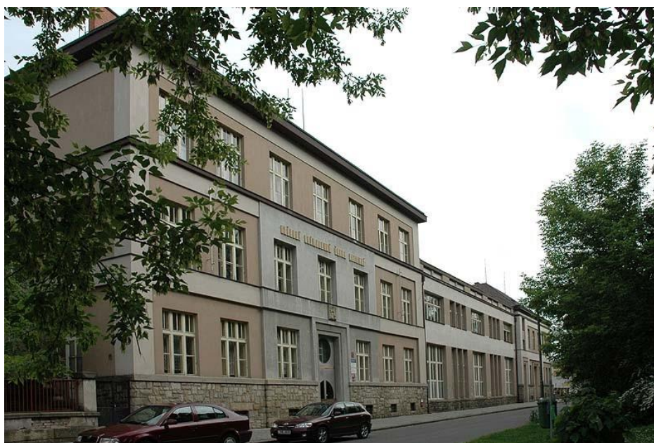
Obr. 4: Dnešní podoba SŠIS dříve Střední průmyslové školy textilní

Dvůr Králové - nábřeží (1920). Fotohistorie [online]. Ivo Petr [cit. 2017-04-11]. Dostupné z: http://www.fotohistorie.cz/Kralovehradecky/Trutnov/Dvur_Kralove_nad_Labem/Dvur_Kralove_-_nabrezi/Default.aspx