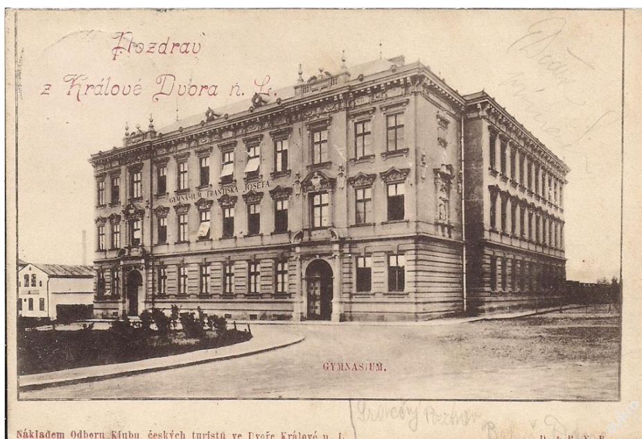
Obr. 6: Nová budova gymnázia, foto z roku asi 1898

http://www.fotohistorie.cz/Kralovehradecky/Trutnov/Dvur_Kralove_nad_Labem/Dvur_Kralove_-_Hankovo/Default.aspx?photoID=28649