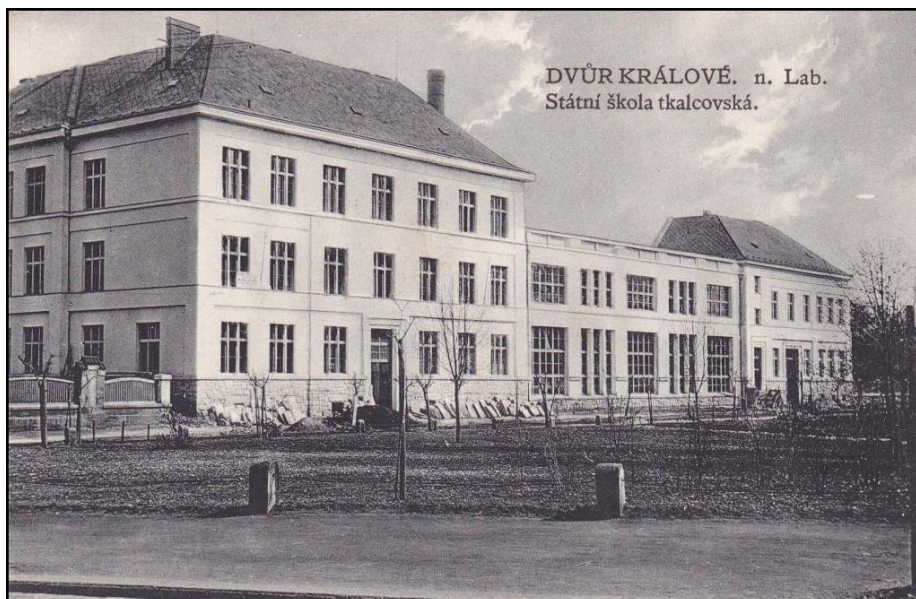
Obr. 3: Státní škola tkalcovská (Střední průmyslová škola textilní), foto z roku 1920

Dvůr Králové - nábřeží (1920). Fotohistorie [online]. Ivo Petr [cit. 2017-04-11]. Dostupné z: http://www.fotohistorie.cz/Kralovehradecky/Trutnov/Dvur_Kralove_nad_Labem/Dvur_Kralove_-_nabrezi/Default.aspx