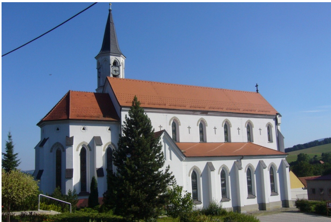
Kostel sv. Cyrila a Metoděje