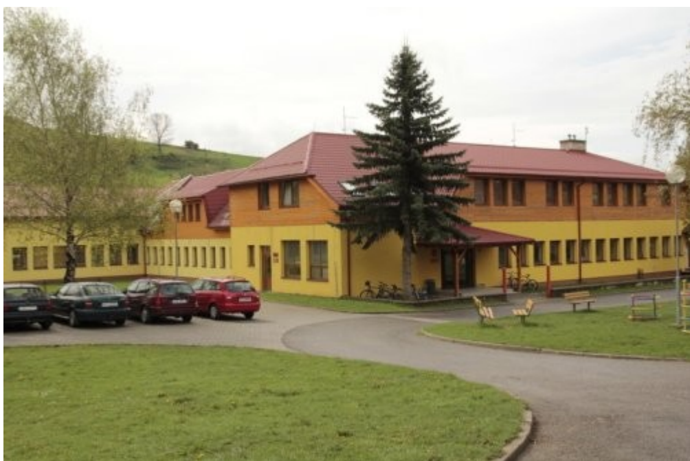
Základní a mateřská škola Březová (Dostupné z: http://www.zsbrezova.eu )