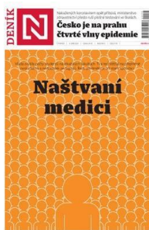
Obrázek 1: титульный лист газеты «Deník N» 1

Заголовок звучит как Naštvaní medici , что будет переводиться как «Разозлённые медики», а задний фон сделан в виде сот пчёл, что создаёт картину у читателя, что таких медицинских работников много и они недовольны прямо как