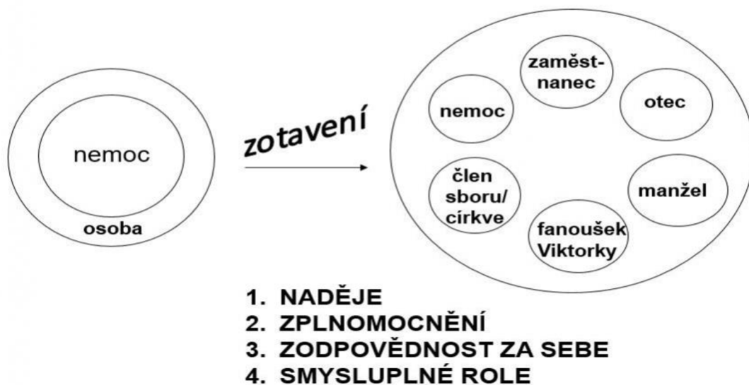
Obr. č. 2 Schematické vyjádření procesu zotavení, RAGINS, M., What's Different About Recovery?