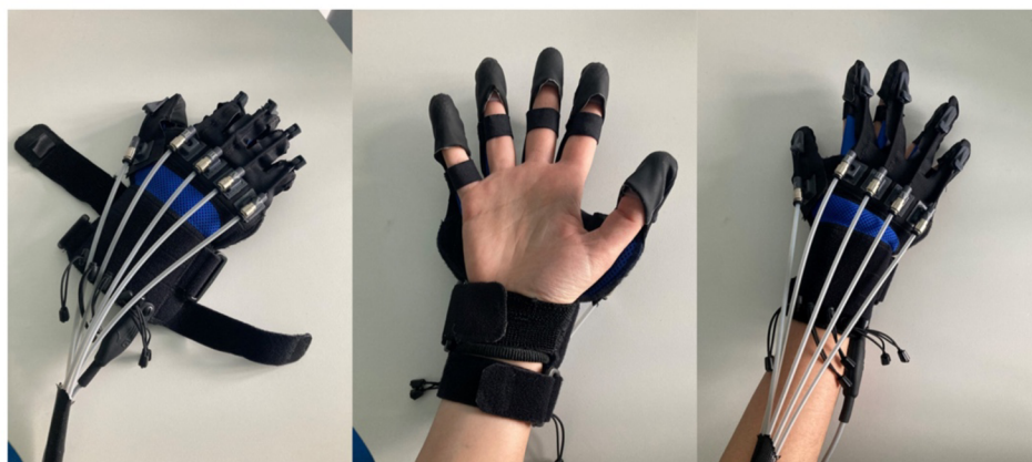
Příloha 3 Robotický systém Gloreha (Bressi et al., 2023)