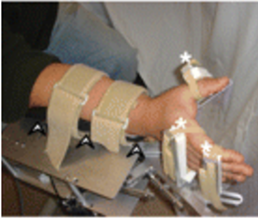
Příloha 5 HWARD robotické zařízení (Takahashi et al., 2008)