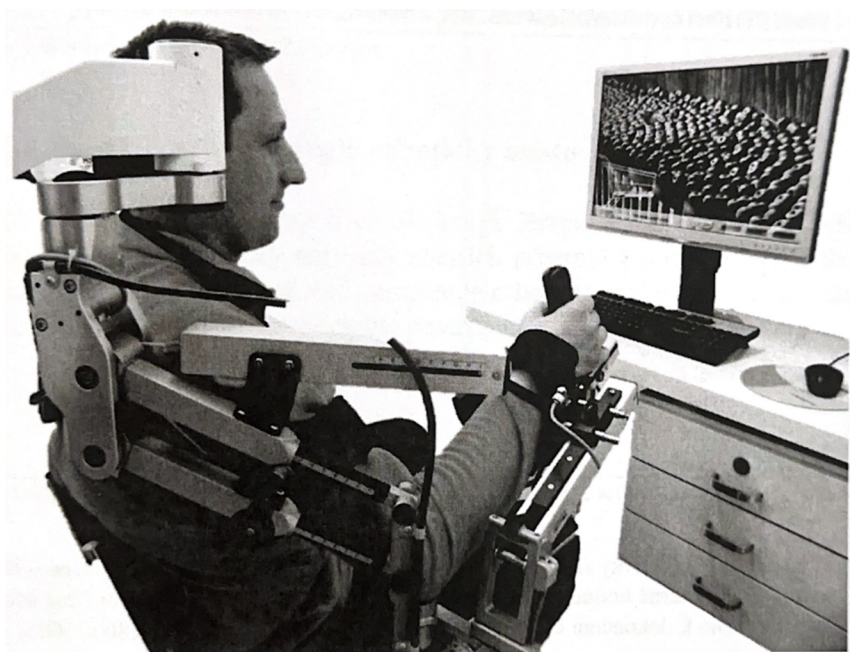
Příloha 2 Armeo Spring (Kolářová et al., 2019)