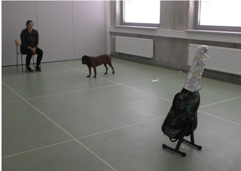
Obr. 2: Experimentální set-up v testu Nový předmět

Test s panenkou ( Doll test, DT ): trvání testu: 2 min