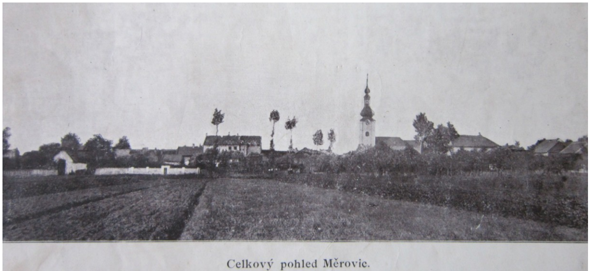
Celkový pohled Měrovic.