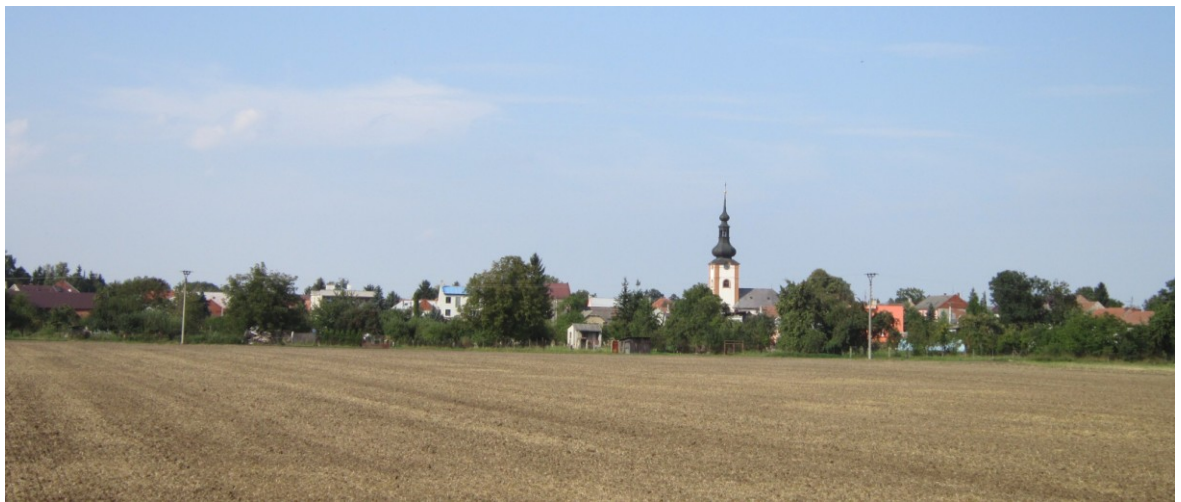
Příloha č. 2 – Pohled na Měrovice od řeky Hané z roku 2011.