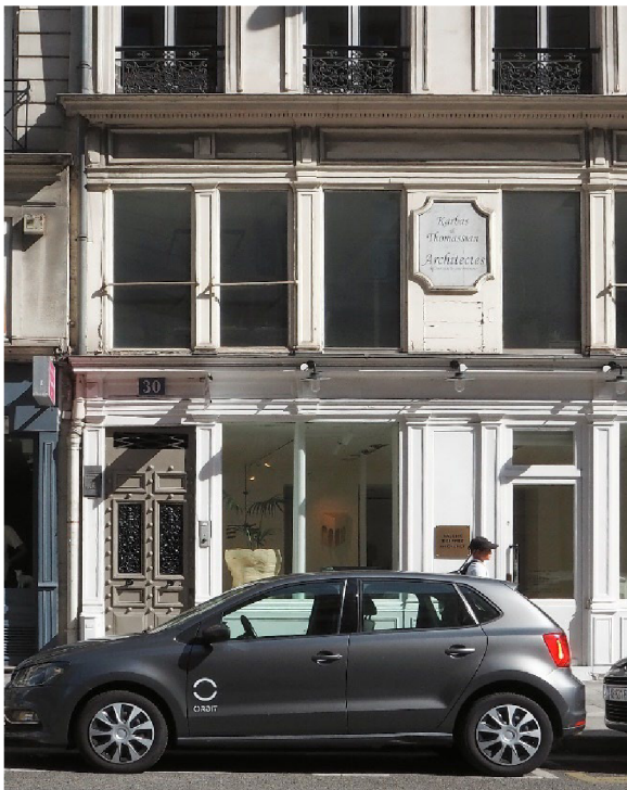
Figure 3 Figure 3 La seconde adresse de Svědectví, 30, la rue de la Croix des Petits Champs, Paris.