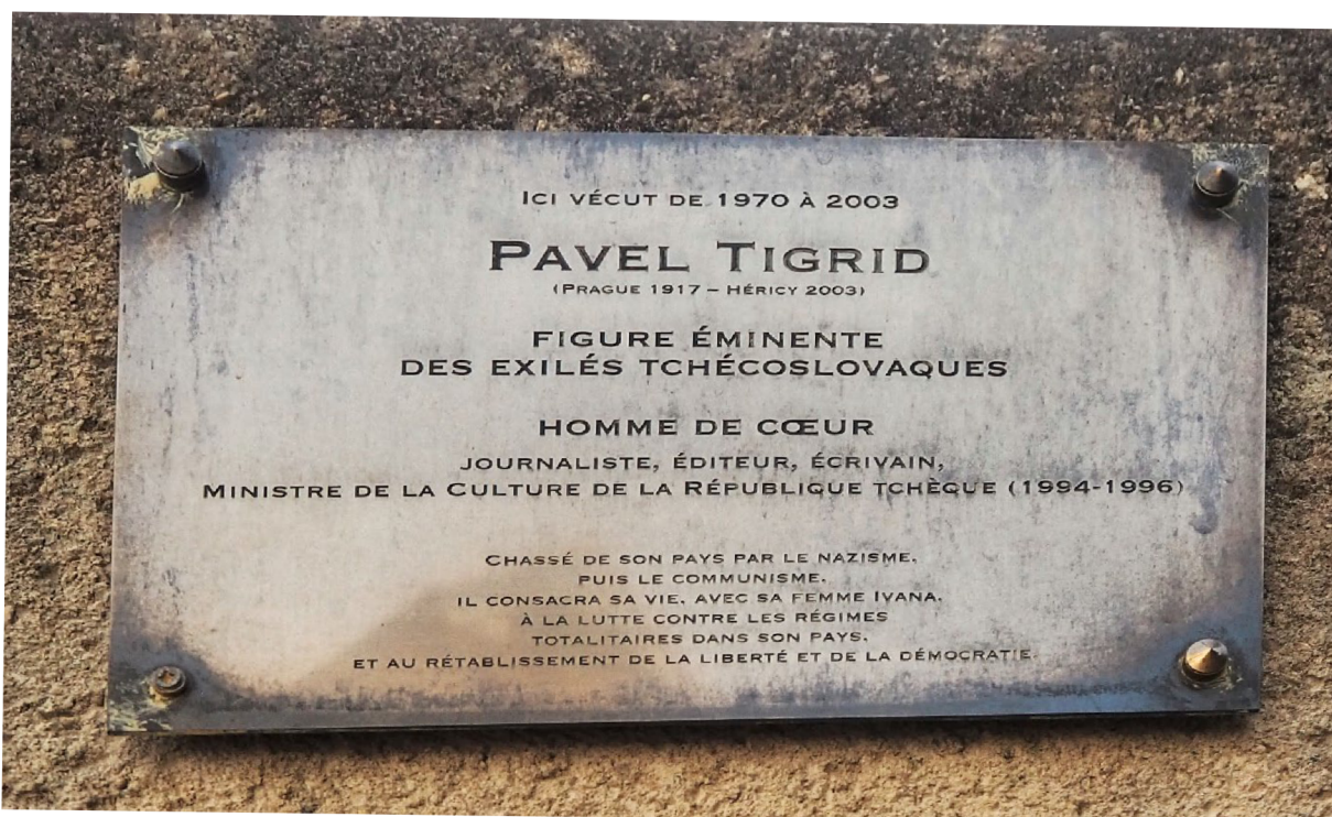
Figure 11 La plaque hommage dédiée à Pavel Tigrid, à Héricy