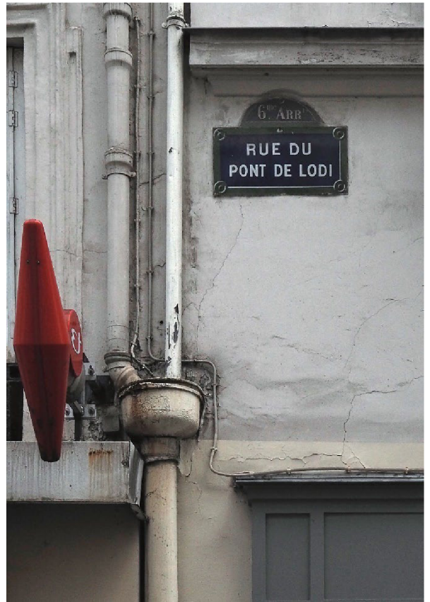
Figure 2 La première adresse de Svědectví dans 6, la rue Pont de Lodi, Paris.