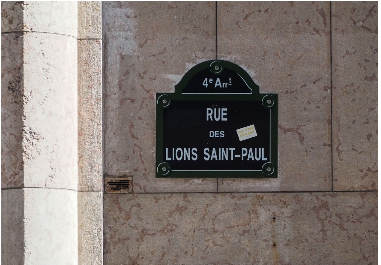
Figure 5 La rue où se trouvait le Comité international pour le soutien des principes de la Charte 77