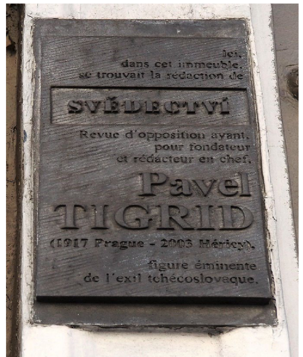
Figure 4 La plaque hommage dédiée à Svědectví, 30, la rue de la Croix des Petits Champs, Paris.