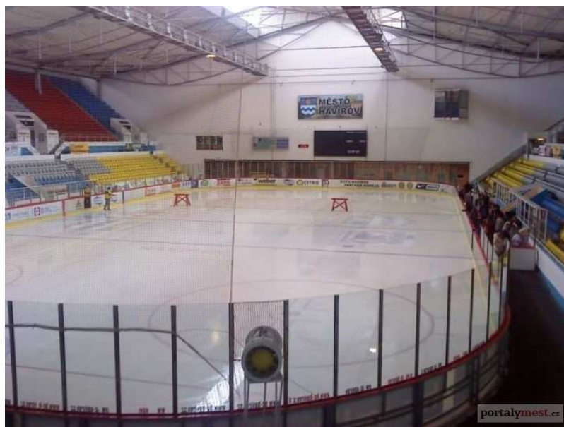
Obr. č. 2 – Víceúčelová sportovní hala Havířov 53

V současné době sídlí klub ve Víceúčelové sportovní hale Havířov a do svého klubu vítá stále nové malé účastníky. Hokejový klub Havířov patří k větším klubům v Moravskoslezském kraji. V současné době se klub snaží získat finanční prostředky ze strukturálních fondů EU – Operačního programu příhraniční spolupráce pro rok 2007 – 2013, konkrétně jde o Fond Mikroprojektů. Název projektu je „Založení regionálního vzdělávacího centra mládežnického hokeje s využitím finančních prostředků z ERDF (Evropský fond pro regionální rozvoj)“.