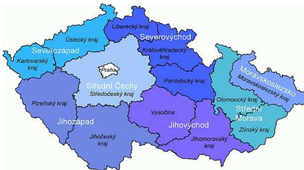
Obr. č. 1 – Mapa krajů a regionů soudržnosti 58

Mapa zobrazuje skladbu 14 krajů (NUTS III) do 8 regionů soudržnosti (NUTS II):