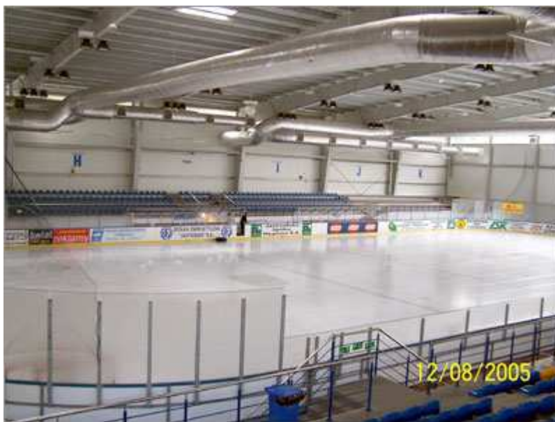
Obr. č. 3 – Zimní stadion Jastrzębie Zdrój 55