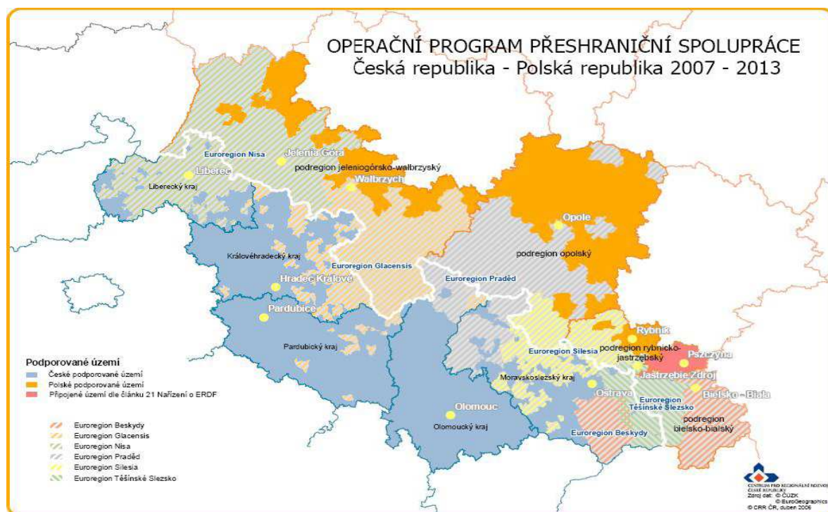
obr. č. 1 – Územní vymezení oblastí 26

Na české straně je příhraniční oblast, které se dotační podpora týká, tvořena pěti územně samosprávnými celky na úrovni NUTS III (kraji): Libereckým, Královéhradeckým, Pardubickým, Olomouckým a Moravskoslezským.