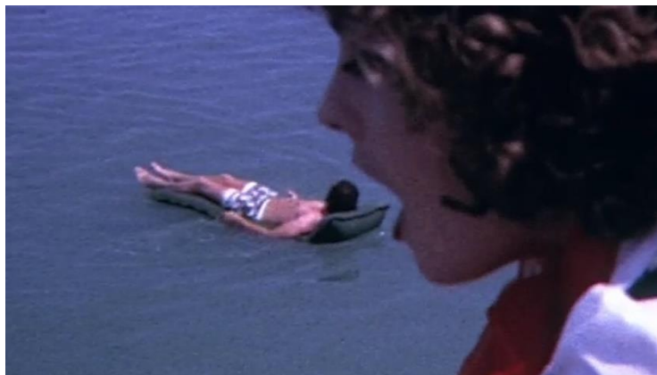
Obrázek 10: Guy Bourdin. Compulsive Viewing - Eat Lilo . 2003

Hranice mezi fashion filmem a experimentálními filmy tohoto období je velmi tenká, což stěžuje popis jeho historie. Platí však, že autoři po zbytek století toto médium prozkoumávají, experimentují s ním a vytvářejí cestu pro plnohodnotný rozvoj fashion filmu jako samostatného žánru.