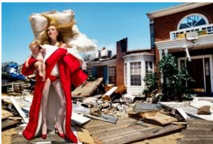
Obrázek 9: David LaChapelle. The House at The End of The World . 2005

Módní fotografie zažívá s příchodem nového století bouřlivou vlnu, přichází spousta nových impulzů a cest, kterými se autoři mohli vydat. Snímky jsou často šokující a posouvají hranici absurdity ve svém žánru.