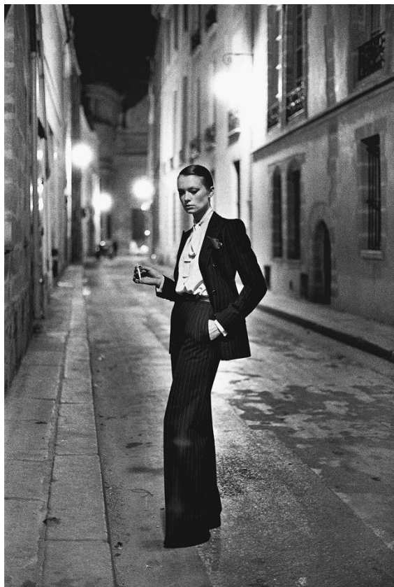
Obrázek 5: Helmut Newton. 1975

Bourdin byl silně ovlivněn surrealismem a autory jako René Magritte, Alfred Hitchcock nebo Man Ray. Dokázal vytvořit šokující a mysteriózní situaci, která nevšedním způsobem obsahovala módní produkt, tím byl jedinečný a ovlivnil žánr módní fotografie. 18