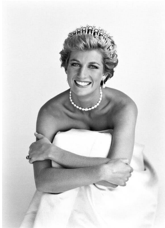
Obrázek 7: Patrick Demarchelier. 1990

Ten totiž tuto skupinu modelek vyfotografoval pro obálku Vogue a zobrazil ji v poměrně neobvyklém světle. Jeho fotografie totiž působí velmi přirozeně a lidsky. Modelky se neusmívají pro fotografii, nýbrž se upřímně smějí, nevadilo, pokud se někdo podivně tvářil, fotografie zachycují jejich krásu v té nejčistší formě. 23