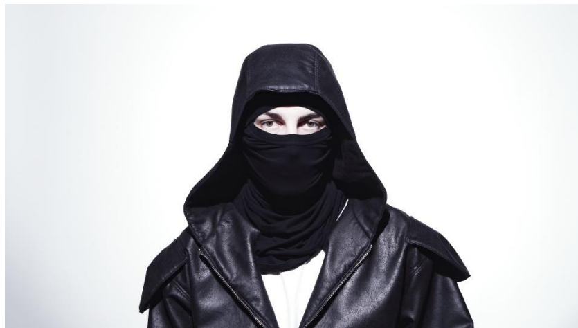
Obrázek 18: Autorský Fashion film

Film zároveň využívá experimentálních prvků, které by měly videu dodávat nevšední a osobitou náladu. Jsou praktikovány techniky jako dlouhá expozice, která vytváří zkreslený pohled a přispívá k dosažení pocitu chaosu. Dále jsou použity abstraktní záběry, které jak vyvolávají nejasné emoce pomocí nekonkrétních vjemů, tak vizuálně zcelují film. Veškeré typy záběrů, volba barevnosti a kombinace kontrastních prvků slouží k utvoření mysteriózní atmosféry, která koresponduje s esencí módní značky a prezentuje tak produkt i v momentě, kdy se na obrazovce zrovna nenachází.