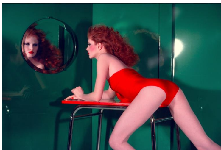
Obrázek 6: Guy Bourdin. 1977