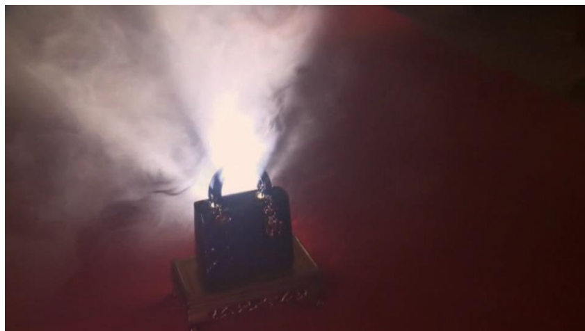
Obrázek 12: David Lynch. Lady Blue Shanghai . 2010

Spolupráce módních značek a Davida Lynche na vytvoření fashion filmu je tedy logický krok, který tento žánr zcela jistě obohatil. Příklad takové spolupráce je fashion film z roku 2010 s názvem „Lady Blue Shanghai“, který propaguje kabelku značky Dior. Lze pozorovat autorovu typickou práci s barvami a s experimentálními prvky, jakým je zde například použití dlouhé expozice. Kabelka je zasazena do mysteriózního příběhu odehrávajícího se v Shanghai tak, že na první pohled ani nemusí být jasné, co má krátkometrážní film propagovat. Právě Lynchova práce s produktem je pro mě na tomto filmu zajímavá. Nejedná se totiž pouze o záběry na to, co je třeba prodat, je vytvořen imaginární svět a příběh, kterého je produkt součástí.