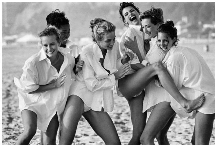
Obrázek 8: Peter Lindbergh. 1988