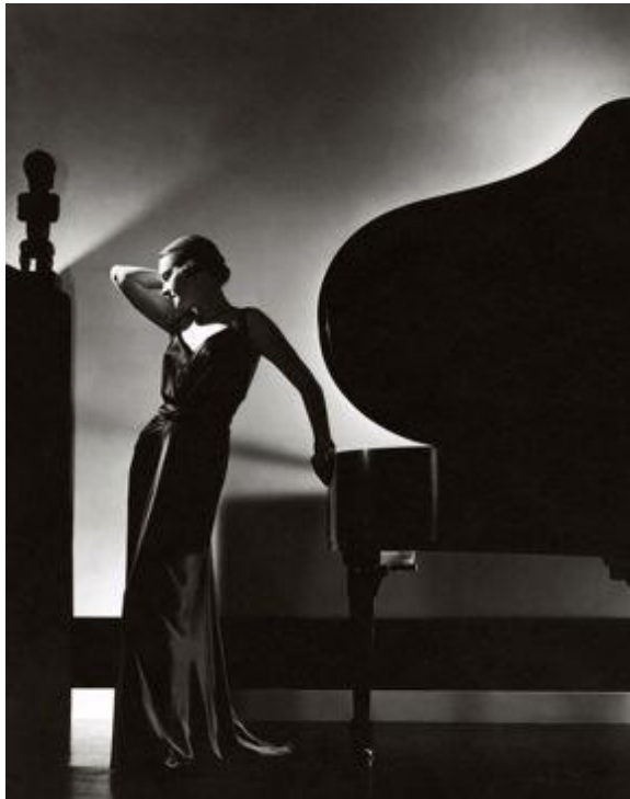
Obrázek 1: Edward Steichen. Perfection in Black . 1935

Zajímavá je tvorba Martina Munkacsiho a Toni Frisselové, která určitým způsobem předbíhá svou dobu a vybočuje z řady. Oba tito autoři jdou totiž proti současnému trendu a módu fotografují venku. Jejich fotografie jsou dynamické a specifické svým venkovním prostředím.