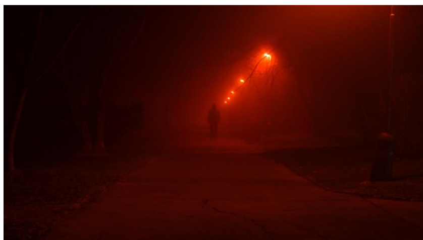
Obrázek 19: Autorský Fashion film