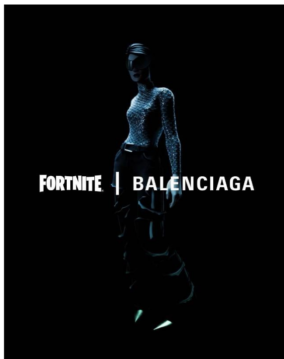
Obrázek 14: Balenciaga x Fortnite. 2021

Hlavní otázkou tak opravdu je, do jaké míry se odvětví módy přesune do sféry virtuální a jak to změní podobu fashion filmu. Zdali 3D animace zcela nahradí jeho doposud známé zpracování nebo zůstane pouze součástí či variantou a co tedy nakonec bude tou přední inovací, která dá žánru nový směr. Ať už se bude jednat o umělou inteligenci, 3D generování, možnost diváka s médiem více interagovat nebo určitou kombinaci, fashion film se na internetu zrodil a dokázal, že se dokáže elegantně přizpůsobovat. Což je to, co od budoucnosti tohoto žánru očekávám, že přijme nové trendy a technologie a využije je v takovém měřítku, které zaručí vývoj ale i zachování kvality.