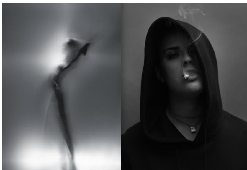
Obrázek 15: Nick Knight. Mother . 2015

Nick Knight prezentuje dramatické prostředí tvořeno zmíněným kontrastem a dalšími prvky jako například tempem. Stříhy jsou ostré a rytmické, ale video plynulé. V kombinaci se zvolenou hudbou působí film jak drsně, tak vznešeně. Vizuální a zvukové zpracování vytváří napětí, gradaci a náladu, která koresponduje s nádechem propagované módní kolekce.