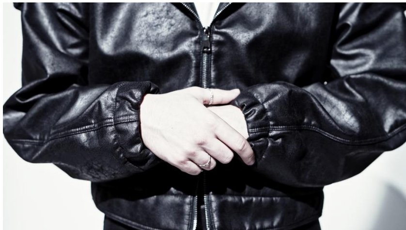
Obrázek 20: Autorský Fashion film

Výsledkem je celistvé video o délce několika pár minut, které pomocí převážně abstraktního příběhu prezentuje módní produkt, jenž je zasazen do prostředí a atmosféry, která se odvíjí od nálady samotné značky. Tato atmosféra je vytvořena pomocí kontrastních záběrů a scén, které vizuálně doplňují vzhled produktu. V průběhu tvorby se vyskytly komplikace například s nedostatečně rozsáhlým týmem, které mohly způsobovat fungování pod stresem, nebo s krátkým časovým prostorem, který neumožňoval prostor na případné pochybení. Znat samozřejmě byla i nedostatečná praxe v oboru audiovize, která se nedá řešit jinak než samotnou tvorbou. Práce s videem i spolupráce s módním návrhářem pro mě však byla velkou a přínosnou zkušeností, jejíž výsledkem je autorský fashion film a osobité umělecké vyjádření, na které jsem hrdý, a které položilo základ pro mou budoucí práci nejen s tímto médiem.