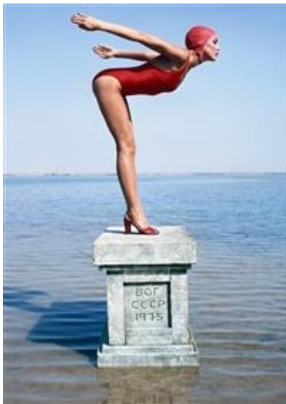
Obrázek 4: Norman Parkinson. 1976

Tvorbu úspěšných autorů tohoto období spojuje v kontextu módní fotografie zobrazování módy venku, mimo studio. Inspirující výjimkou je Irving Penn, který si drží svůj osobitý styl a mezi stěnami fotografického ateliéru zachycuje módu svým proslule poznatelným rukopisem.