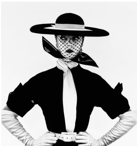
Obrázek 3: Irving Penn. Black and White Vogue Cover . 1950