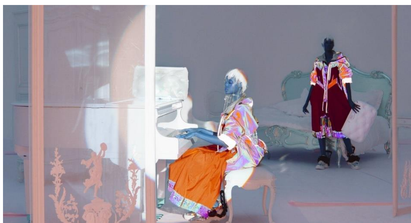
Obrázek 11: Nick Knight. Reality Inverse . 2019

Posledním dílem Nicka Knighta, které bych rád zmínil, je film „Reality Inverse“ z roku 2019, který byl vytvořen pro London Fashion Week. 36 Knight je proslulý svou prací s nejnovějšími technologiemi a častým zobrazováním budoucnosti a jakýchsi hybridních tvorů. To lze vidět například na NFT kolekci „ikon-1“ nebo právě na tomto filmu, kde je za použití převrácené čočky vytvořen podivný až mimozemský vzhled modelky. Tato práce s inverzními barvami při zobrazování módního produktu pro mě zároveň symbolizuje fakt, že podstata fashion filmu je prezentovat spíše než přesnou podobu oblečení jeho esenci a atmosféru. Což je jeden z mnoha důvodů, proč je pro mne Nick Knight velkou inspirací a vzorem, stejně jako pro nespočet dalších autorů.