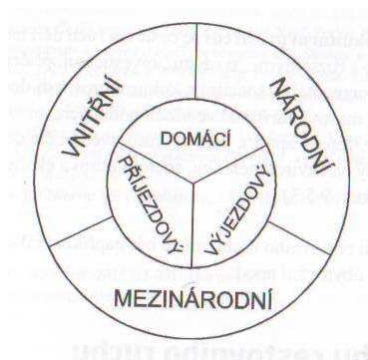
Obrázek 1: Typy cestovního ruchu podle místa realizace

Podle místa realizace služeb lze cestovní ruch rozdělit na vnitřní, národní a mezinárodní cestovní ruch . Vnitřní cestovní ruch je domácí cestovní ruch s příjezdovým cestovním ruchem. Národní cestovní ruch je domácí cestovní ruch a výjezdový cestovní ruch. Mezinárodní cestovní ruch je vždy při překročení hranic státu a tvořen příjezdovým a výjezdovým cestovním ruchem. 20 Pro lepší orientaci členění je připojeno obrazové vyjádření.