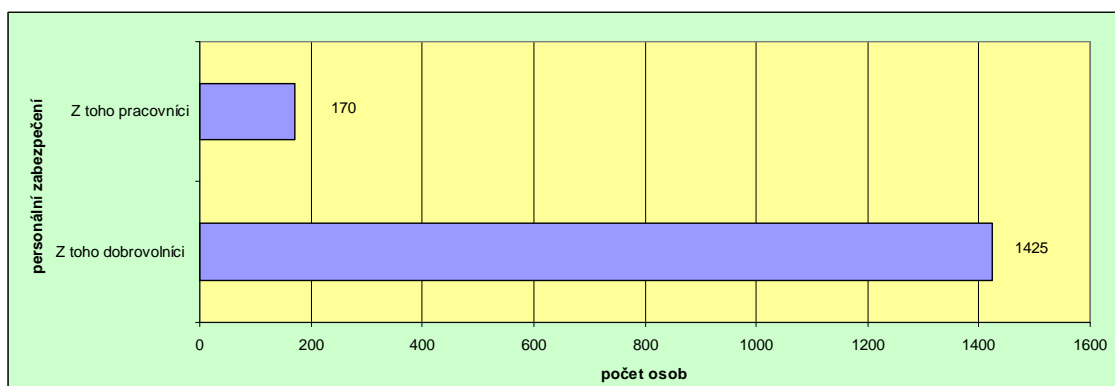
Graf 3: Personální zabezpečení zotavovacích akcí