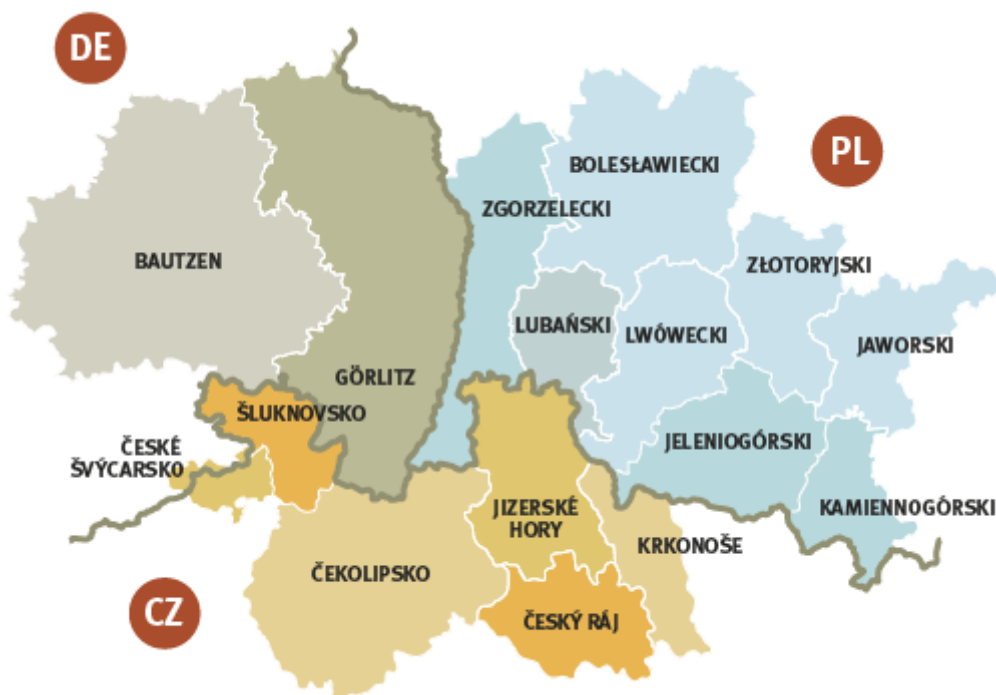
Mapa č. 2 Euroregion Nisa

Za zmínku také stojí euroregion tří hraničních oblastí České republiky, Spolkové republiky Německo a Polské republiky. Svým vznikem v roce 1991 se jedná o první přeshraniční strukturu ve střední a východní Evropě. Hlavní náplní tohoto dobrovolného zájmového sdružení obcí a okresů bez právní subjektivity je podpora rozvoje spolupráce v pohraničí. Kromě hlavních hospodářských oblastí se rozvíjí spolupráce také v oblastech rozvoje příhraniční turistiky, kulturní výměny a péče o společné kulturní dění.