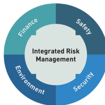
Obr. 3 - Integrované řízení rizik

Opět akcentována důležitost správného pochopení řízení rizik. Zde především s ohledem na provádění jednotlivých oblastí bezpečnostních rizik (Safety a Security) a ekonomičností provozu (Finance) a dopadem na životní prostředí (Environment), což popisuje Obr. 3. Dále je zmíněna důležitost zaměření na celkové snížení rizika pro organizaci.